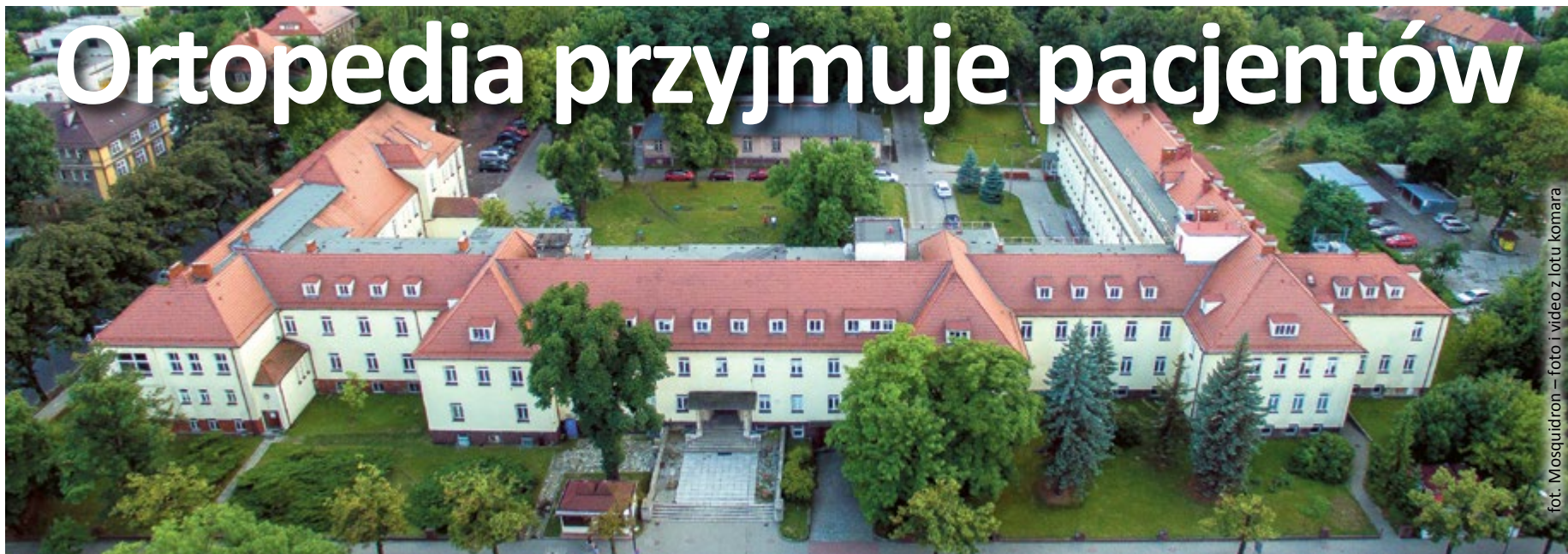
fot. Mosquidron – foto i video z lotu komara

Zgodnie z zapowiedziami, na ortopedii w Szpitalu nr 4 przy ul. Kościuszki 29 zaczyna pracować nowy zespół lekarzy. Pacjentów przyjmuje też poradnia przyszpitalna działająca w budynku dawnego szpitala wojskowego przy ul. Zygmunta Starego 20.