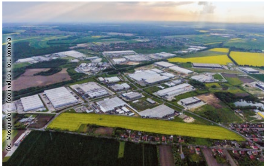
fol. Mosquidron – foto i video z lotu komara