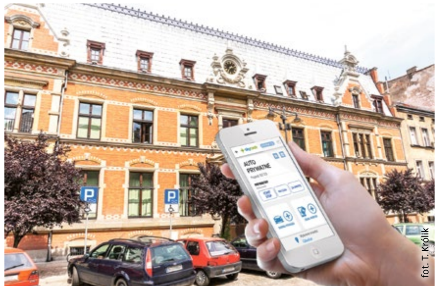
fol. T. Królik