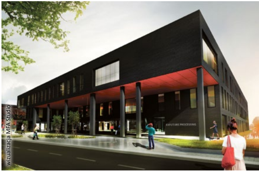
wizualizacja MFA Studio