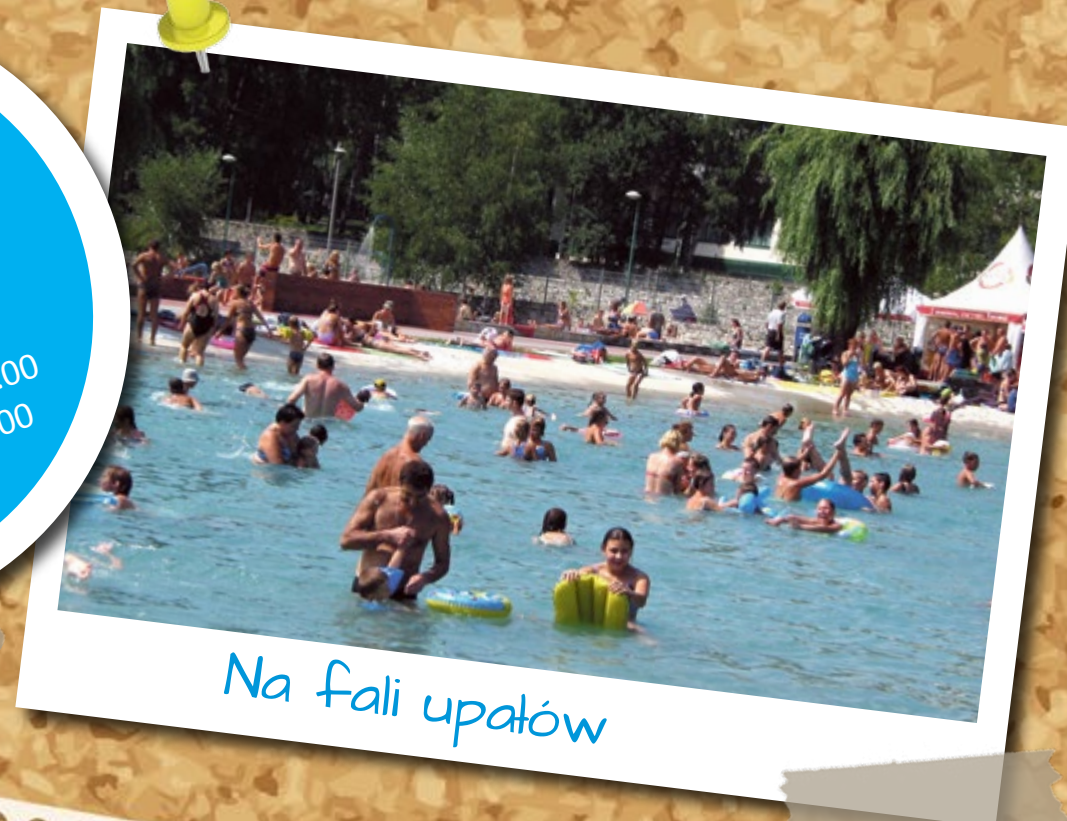
Na fali upałów