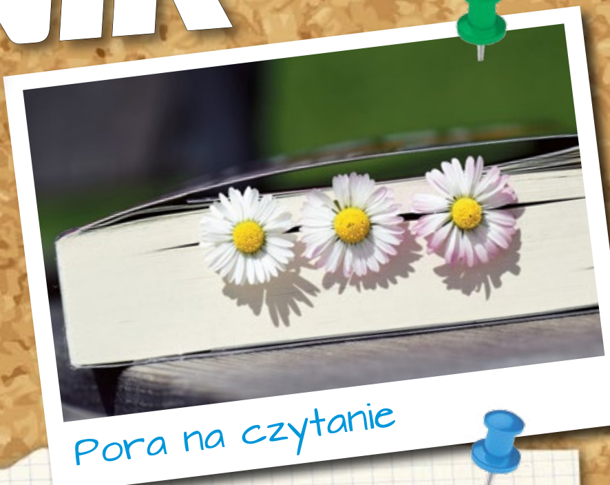
Pora na czytanie

Ci, którzy chcą spróbować zabawy z gliną, powinni skontaktować się z gliwickim Stowarzyszeniem Forum Ceramików (e-mail: artcera-mika@gmail.com , tel.: 608-724-022). W Pracowni Rzeźby i Ceramiki (ul. Ziemowita 1) w sierpniowe przedpołudnia będzie można wy-czarować małe dzieła sztuki inspirowane wakacyjną przyrodą. (mm)