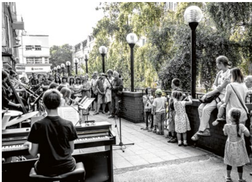
W Ruinach Teatru Victoria wkrótce zabrmi jazz. 5 sierpnia rozpocznie się 12 Międzynarodowy Festiwal Jazz w Ruinach. Program festiwalu na www.jazzwruinach.pl