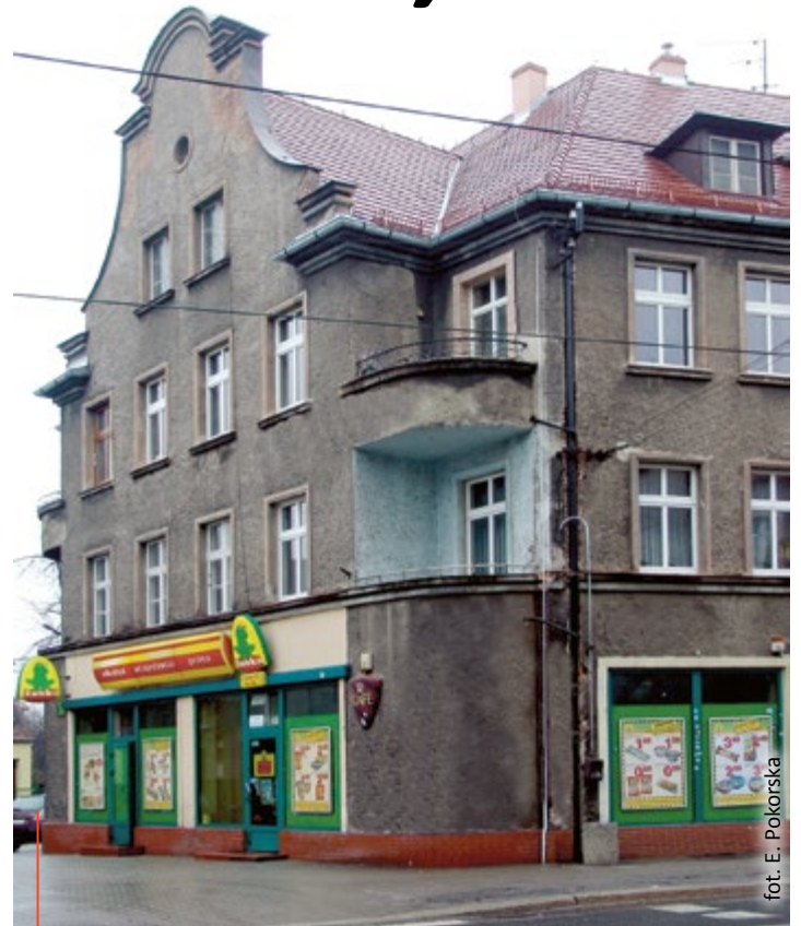
Jedna z reprezentacyjnych kamienic wg projektu K. Schabika, zlokalizowana u zbiegu ulic Ignacego Daszyńskiego i Aleksandra Puszkina

Gliwickie modernistyczne budowle użyteczności publicznej, kościoły oraz kamienice, na które miał mniejszy czy większy wpływ K. Schabik, miały często elewacje wykończone cegłą klinkierową. Obiektem o tak wykonanych ścianach jest zespół szpitalny, dawna klinika położnicza Landes-Frauenklinik przy ul. Wybrzeże Armii Krajowej 15. Została ona zbudowana w latach 1931–1933,