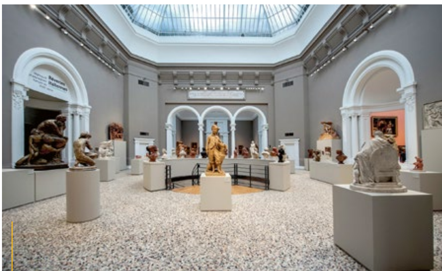
Valenciennes ze względu na swoją artystyczną historię nazywane jest Atenami Północy. W ubiegłym roku zakończył się kapitalny remont miejskiego muzeum

Idea zrównoważonego rozwoju polega na tym, żeby nowoczesność i rozwój gospodarczy szły w parze z poszanowaniem środowiska naturalnego i zapewnieniem mieszkańcom atrakcyjnych terenów rekreacyjnych. Dumą Valenciennes są tereny zielone: parki, skwery i zieleńce zajmują 90 ha powierzchni miasta. Być może najpiękniejszy jest park Rhônelle w stylu angielskim. W 2014 roku w mieście oddano także do użytku nową inwestycję: Ogrody Florales. Na 3000 m 2 posadzono drzewa owocowe i aromatyczne rośliny – w takim otoczeniu bardzo chętnie odpoczywają mieszkańcy. (mm)