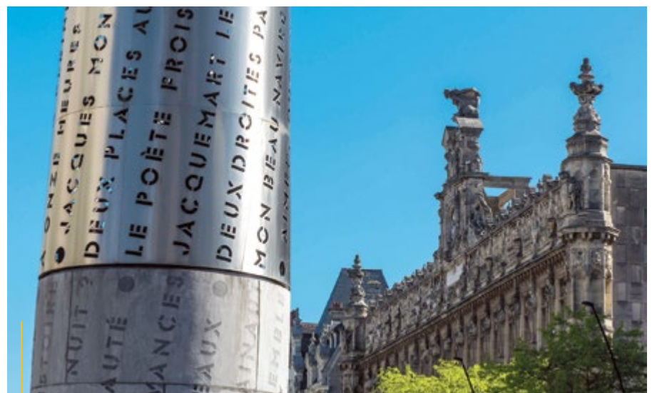
Na pierwszym planie nietypowa, strzelista dzwonnica, której ściany pokrywa wygrawerowany tekst litanii. W tle ratusz z ozdobną fasadą