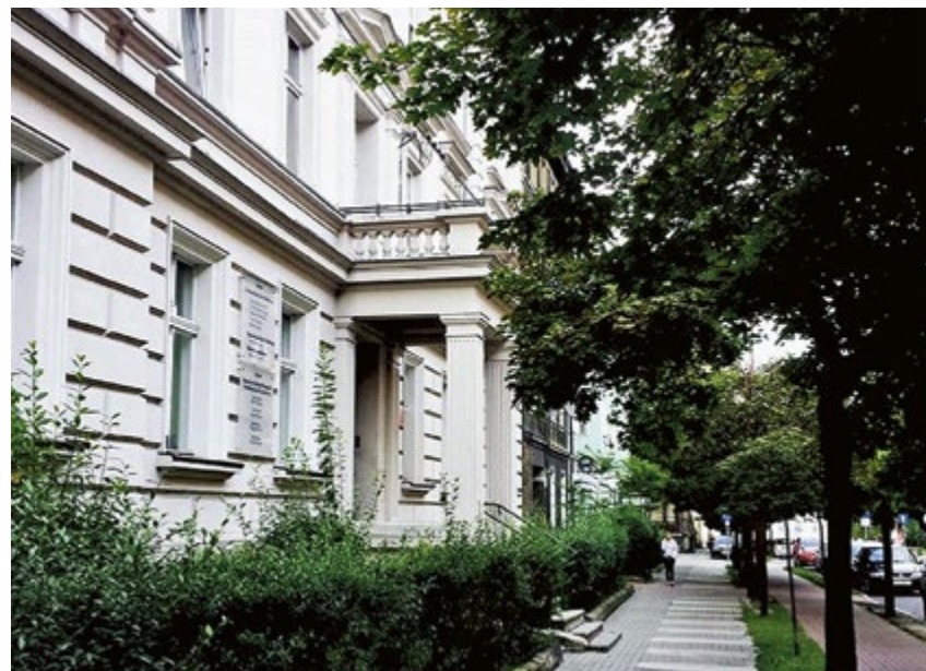
Al. W. Korfanteo – jedna z najładniejszych gliwickich ulic w sierpniowej odświeżeniu. Stylowe kamienice podkreślają urok jednego z najładniejszych zakątków miasta i zachęcają do spacerów.