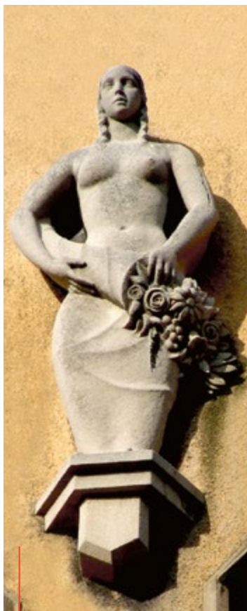
Rzeźba autorstwa Hansa Breitenbacha na fasadzie budynku przy pl. marszałka Józefa Piłsudskiego