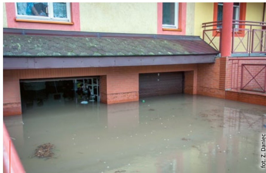
fol. Z. Daniec