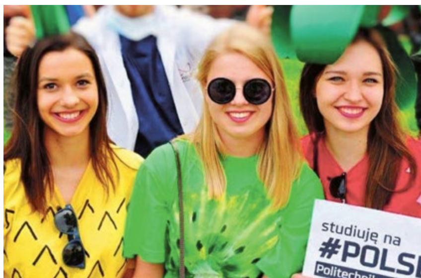
Na Politechnice Śląskiej rozpoczęła się rekrutacja uzupełniająca. Trwa również akcja „Dziewczyny na Politechnikę”. Panie stanowią 35% studiujących – najwięcej jest ich na Wydziale Organizacji i Zarządzania, Wydziale Inżynierii Środowiska i Energetyki oraz Wydziale Architektury.