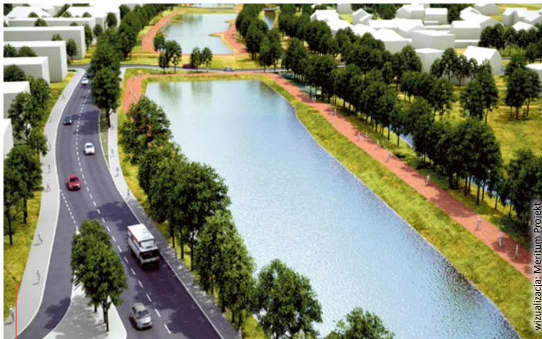
Wstępny projekt zbiorników retencyjnych wypełnionych wodą z Ostropki

Przestrzeń przy ul. Słowackiego od 2000 r. jest przeznaczona na tereny zalewowe, widnieją też w miejscowym planie zagospodarowania. Z ekspertyzy Zakładu Ochrony Wód Głównego Instytutu Górniczego w Katowicach wynika, że suche zbiorniki na potoku Ostropka uznano za część optymalnego rozwiązania redukującego ryzyko powodziowe. Badania obejmujące m.in. modelowanie hydrauliczne oraz analizę kosztów i korzyści potwierdziły zasadność realizacji projektu, nadając mu status inwestycji strategicznej, znacząco redukującej ryzyko powodziowe na obszarze o najwyższym stopniu ryzyka. Inwestycja jest na etapie projektowania.