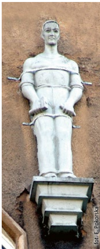
fol. E. Pokorska