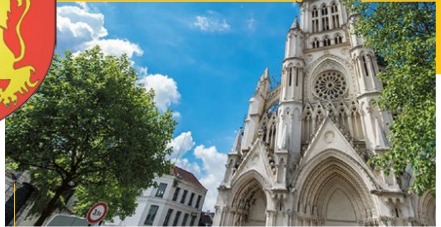
Neogotycka bazylika Notre-Dame-du-Saint-Cordon uniknęła zniszczeń podczas I i II wojny światowej

Ze współczesnych budynków niewątpliwie wart uwagi jest teatr Le Phénix, w którym prezentowane są przedstawienia teatralne, muzyka i taniec. W 2007 roku w Valenciennes wybudowano także nietypową dzwonnice, strzelistą