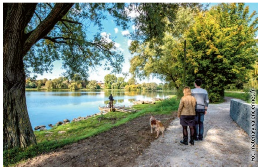
Dumą mieszkańców Valenciennes są tereny zielone: parki, skwery i zieleńce zajmują 90 ha powierzchni miasta

i wysoką na 45 metrów. Jej ściany pokrywa wygrawerowany tekst litanii, którą współtworzyło blisko 2000 osób.