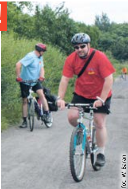
fol. W. Baran