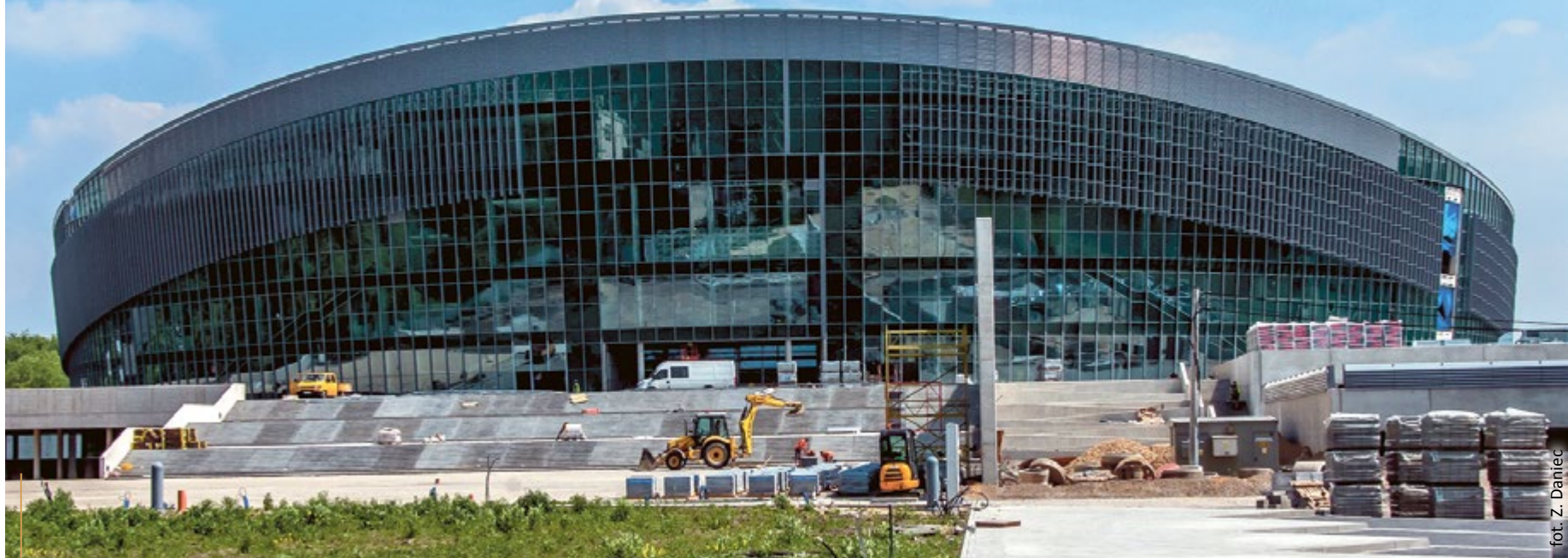
Widowiskowo-sportowa Hala GLIWICE będzie jednym z największych tego typu obiektów w Polsce

Na początku lat 90. ubiegłego wieku Gliwice były jednym z najbiedniejszych miast dawnego woj. katowickiego. Dzisiejszy obraz Gliwic jest zupełnie inny. Miasto nieustannie się rozwija. Zajęło trzecie miejsce w rankingu zamożności samorządów w kategorii miasto na prawach powiatu przeprowadzonym przez czasopismo „Wspólnota” oraz trzecie miejsce w Rankingu Samorządów 2016 wśród miast na prawach powiatu przeprowadzonym przez dziennik „Rzeczpospolita”. Przede wszystkim jednak Gliwice tętnią życiem i są doceniane przez mieszkańców.