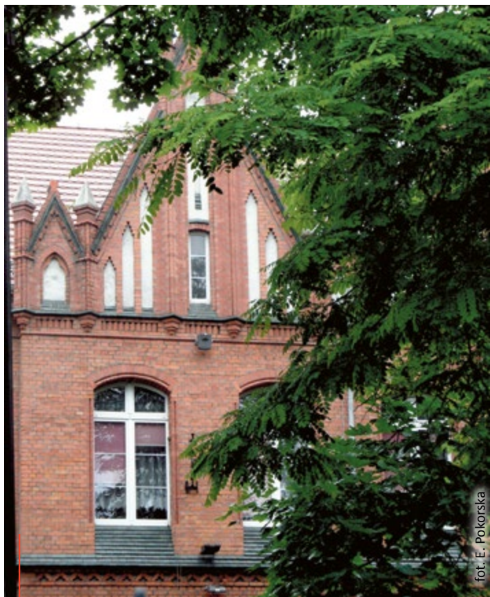
Szkoła Podstawowa nr 7 przy ul. Tarnogórskiej, która została wybudowana 117 lat temu