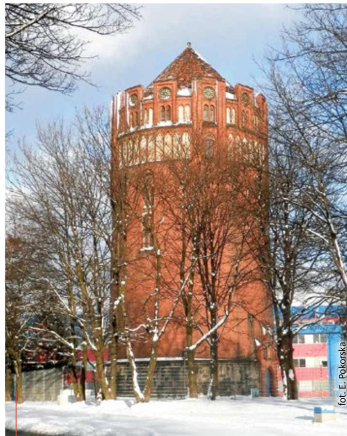
Najstarsza wieża ciśnień w Gliwicach znajduje się przy ul. Leśnej

Jest najstarszą zachowaną wieżą wodną w Gliwicach, wzniesiono ją w 1894 r. w stylu ceglano-gotyku.