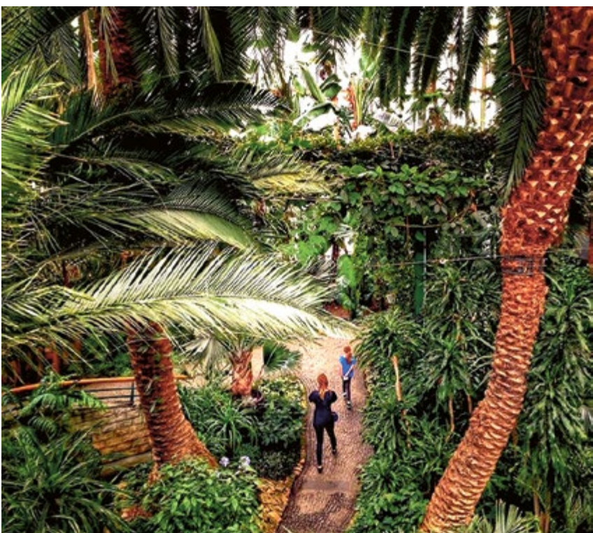
PALMIARNIA. Gliwickie tropiki gotowe na przyjęcie gości. Po przerwie technicznej Palmiarnia Miejska znów jest otwarta dla odwiedzających.