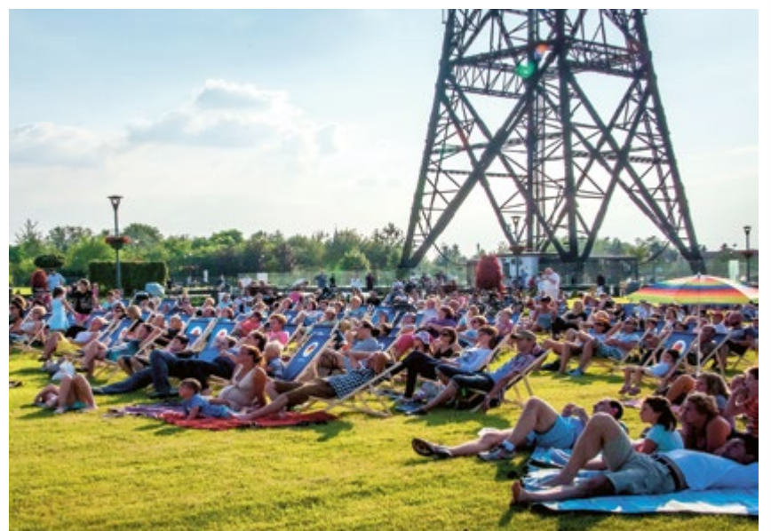
RADIOSTACJA. Na leżąco, na siedząco – jak kto woli. Tym razem miłośnicy kina plenerowego bawili się przy Radiostacji. W najbliższą niedzielę, na placu Grunwaldzkim, obejrzą „Skubanych” i „Nieracjonalnego mężczyznę”.