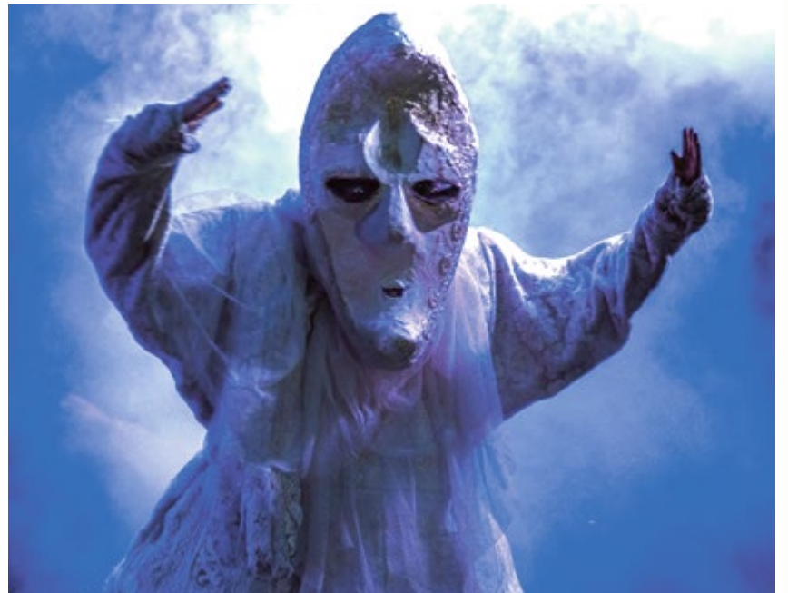
PARK CHOPINA. W ostatni weekend publiczność bawiła się z Wędrującymi Lalkami Pana Pezo podczas spektaklu „Moonsters”.