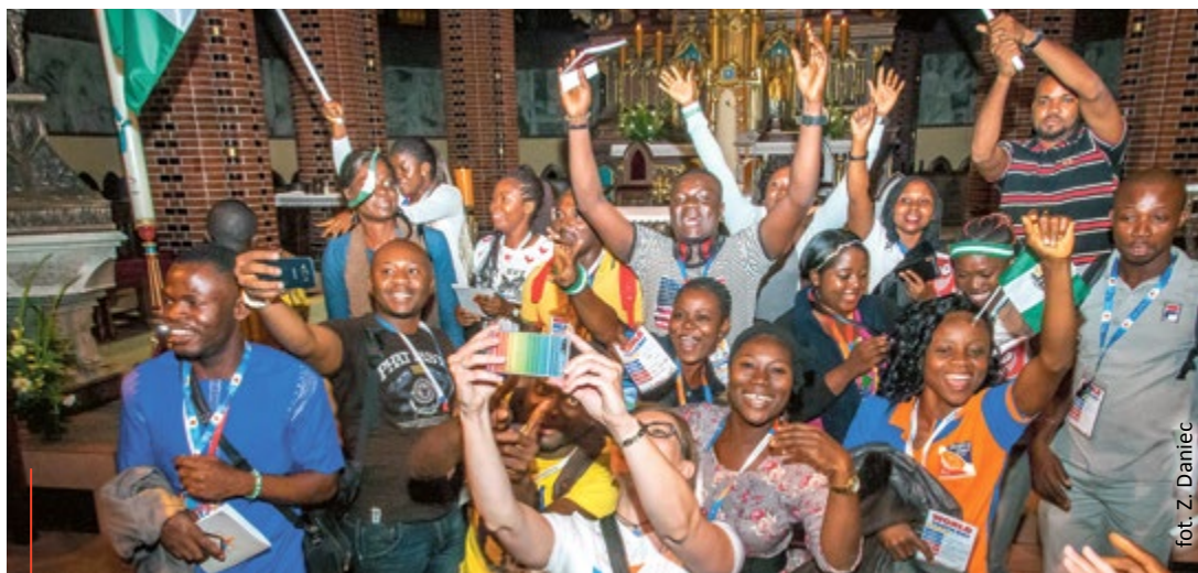
Młodzież z całego świata spotkała się w Gliwicach, by wspólnie świętować, modlić się i celebrować Światowe Dni Młodzieży. Dla wszystkich było to niezapomniane przeżycie