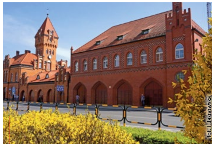
Zabudowania Straży Pożarnej z końca XIX wieku do dziś zachowały swą pierwotną funkcję i oryginalny charakter