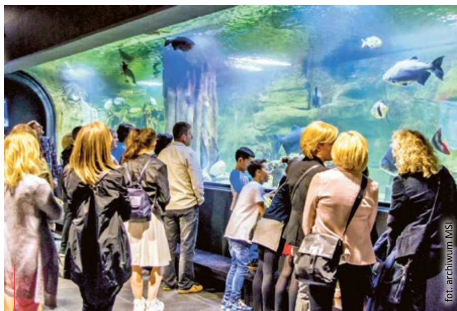
Największą atrakcją gliwickiej Palmiarni jest pawilon akwarystyczny. „Podwodny Świat” bije rekordy popularności

Rozwój nie znosi stagnacji, dlatego Gliwice ciągle inwestują. Niedawno zakończono budowę gliwickiego odcinka Drogowej Trasy Średnicowej, która zdecydowanie usprawniła ruch w całej aglomeracji śląskiej. Powoli kończy się