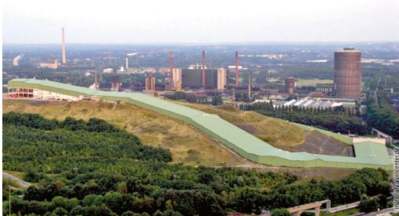
Alpincenter – całoroczny kryty stok narciarski na jednej z dawnych hałd