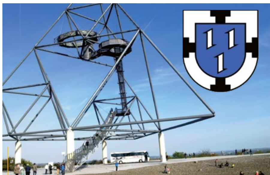
„Tetraeder” – z platformy widokowej umieszczonej na metalowej konstrukcji można podziwiać krajobraz rozciągający się wzdłuż rzeki Emscher