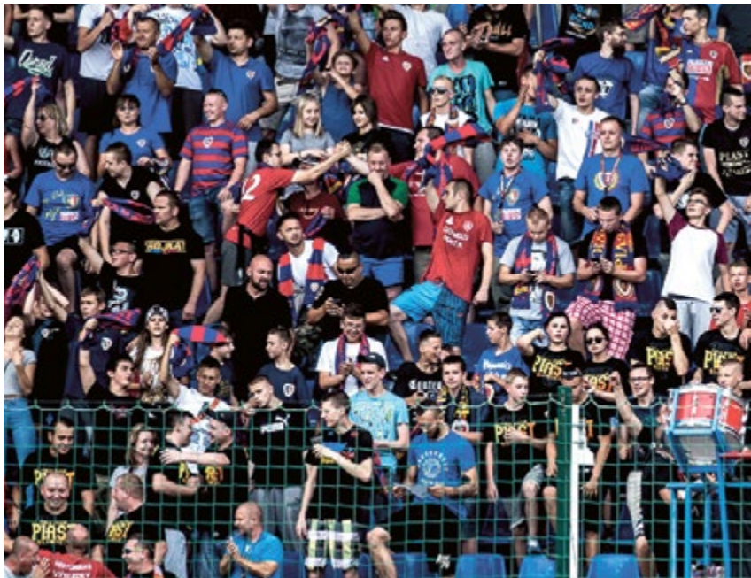
OKRZEI. Dobry doping kibiców Niebiesko-Czerwonych przyniósł efekt. Piast Gliwice wygrał z Wisłą Płocki 2:1.