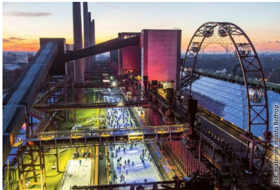
Zollverein – jedna z głównych atrakcji Europejskiego Szlaku Dziedzictwa Przemysłowego

Co 2 lata, w ostatnią niedzielę września, w Bottrop odbywa się Michaelismarkt – czyli jarmark św. Michała i święto miasta. Na rynku pojawiają się liczne kramy, na których rzemieślnicy wystawiają swoje prace, są występy artystyczne oraz walki rycerskie. Otwarte są też wszystkie sklepy. Co 3 lata mieszkańcy przebierają się w niebieskie stroje i czerwone chustki i świętują Bretzelfest, którego tradycja sięga 1883 r. Głównym punktem programu jest rywalizacja w rzucaniu drewnianym kołkiem do wielkiego precla. Na zakończenie ulicami miasta przechodzi barwny korowód. Co ciekawe, z okazji Bretzelfest mieszkańcy mają dni wolne. (nd)