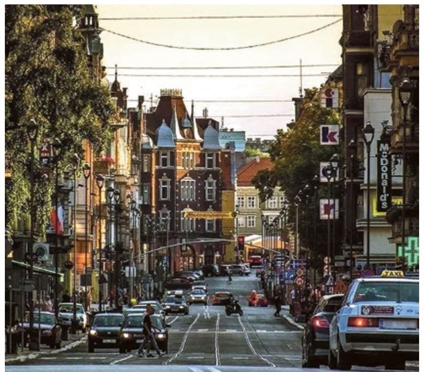
UL. ZWYCIĘSTWA. Słoneczne popołudnie na jednej z najpopularniejszych ulic w mieście.