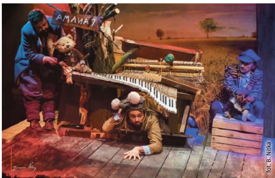
Teatr Miejski w tym sezonie wystawił sześć premier. Rozbudowany repertuar trafia do szerokiego odbiorcy. Na zdjęciu „Ach, jak cudowna jest Panama” – spektakl dla najmłodszych

Jesteśmy na półmetku 2017 roku. Za nami m.in. Noc Muzeów, sześć premierowych spektakli w Teatrze Miejskim, śląski finał INDUSTRIADY na terenie Nowych Gliwic z niesamowitym podniebnym show czy koncert gwiazd na pl. Krakowskim. Co przed nami? Obok prezentujemy listę najciekawszych nadchodzących wydarzeń. Już teraz zarezerwujcie sobie czas! (mm/mf)