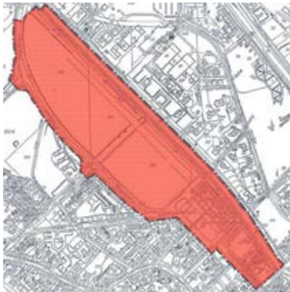
Załącznik graficzny nr 1 do ogłoszenia... (rejon pomiędzy ul. Orlickiego i ul. Wybrzeże Wojska Polskiego)