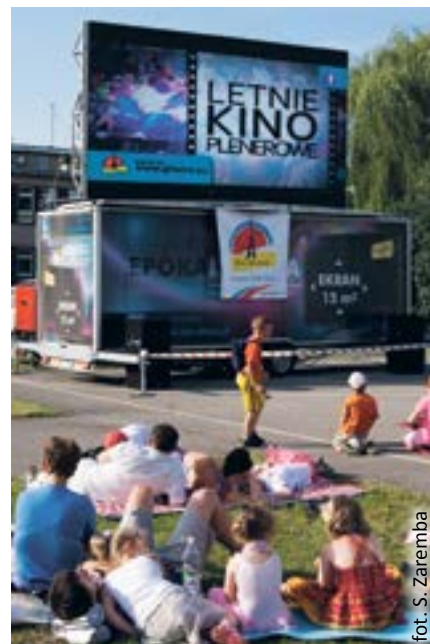
fol. S. Zaremba