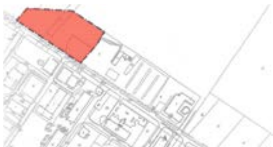
Załącznik graficzny nr 3 do ogłoszenia... (rejon ul. Sowińskiego)