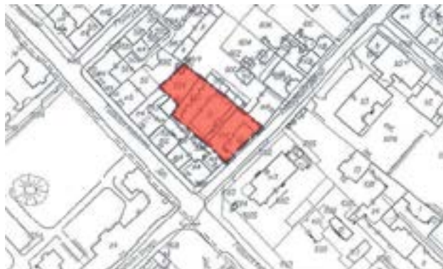
Załącznik graficzny nr 6 do ogłoszenia... (rejon ul. Kościuszki i ul. Zygmunta Starego)

Organem właściwym do rozpatrzenia uwag jest Prezydent Miasta Gliwice, a w przypadku uwag nieuwzględnionych przez Prezydenta Miasta dodatkowo Rada Miasta Gliwice.