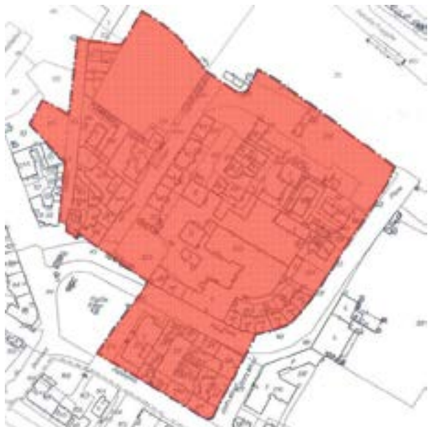
Załącznik graficzny nr 8 do ogłoszenia... (rejon Placu Piastów i ul. Piwnej)