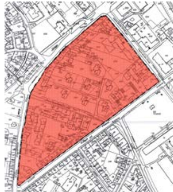
Załącznik graficzny nr 9 do ogłoszenia... (rejon pomiędzy ul. Wrocławską, ul. Dworcową i ul. Mikołowską)