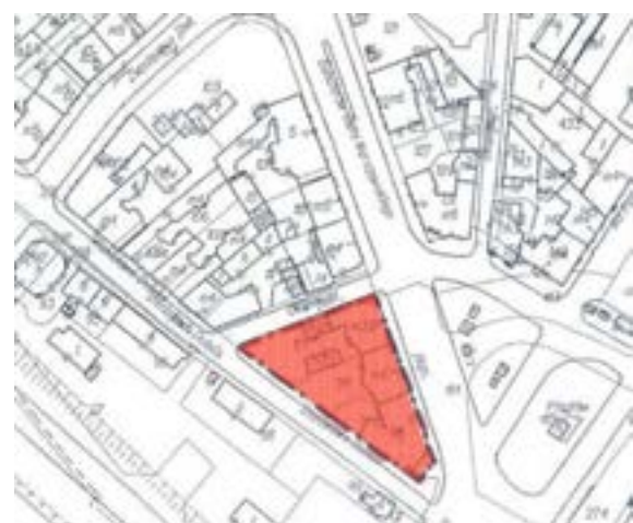
Załącznik graficzny nr 12 do ogłoszenia... (rejon ul. Bohaterów Getta Warszawskiego)

...o wyłożeniu do publicznego wglądu projektu zmiany miejscowego planu zagospodarowania przestrzennego dla terenu położonego w centralnej części miasta, obejmującego Centrum i Śródmieście, tzw. centralne tereny miasta