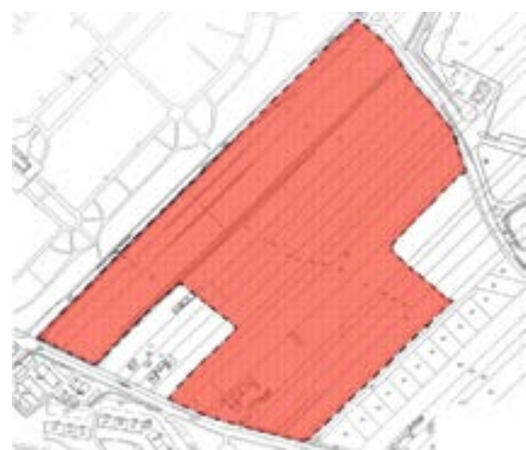
Załącznik graficzny nr 11 do ogłoszenia... (rejon na północ od ul. Kozielskiej)