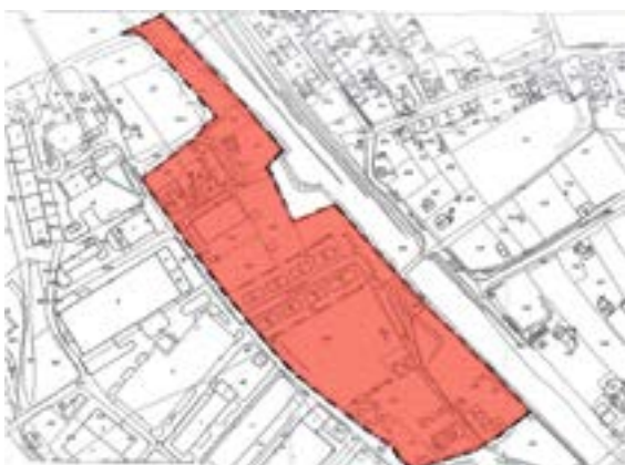
Załącznik graficzny nr 4 do ogłoszenia... (rejon ul. Przemysłowej i ul. Kasztanowej)