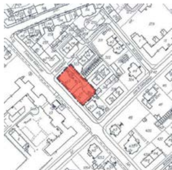
Załącznik graficzny nr 10 do ogłoszenia... (rejon ul. Kościuszki)