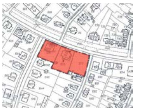
Załącznik graficzny nr 7 do ogłoszenia... (rejon ul. Mickiewicza)