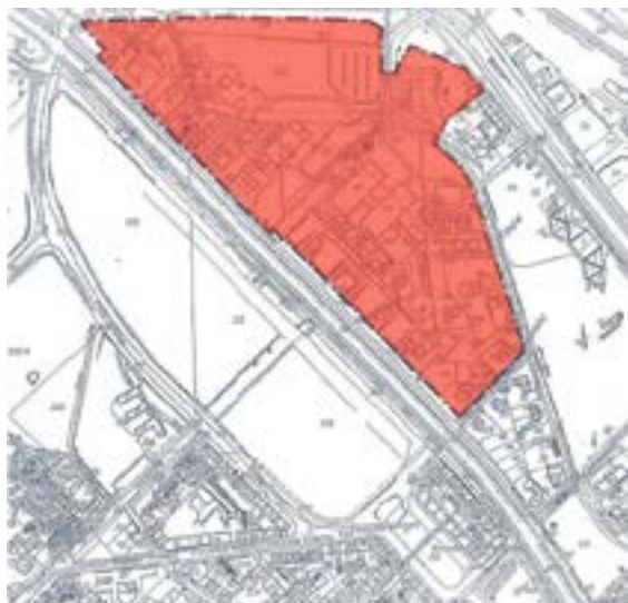
Załącznik graficzny nr 2 do ogłoszenia... (rejon pomiędzy ul. Wybrzeże Armii Krajowej i ul. Sienkiewicza)