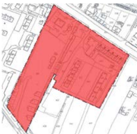
Załącznik graficzny nr 5 do ogłoszenia... (rejon pomiędzy ul. Bojkowską i ul. Pszczyńską)