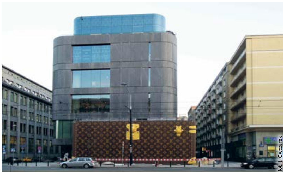
Warszawa, Al. Jerozolimskie – zaskakująca synergia architektury i mody

I tak neoklasycystyczne „ubranie” narożnego budynku przy zbiegu ulic Dolnych Wałów i Zwycięstwa nr 7 z początku XX wieku to zrównoważona kompozycja z oszczędnym detalem ograniczającym się m.in. do wieńców, wazonów, płaskorzeźb. W modzie w wieku XVII i XIX, kiedy to projektowano w tym stylu, przez krótką chwilę królowały stroje inspirowane sztuką starożytnej Grecji i Rzymu, dlatego noszono suknie na kształt togi. Następnie wyparł ją bardziej skomplikowany ubiór – sztywna spódnica, krynolina. W 1856 roku opatentowano metalową strukturę krynoliny w formie metalowej klatki złożonej z obręczy połączonych taśmami (czyż to nie brzmi jak opis konstrukcji budynku?).