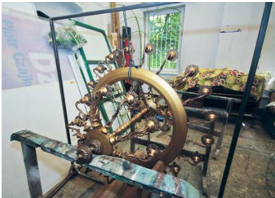
Odrestaurowane żyrandole powrócą na swoje miejsce po remoncie

z ich podstawami – odrestaurowane. – Przy okazji tych gruntownych prac zostanie podniesiony tzw. komin sceny, czyli powiększy się wysokość nadszcenia, a to zdecydowanie ułatwi nam zmianę dekoracji podczas spektakli. Poza tym częściowo zmieni się wystrój sali, w której siedzą widzowie. Zostanie ona też przystosowana do potrzeb osób niepełnosprawnych i aktualnych przepisów przeciwpożarowych – mówi szef GTM.