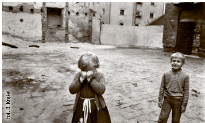
fol. B. Krężel