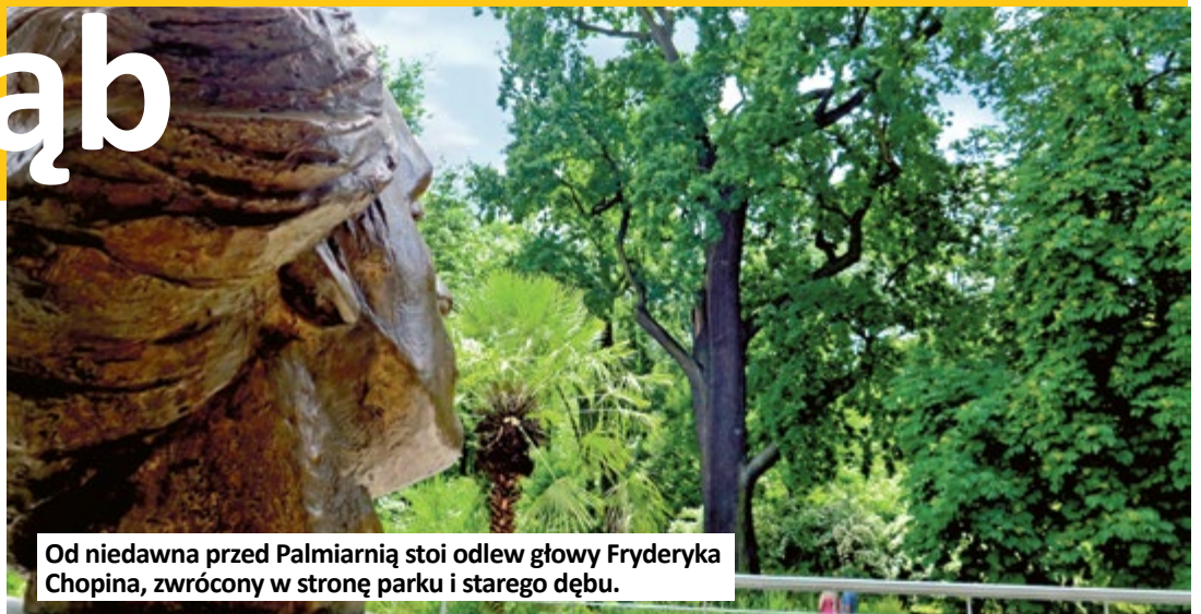
Od niedawna przed Palmiarnią stoi odlew głowy Fryderyka Chopina, zwrócony w stronę parku i starego dębu.

wy i kwiaty, teren obsiano trawą, później wybudowano Palmiarnię Miejską i domek ogrodnika, pojawiła się fontanna, jordanowski plac zabaw, alejkami przechadzali się ludzie, słychać był gwar bawiących się dzieci, czasem do Palmiarni przywożono nowe egzotyczne rośliny czy zwierzęta.