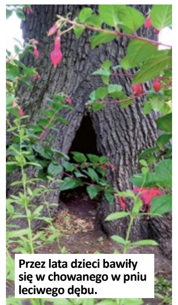
Przez lata dzieci bawiły się w chowanego w pniu leciwego dębu.