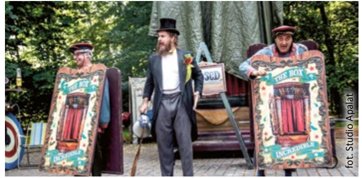
fol. Studio Apalat