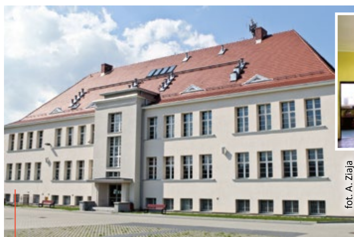
W ubiegłym roku odnowiona została m.in. Szkoła Podstawowa nr 11 w Ligocie Zaborskiej. Nowe sale powitały też uczniów SP nr 7 w Szobiszowicach

Część zadań inwestycyjnych i remontowych w gliwickich placówkach oświatowych (realizowanych obecnie bądź w nadchodzącym czasie) nadzoruje bezpośrednio Wydział Inwestycji i Remontów Urzędu Miejskiego. – Dotyczy to m.in. kończącej się już budowy areny