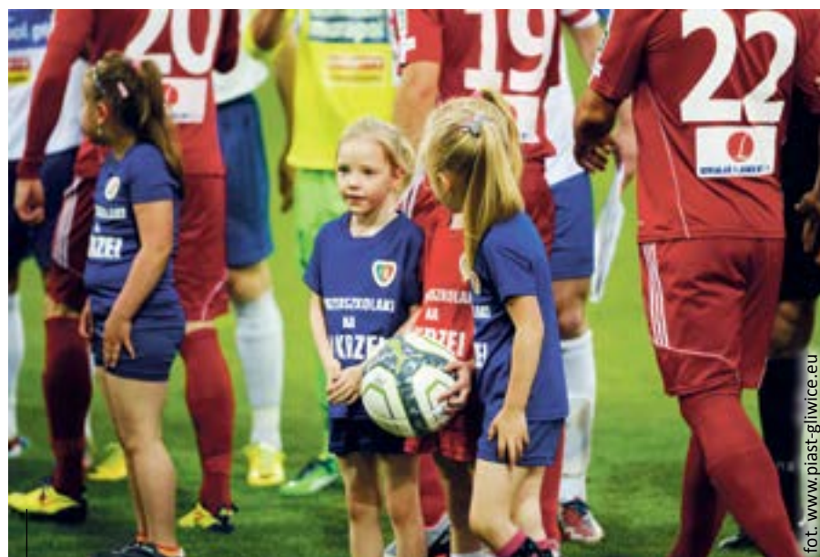
Zwycięzcy konkursu plastycznego wprowadzili piłkarzy na murawę podczas ostatniego meczu Piastunek z Podbeskidziem Bielsko-Biała