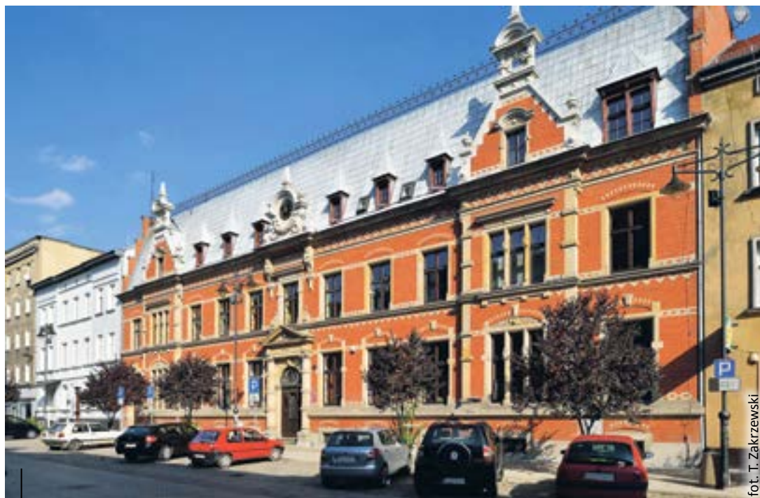
Plac Inwalidów Wojennych 12 – to siedziba Zakładu Gospodarki Mieszkaniowej

Otrzymanie mieszkania z zasobów komunalnych miasta umożliwia tzw. lista roczna opracowywana w oparciu o przepisy prawa miejscowego. To szansa dla tych, których sytuacja finansowa bądź życiowa nie pozwala na zakup własnego „m” lub wynajem konkurencyjny. Dotyczy to obecnie około 550 gliwickich rodzin. Pierwszeństwo w przyznaniu mieszkania mają dzieci