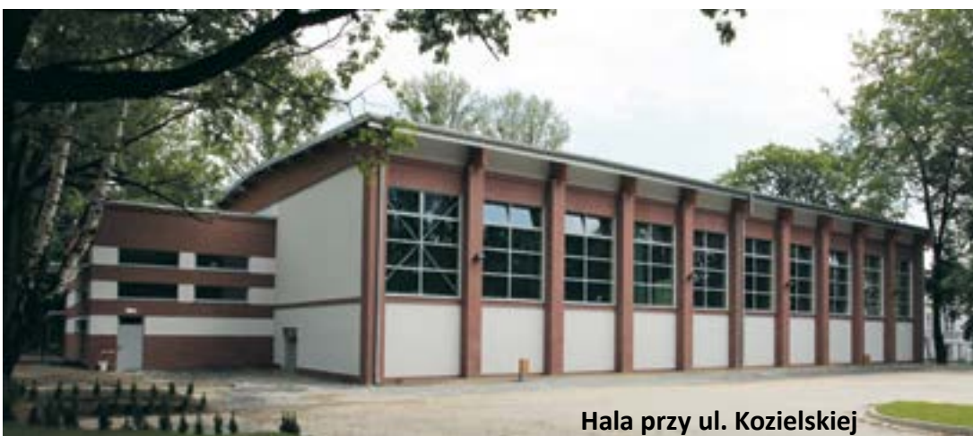
Hala przy ul. Kozielskiej

Umowa na dzierżawę zostanie zawarta na 3 lata. Licytacja rozpocznie się 16 lipca o godzinie 11.00 w siedzibie Urzędu Miejskiego w Gliwicach. Wywoławcza wysokość miesięcznego czynszu za dzierżawę nieruchomości wynosi 300 zł netto. Zainteresowane podmioty powinny do 12 lipca wpłacić na konto UM wadium w wysokości 6000 zł netto. Szczegółowe informacje na temat przetargu można znaleźć na stronie internetowej bip.gliwice.eu w dziale Ogłoszenia i komunikaty urzędowe / Sprzedaż nieruchomości i przetargi na wysokość czynszu.