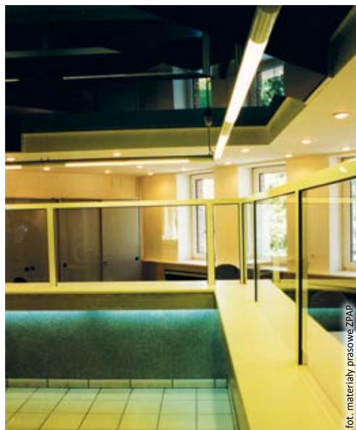
fol. materiały prasowe ZPAP