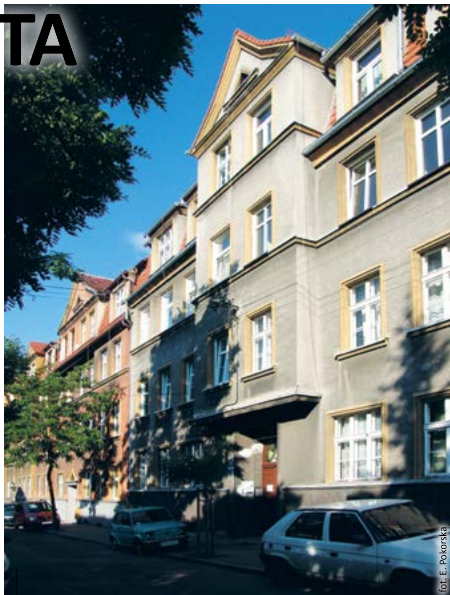
fol. E. Pokorska

Proponuję zatem inny podział kolorów – na architektoniczne, odzieżowe i cukiernicze. Pierwsze to barwy na-