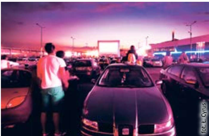
fol. L. Cyrus

12 czerwca w Letnim Kinie Samochodowym będzie można zobaczyć film „Gran Torino” wyreżyserowany przez Clinta Eastwooda i z nim w roli głównej. Początek projekcji – godz. 21.00. W kolejnych tygodniach wyświetlone zostaną takie obrazy, jak: „Och życie” (26 czerwca) i „Starcie tytanów” (3 lipca).