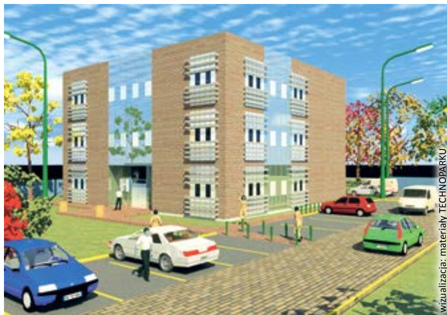
wizualizacja: materiały TECHNOPARKU

Podpisano już umowę ze spółką HB UNIBUD SA, która zajmie się budową obiektu. Prace ruszą lada dzień, a ich