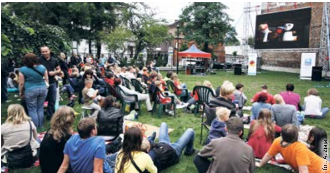
fol. A. Ziaja

Szczegółowy program LETNIEGO KINA PLENEROWEGO jest dostępny na stronie www.gliwice.eu . Organizatorem przedsięwzięcia jest gliwicki samorząd.