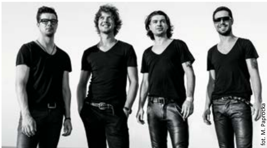
fol. M. Paprocka