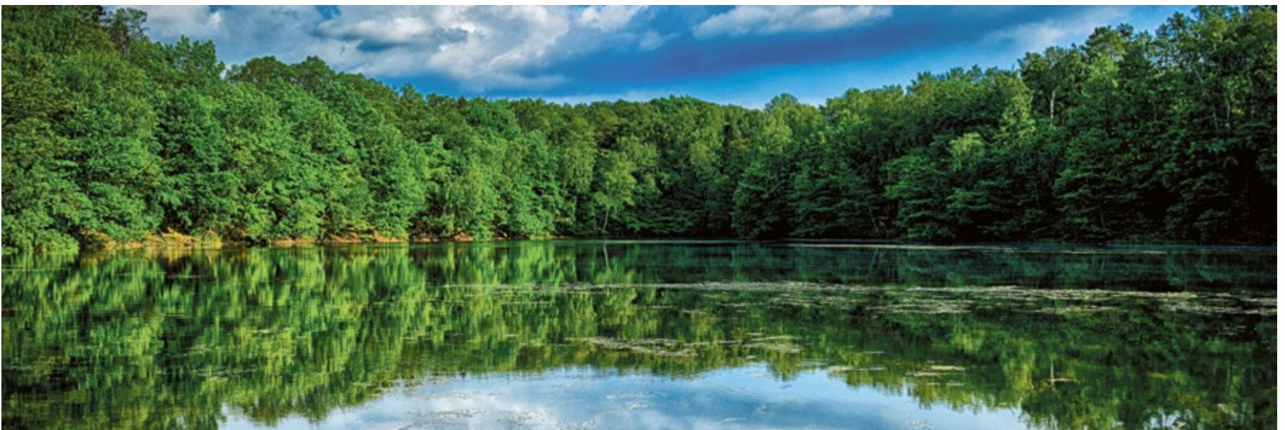
CZECHOWICE. Cóż tu komentować. Wystarczy popatrzeć. Pięknie!