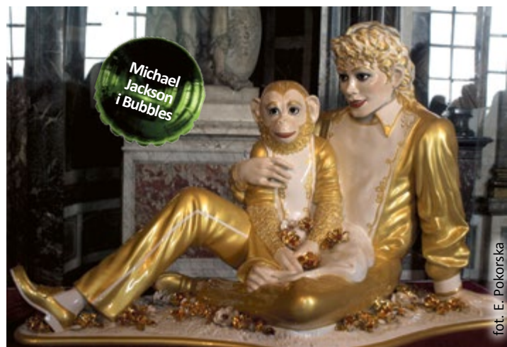
Michael Jackson i Bubbles