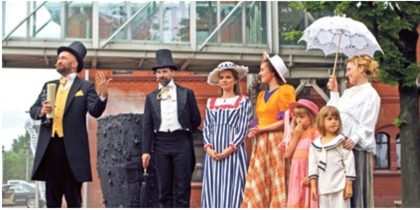
NOWE GLIWICE. Tegoroczna Industriada już za nami. Przenieśliśmy się w czasy dawnych przemysłowców. Z tłumu wyróżniały się stroje z minionej epoki.