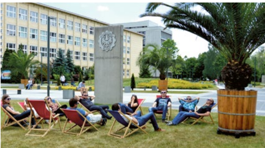
POLITECHNIKA. Studiowanie pod palmami? Takie rzeczy tylko w Gliwicach.