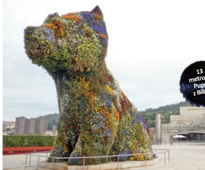
13 metrów Puppy z Bilbao