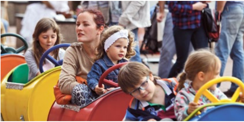
NOWE GLIWICE. Dla każdego, coś miłego. Wspólne zabawy i gry zręcznościowe dla najmłodszych...