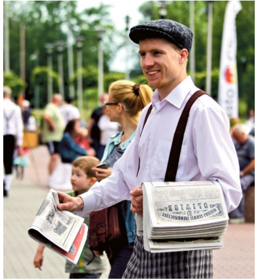
NOWE GLIWICE. Gazeta od prawdziwego gazeciarsza? Goście Industriady do rąk własnych otrzymali specjalne (ubiegłotygodniowe) wydanie „Miejskiego Serwisu Informacyjnego – GLIWICE” dedykowane tegorocznej edycji Święta Zabytków Techniki Województwa Śląskiego w naszym mieście.