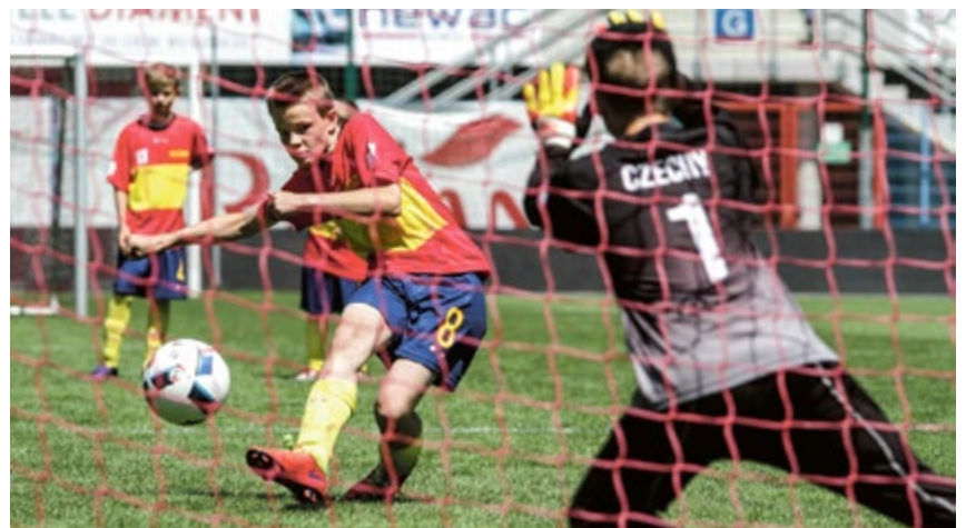
STADION MIEJSKI. Małe Euro 2016 w Gliwicach zakończone. Na zdjęciu mecz o trzecie miejsce: Hiszpania – Czechy. Kto został mistrzem? Czytajcie na str. 7.