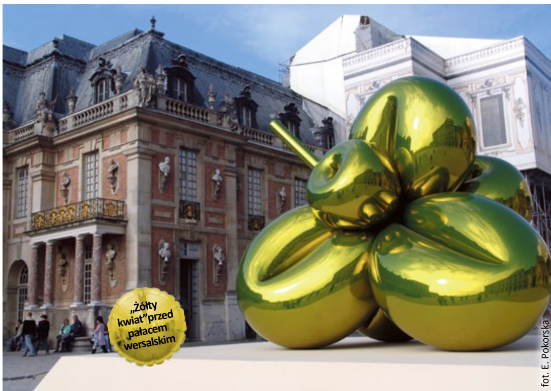
„Żółty kwiat” przed pałacem wersalskim