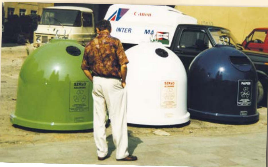
W Gliwicach pojawiły się nowe pojemniki na śmieci