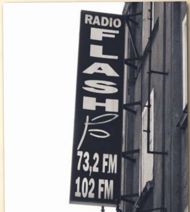
W grudniu rozpoczęła nadawanie pierwsza prywatna rozgłośnia radiowa - "FLASH"

Miasto nawiązało współpracę partnerską z niemieckim Dessau