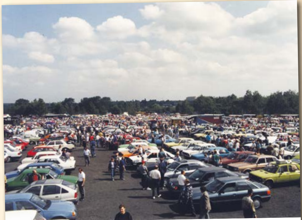
Na gliwickiej giełdzie samochodowej coraz częściej handlowano pojazdami zagranicznych marek

Miasto nawiązało współpracę partnerską z niemieckim Dessau