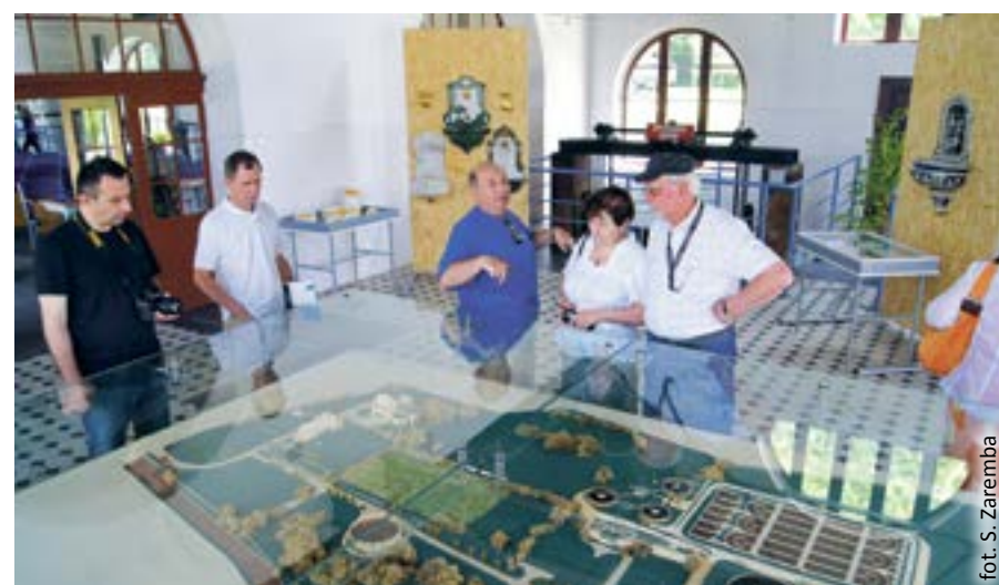
fol. S. Zaremba