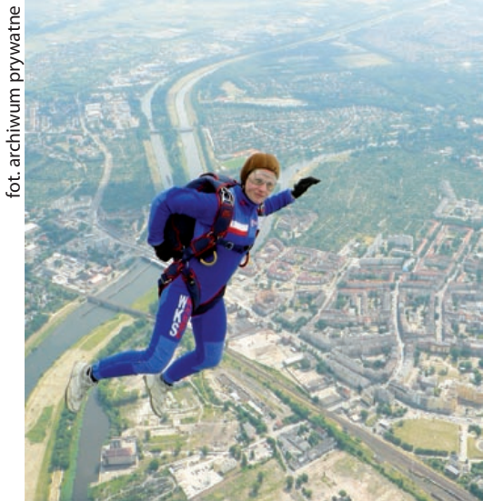
fol. archiwum prywatne