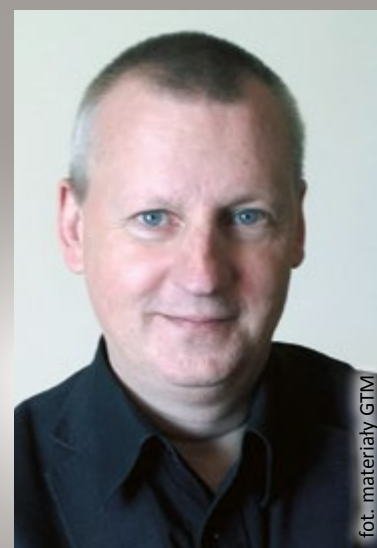
fol. materiały GTM

W latach 1996–2000 był współzałożycielem i dyrektorem Centrum Dramaturgii Polskiej, zajmował się organizacją sesji warsztatowych, był redaktorem naczelnym periodyków kulturalnych. Działa też jako projektant wystaw narracyjnych. Więcej informacji na www.teatr.gliwice.pl .