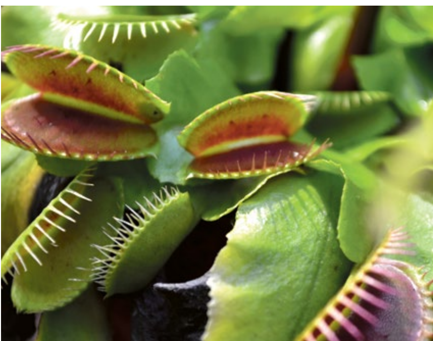
PALMIARNIA MIEJSKA. Ciągłe głodne? Rośliny, które lubią... mięso do 5 czerwca można oglądać w gliwickiej Palmiarni. Warto!