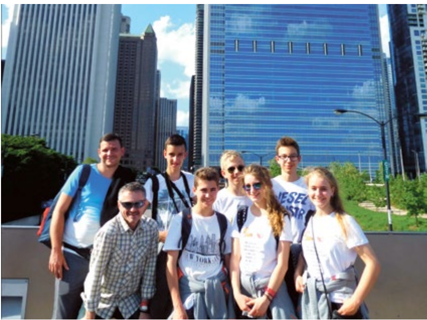
USA. Nasi za Oceanem. Drużyna gliwickich gimnazjalistów zajęła piąte miejsce w finałach światowych Odyssey Umysłów. Uczniowie Filomaty pozdrawiają ze Stanów Zjednoczonych!