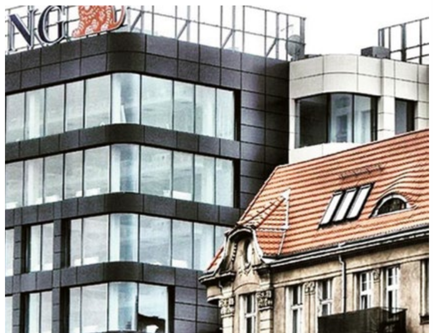
ŚRÓDMIEŚCIE. Kiedyś straszyl, dziś zachwyca. „Szkieletor” przy ul. Zwycięstwa już prawie gotowy. Robi wrażenie, prawda?