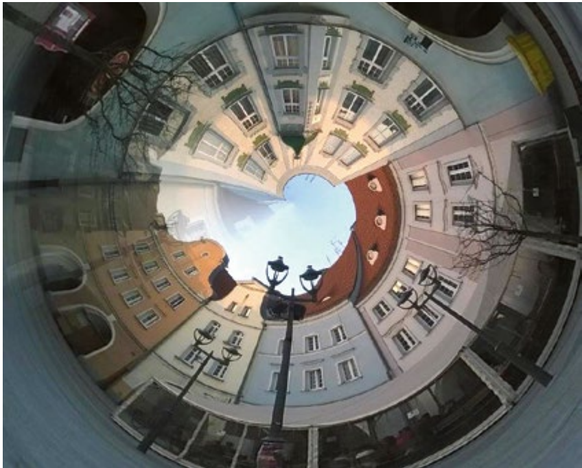
ŚRÓDMIEŚCIE. Zakręcony Rynek. Zdjęcie od naszej Czytelniczki. (fot. A. Sałatyńska)