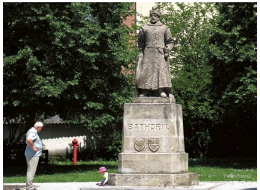
SALGÓTARJÁN. Znany widok? To oryginalny pomnik króla Stefana Batorego w węgierskim Salgótarján – mieście partnerskim Gliwic. Jego kopia stoi u nas – przy Zamku Piastowskim.