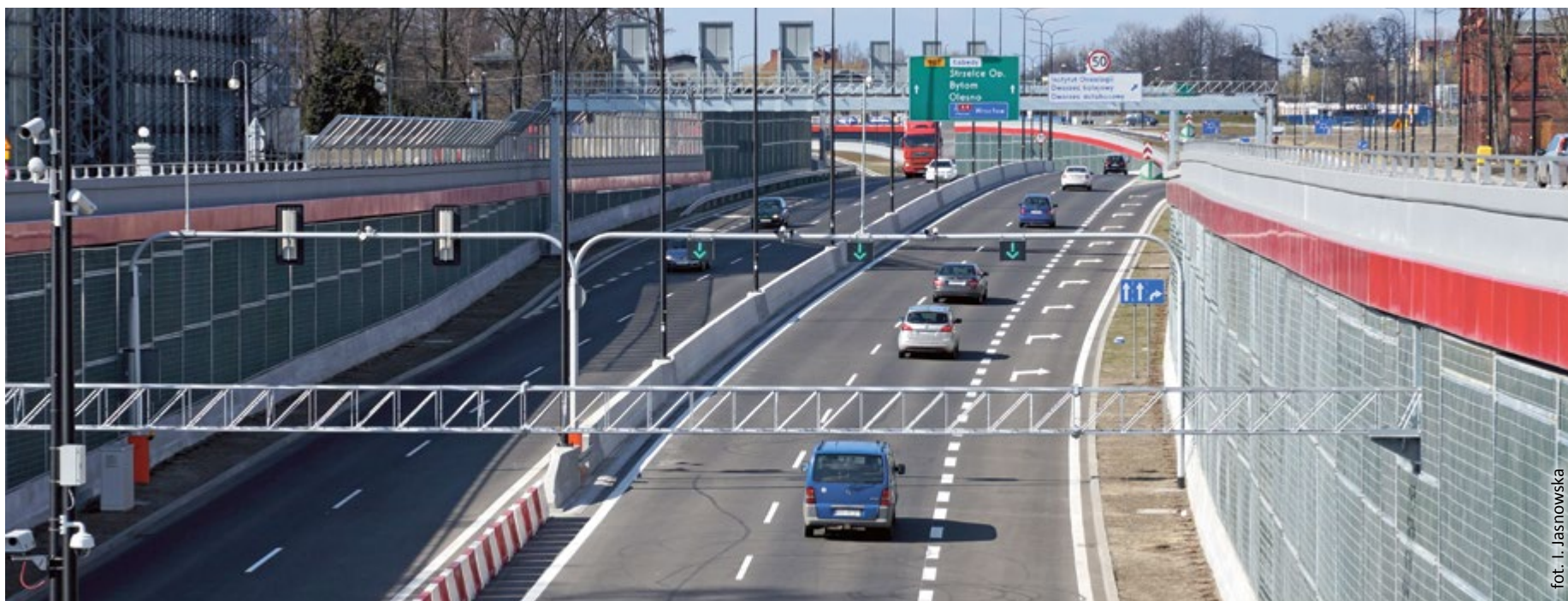
fol. I. Jasnowska

Minęły dwa miesiące od otwarcia gliwickiego odcinka Drogowej Trasy Średnicowej. Przyszedł czas na pierwsze podsumowania. Kierowcy chętnie korzystają z nowej drogi i omijają centrum, co znacząco zmniejszyło ruch na ulicach Gliwic. Każdego dnia tunelem DTŚ przejeżdża około 30 tys. samochodów. Zanim otwarto DTŚ, te auta przejeżdżały przez centrum miasta.