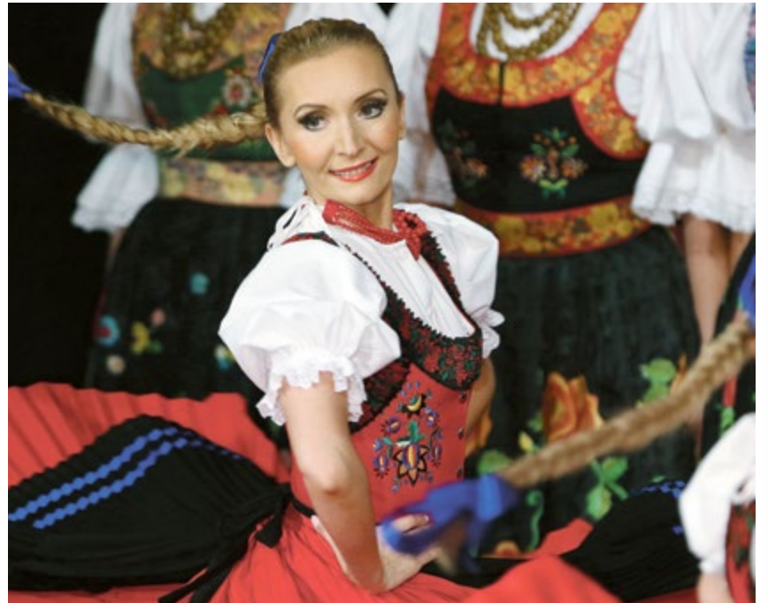
GTM. Na scenie Nowy Świat w Gliwicach wystąpił Zespół Pieśni i Tańca „Śląsk”.