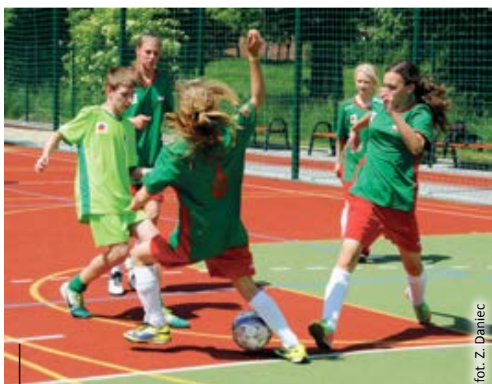
Mały Mundial 2014. Drużyny Nigerii (Gimnazjum nr 8) i Iranu (GTW Women Team) walczą o awans do dalszych rozgrywek