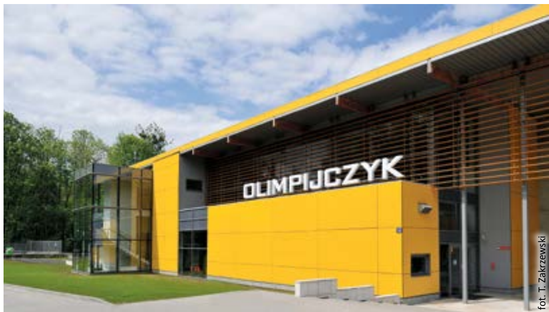
fol. T. Zakrzewski

Oglądając zabytkowe kamieniczki, Sukiennice, kościół