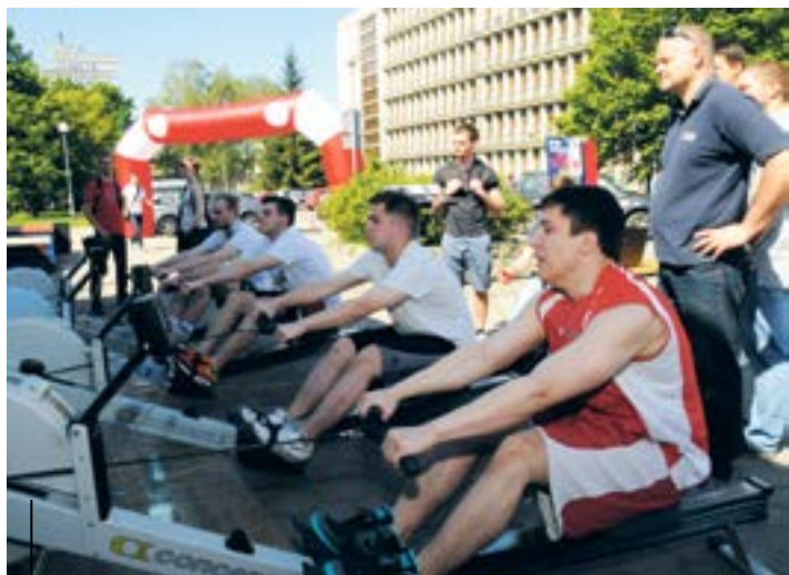
Podczas Europejskiego Tygodnia Sportu dla Wszystkich ćwiczyli mali i duzi. Studenci Politechniki Śląskiej wybrali m.in. ergometry wioślarskie i cross-fit