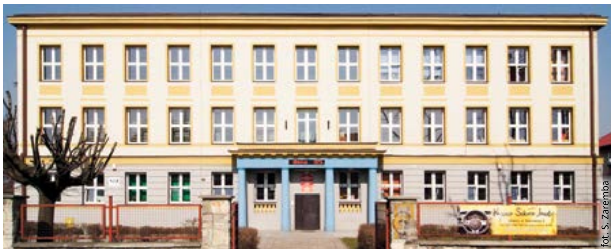
fol. S. Zaremba