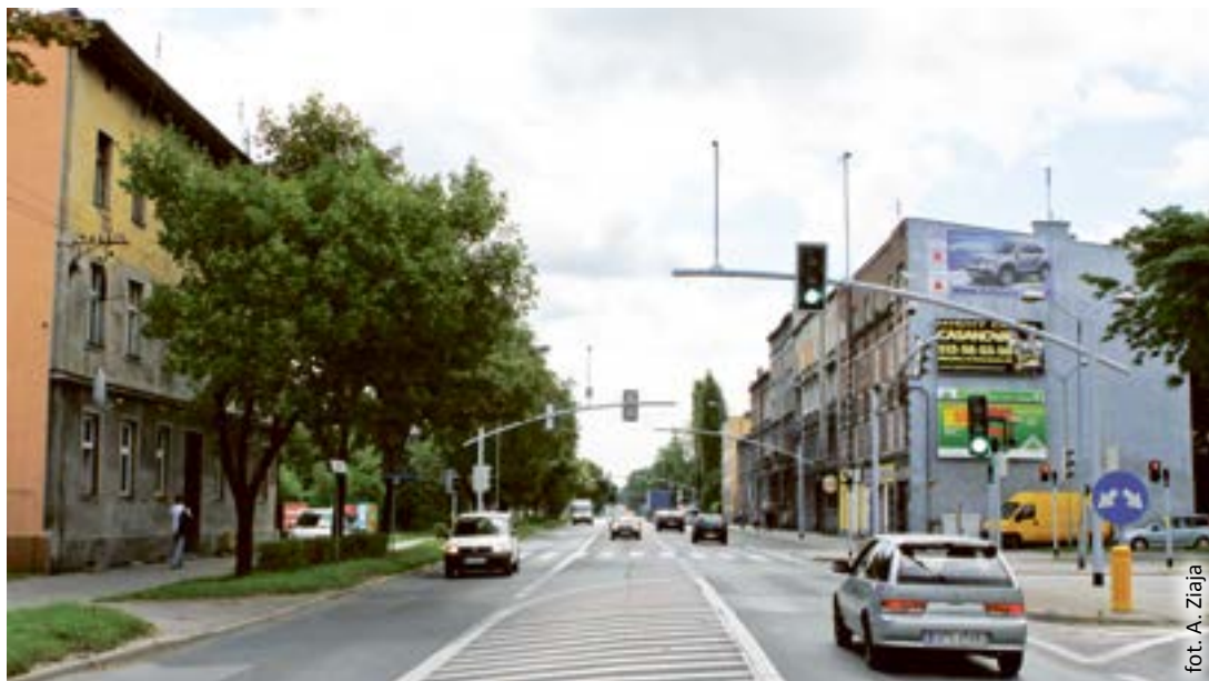
fol. A. Ziaja

Pierwszą część jego rozbudowy zakończono w czerwcu 2011 roku. Modernizacja objęła wówczas 15 skrzyżowań, głównie w ciągu ul. Pszczyńskiej i Rybnickiej. Na każdym wymieniono sterowniki, maszty i sygnalizatory świateł, zainstalowano detektory pojazdów i przycisków dla pie-