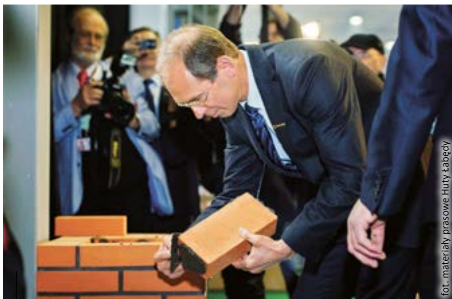
Prezydent Zygmunt Frankiewicz, Huta Łabędy, 16 maja