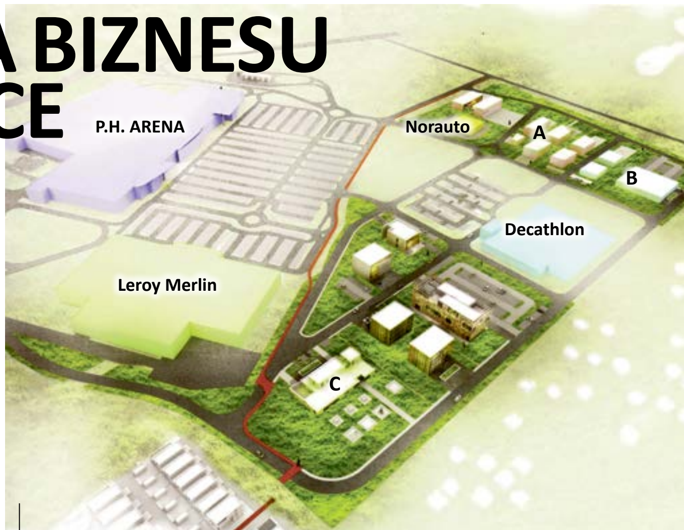
A – strefa nieuciążliwego przemysłu, B – strefa sportu i rekreacji, C – strefa biur i usług

Na potrzeby planowanej inwestycji Carrefour wraz z firmą KrakInwest i biurem projektów Rafał Drobczyk opracował wstępne warianty zabudowy z możliwością ich indywidualnego dopasowania. W przedstawionej przed tygodniem propozycji przewidziano m.in. możliwość wznoszenia przez inwestorów obiektów usług związanych ze