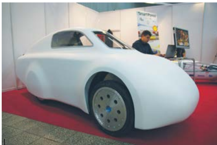
Debiut BYTEL'a w nowej wersji, choć jeszcze surowej na Międzynarodowych Targach Hydrauliki, Pneumatyki, Sterowania i Napędów HaPeS 2014 w Katowicach