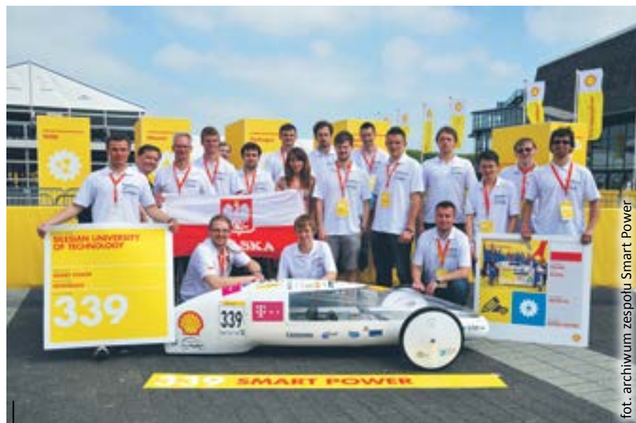
Zespół Smart Power tworzą studenci wydziału Mechanicznego Technologicznego Politechniki Śląskiej