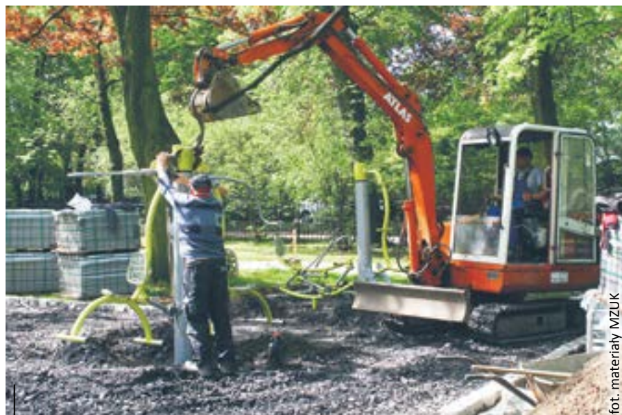
fol. materiały MZUK

Na jakie zadania będzie można głosować tym razem? Tego dowiemy się 1 czerwca – lista zostanie opublikowana w pierwszej kolejności na stronie internetowej www.gliwice.eu . Ukaże się także w „Miejskim Serwisie Informacyjnym – Gliwice”. Głosowanie zostanie przeprowadzone się w dniach od 8 do 22 czerwca. W tym roku będzie można oddać głos nie tylko przez internet, ale także na specjalnych papierowych formularzach – w wyznaczonych miejscach w różnych częściach miasta. Wyniki konsultacji społecznych poznamy do 20 lipca.