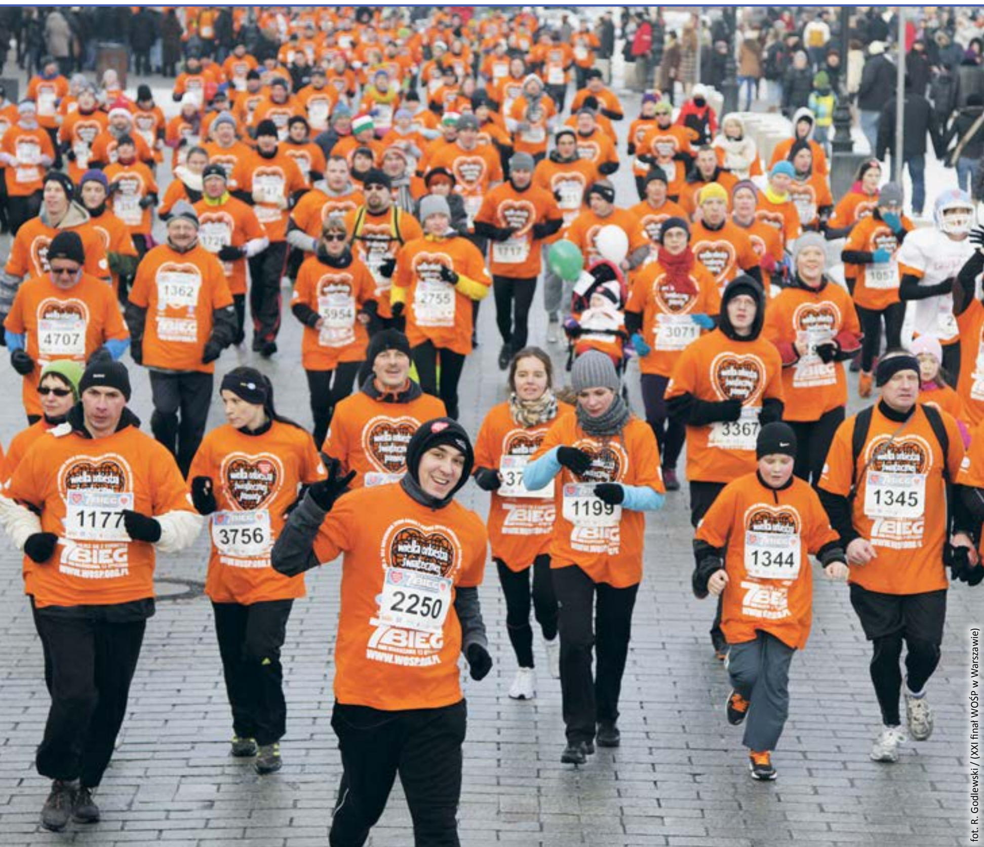
XXI finał WOSP w Warszawie