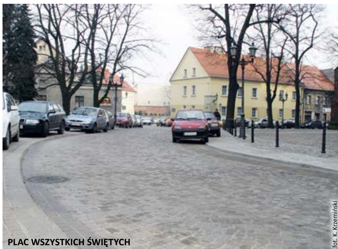
PLAC WSZYSTKICH ŚWIĘTYCH