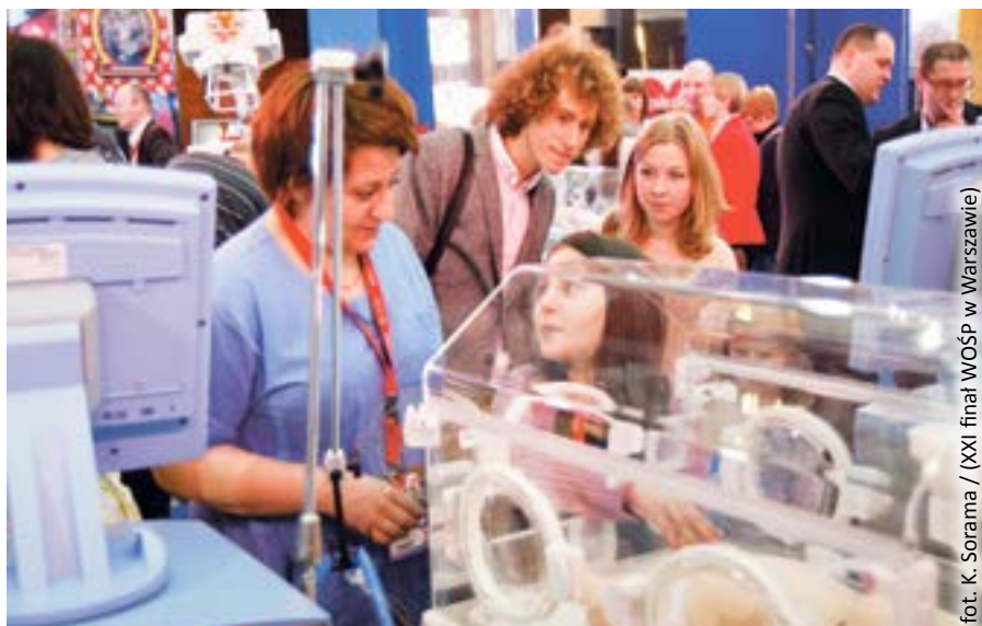
XXI finał WOŚP w Warszawie