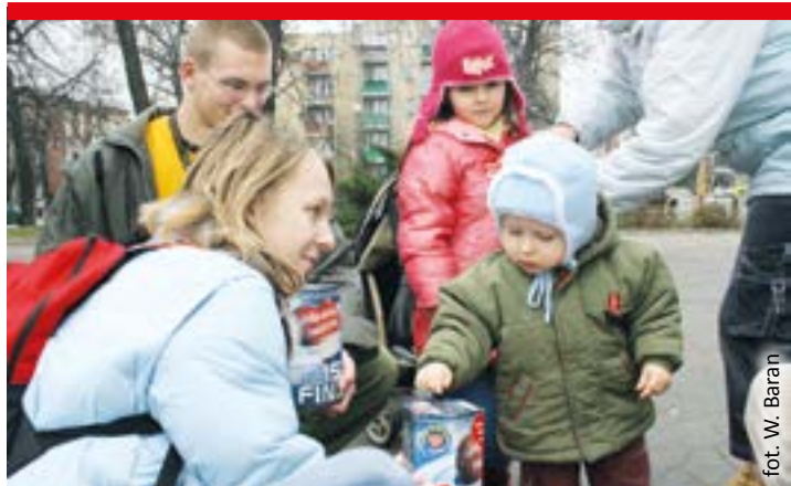
fol. W. Baran