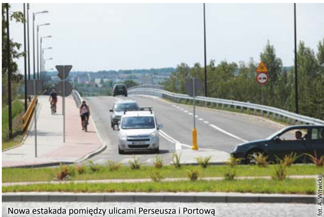
Nowa estakada pomiędzy ulicami Perseusza i Portową