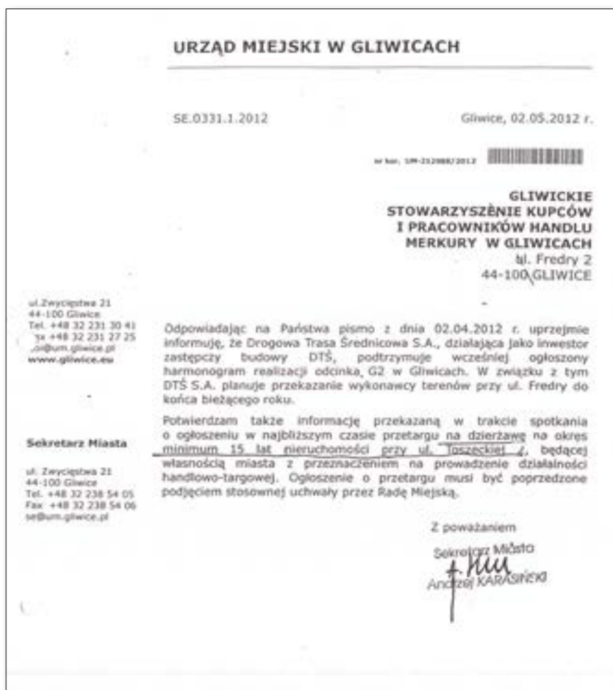
Powyżej skan pisma Urzędu Miejskiego do stowarzyszenia kupców z maja 2012 r.