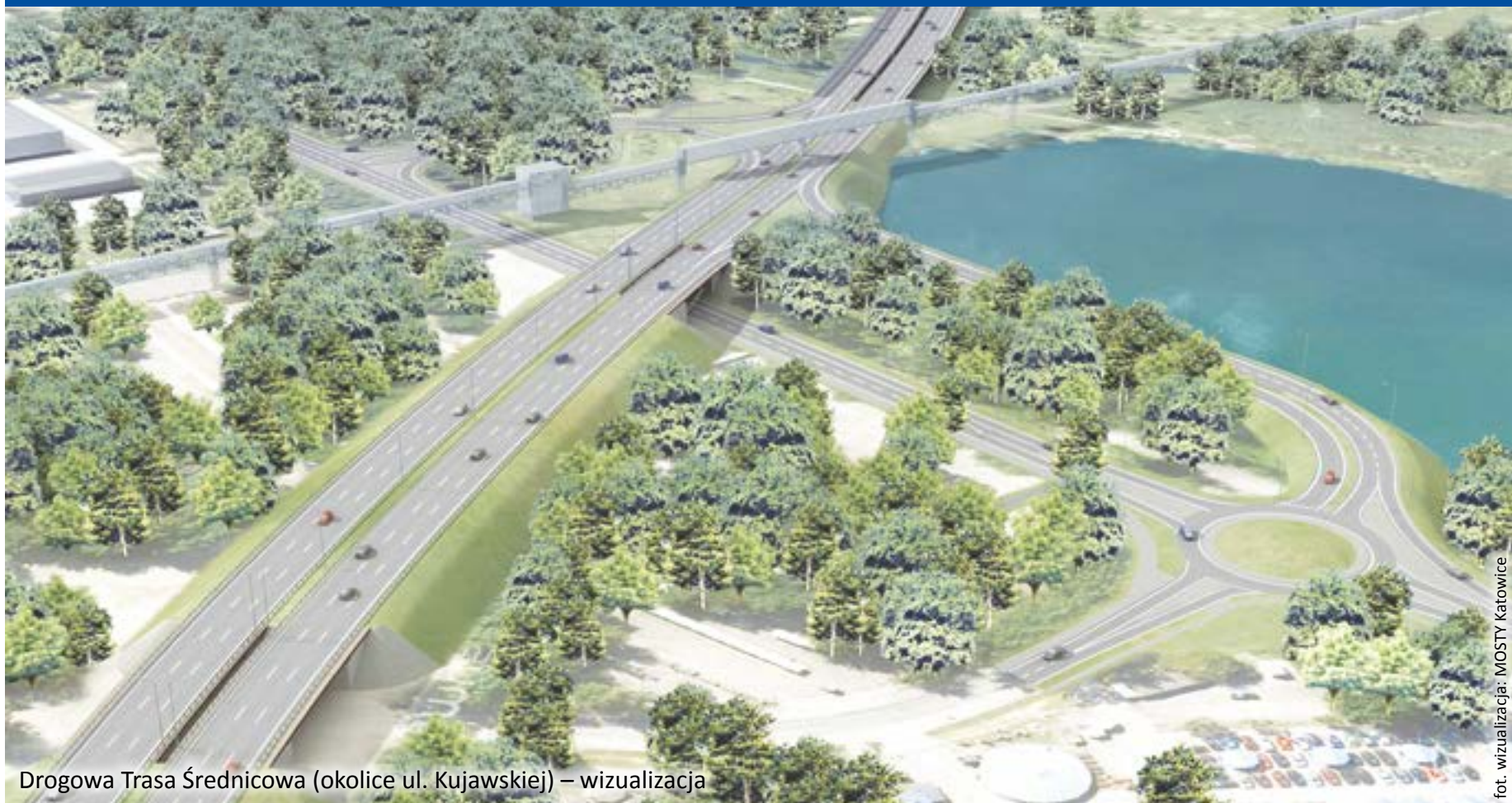
Drogowa Trasa Średnicowa (okolice ul. Kujawskiej) – wizualizacja