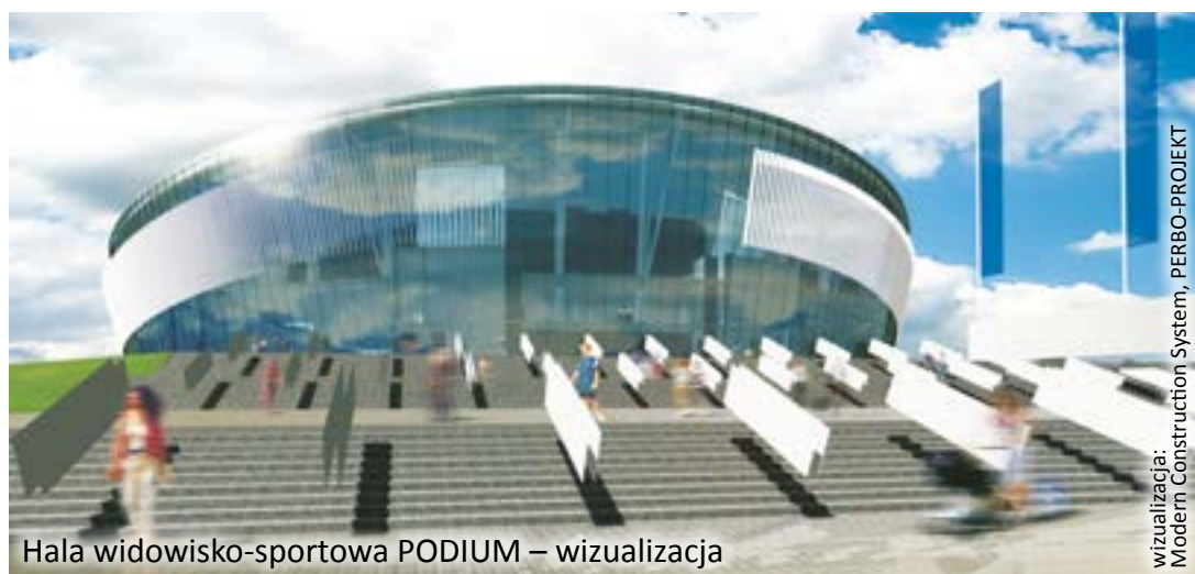
Hala widowisko-sportowa PODIUM – wizualizacja

wizualizacja: Modern Construction System, PERBO-PROJEKT