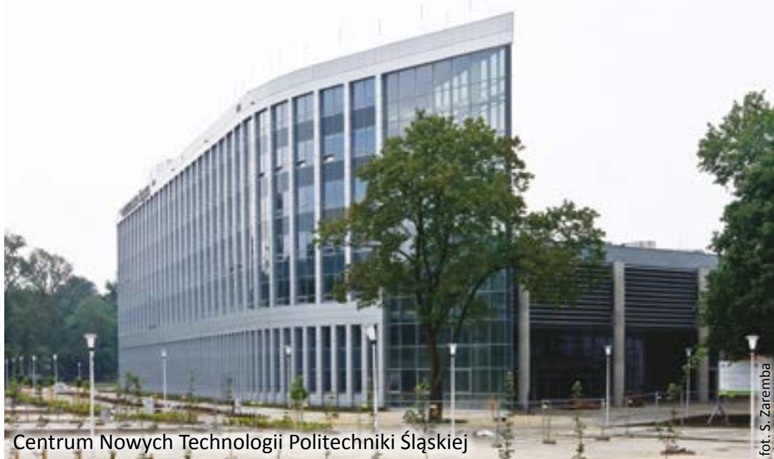
Centrum Nowych Technologii Politechniki Śląskiej