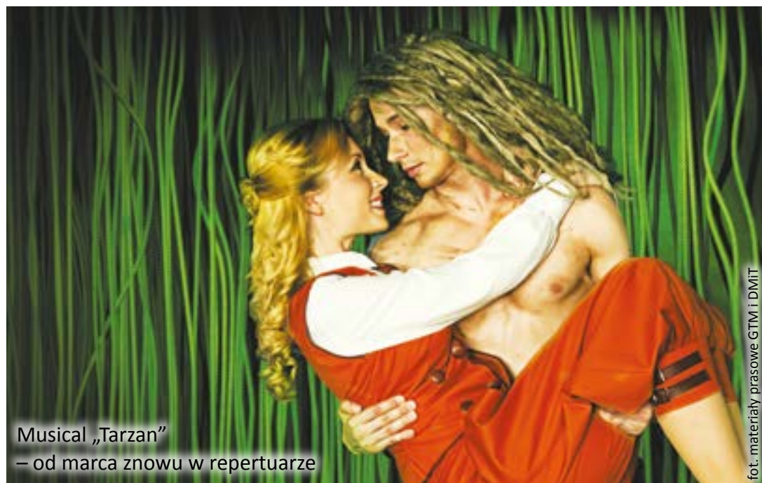
Musical „Tarzan” – od marca znowu w repertuarze

Było zabawnie, momentami wzruszająco i na pewno efektownie. Polska wersja musicalu „Tarzan”, przygotowanego wspólnie przez Gliwicki Teatr Muzyczny oraz zabrzański Dom Muzyki i Tańca spodobała się premierowej publiczności, która nagrodziła aktorów i realizatorów spektaklu owacją na stojąco.