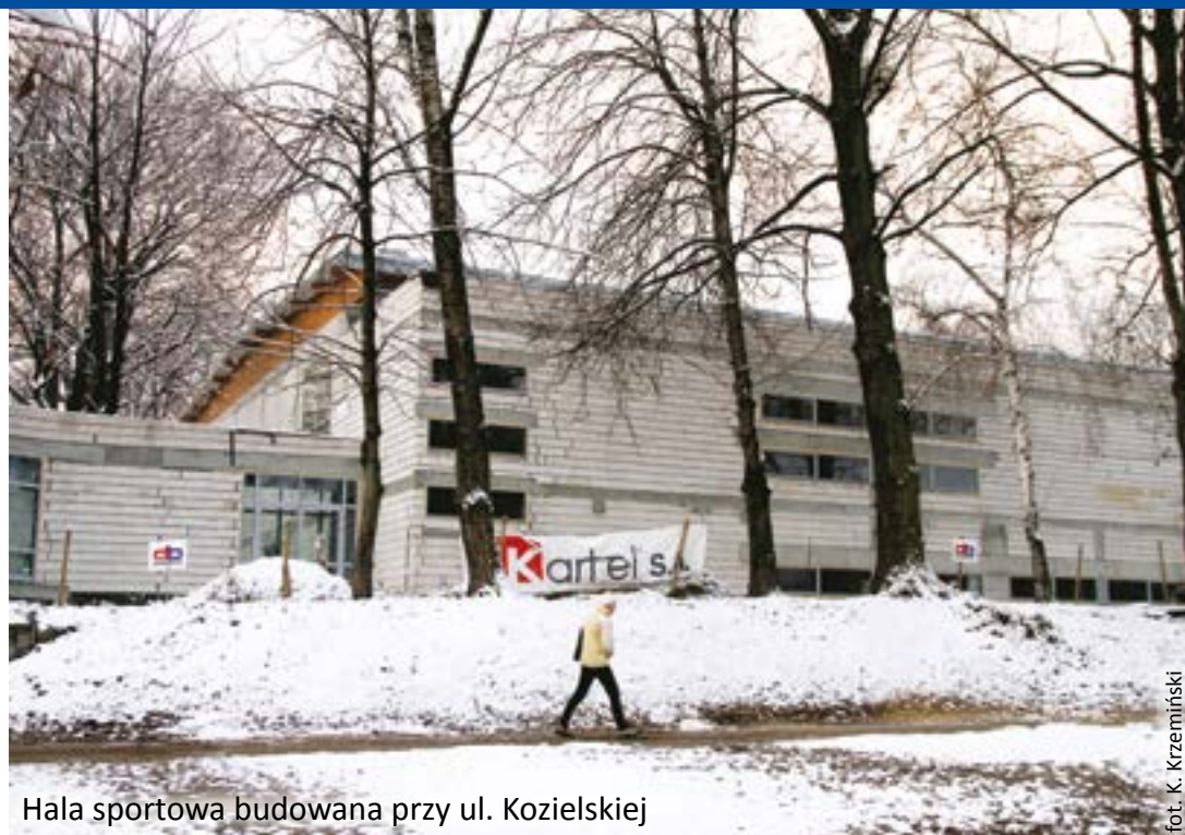
Hala sportowa budowana przy ul. Kozielskiej

Czy budować obiekt bez gwarancji na pieniądze unijne? – to trudna decyzja, przed którą stanęły miejskie władze. W tej sytuacji prezydent Gliwic zorganizował konsultacje społeczne i poprosił o opinię gliwiczian. Swoje stanowisko w tej sprawie przedstawiło ponad 9 tysięcy osób, z tego ponad 61% poparło realizację inwestycji.