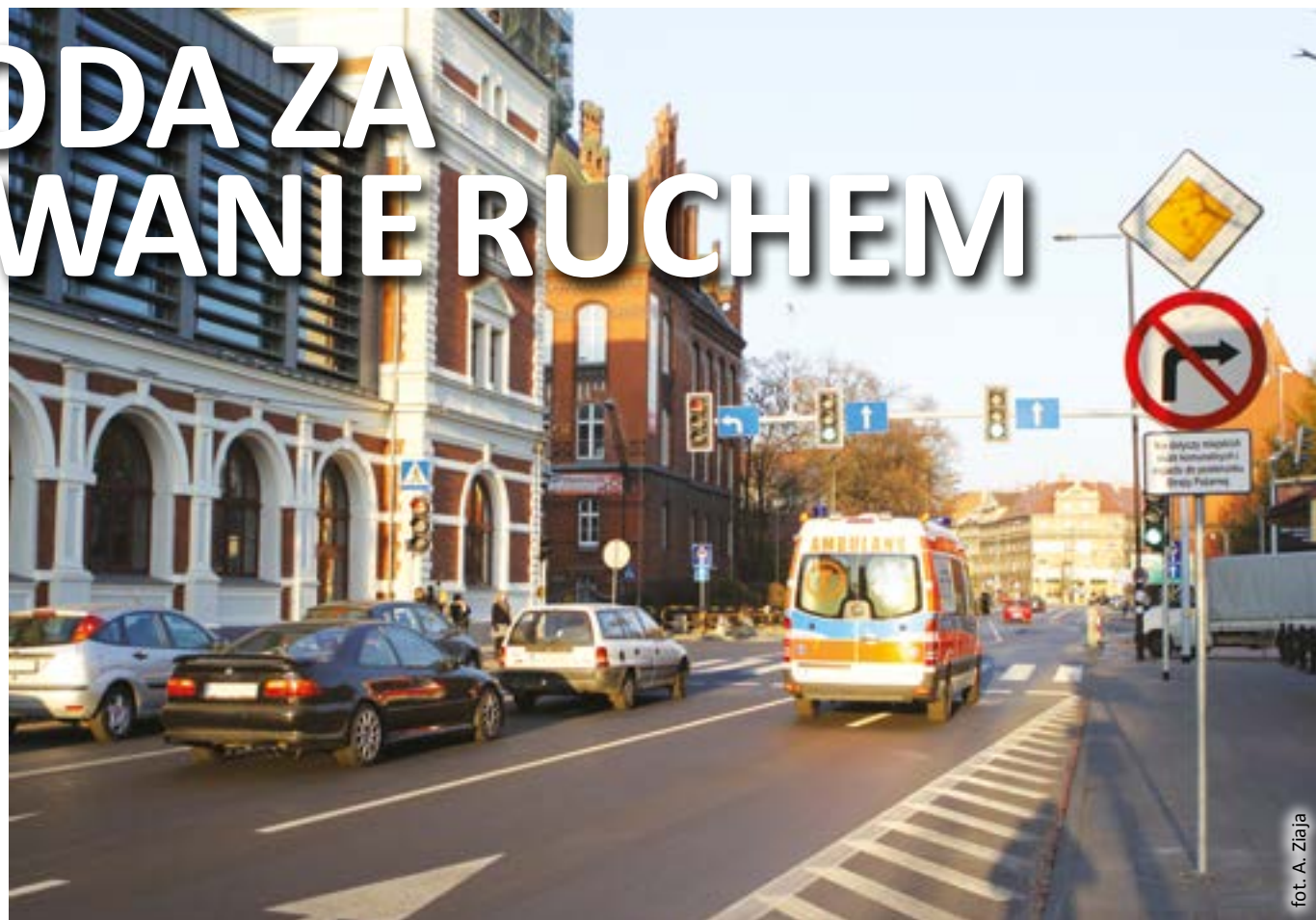
fol. A. Ziaja

Dodatkowo gliwickie przedsięwzięcie wyróżniono Nagrodą Specjalną Przedstawicielstwa Komisji Europejskiej w Polsce za „innowacyjny projekt transportowy promujący współpracę i założenia polityki transportowej oraz strategię wzrostu Europa 2020”. – Przyznano ją za stworzenie możliwości zatrudnienia jako mobilnych analityków ruchu opiekunów osób niepełnosprawnych, wykluczonych zawodowo z powodu sprawowania w domu całodobowej opieki. Ich praca będzie miała na celu szybkie wykrycie kolizji, wypadku, zatoru drogowego i innych zdarzeń, które mogą wpływać na płynność ruchu, i powiadomienie dyżurnego w Centrum Sterowania Ruchem oraz – jeżeli zajdzie taka potrzeba – wezwanie służb ratunkowych. W Centrum znajdują pracę także osoby niepełnosprawne ruchowo, gdyż sam obiekt dostosowano do potrzeb osób poruszających się na wózkach inwalidzkich – mówi Jadwiga Jagiełło-Stiborska, rzecznik prasowy ZDM.