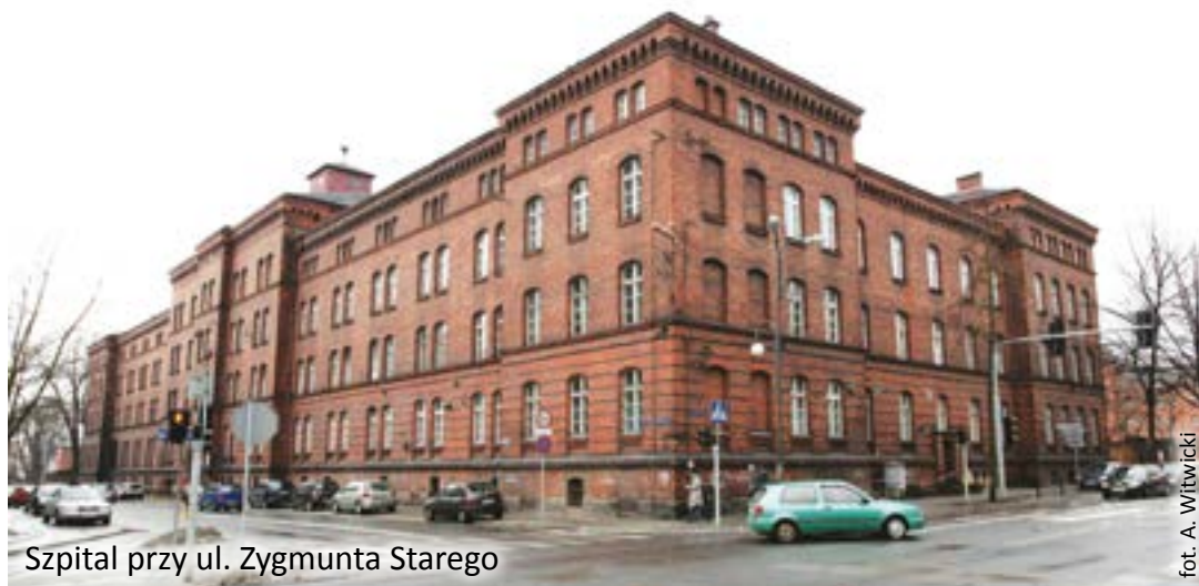
Szpital przy ul. Zygmunta Starego

Działania ekologiczne, służące ochronie środowiska naturalnego i zdrowiu mieszkańców, kontynuowało Przedsiębiorstwo Wodociągów i Kanalizacji. Woda, która płynie z gliwickich kranów, jest dobrej jakości, a będzie jeszcze lepsza – zapewnili reprezentanci tej miejskiej spółki, rozpoczynając rozbudowę i unowocześnienie Stacji Uzdatniania Wody.