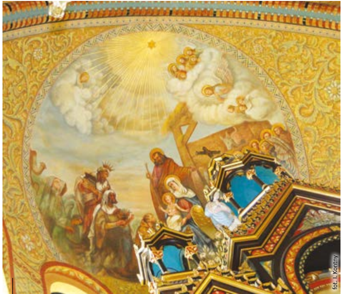
Polichromia w kościele pw. Trójcy Przenajświętszej w Rudzie Śląskiej – Kochłowicach

Z czasem w przekazach różnicowano im również kolor skóry i wiek. Trzy rasy miały symbolizować hołd całego świata złożony narodzonemu Jezusowi. Różnica w wieku mędrców znaczyła zaś kolejne etapy w życiu człowieka. Melchior to starzec ze złotem – dar dla króla. Kruszcem ten to symbol władzy Jezusa nad światem. Baltazar w sile wieku przynosi mirrę – dar dla człowieka, którym też był Chrystus. Mirra, pachnidło, była wykorzystywana przy namaszczaniu zmarłych, a więc kojarzy się też z męką Jezusa. Najmłodszy, Kacper ofiaruje dar dla Boga – kadzidło.