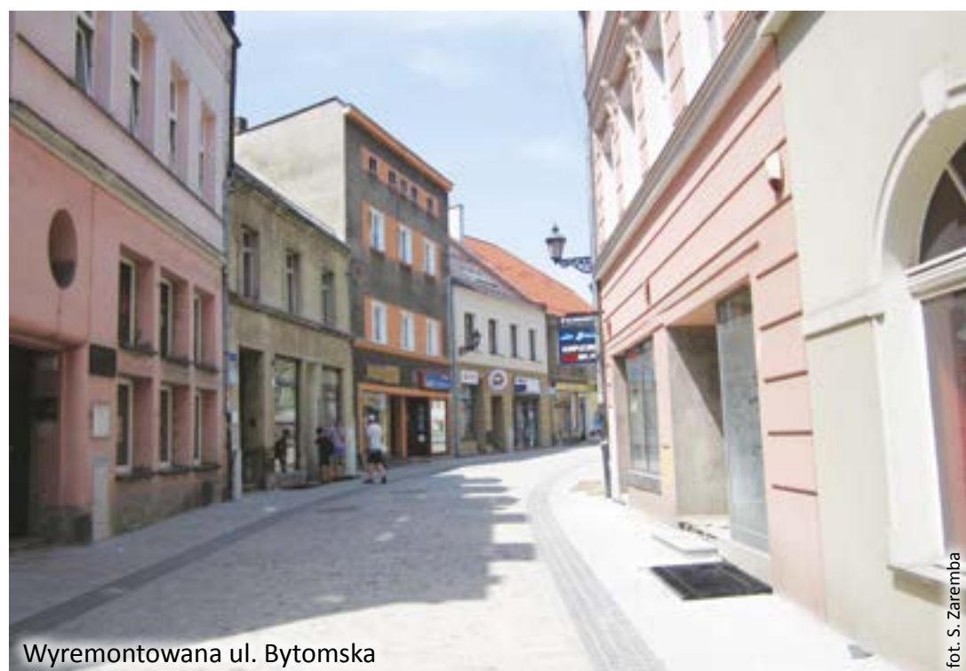
Wyremontowana ul. Bytomska