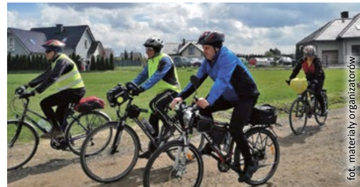
fol. materiały organizatorów

– Rajd ma na celu popularyzację turystyki kolarskiej i dziedzictwa przyrodniczego lasów Nadleśnictwa Rudziniec wśród mieszkańców Gliwic i powiatu gliwickiego oraz zwrócenie uwagi na problem ginących kasztanowców, które są atakowane przez szrotówka kasztanowcowiaczka – pasożyta tych drzew – tłumaczy organizatorzy imprezy.