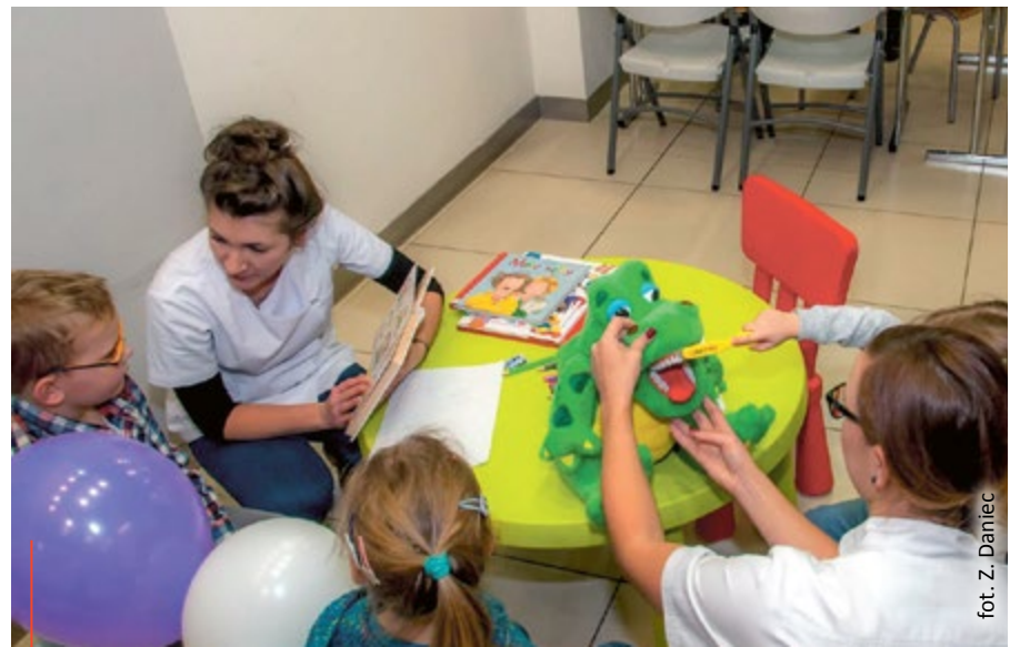
Gliwicki samorząd cyklicznie organizuje akcje i spotkania poświęcone tematyce zdrowotnej. 12 maja w CH FORUM wystartuje kolejna odsłona Gliwickiej Akademii Zdrowia Dzieci

Tego samego dnia o godz. 18.00 w Gimnazjum nr 4 przy ul. Asnyka 36 rozpocznie się otwarte spotkanie poświęcone chorobom zwyrodnieniowym mózgu, a w szczególności chorobom Alzheimera i Parkinsona . Organizuje je gliwicki samorząd. Prelekcję wygło-