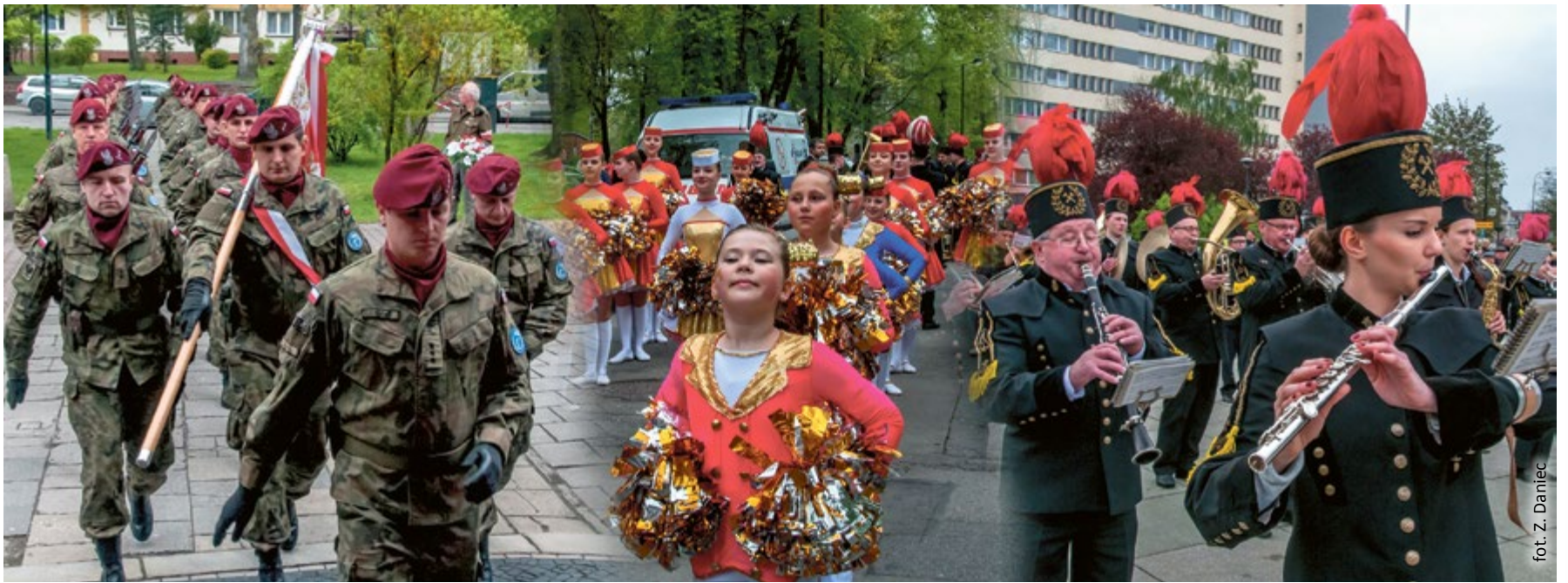
Wojskowy ceremonial, podniesiona flaga państwowa, defilada i występy orkiestr dętych – gliwickie Święto Narodowe Trzeciego Maja było nie tylko uroczyste, ale też bardzo widowiskowe.