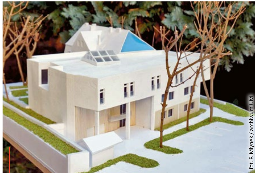
Makieta zmodernizowanego Hospicjum Miłosierdzia Bożego w Gliwicach. Projekt: Pracownia Architektoniczna Jerzy Witczek

Koszt inwestycji oszacowano na około 4,5 mln zł. Według wstępnego planu całość ma być gotowa pod koniec 2018 r. (mf)