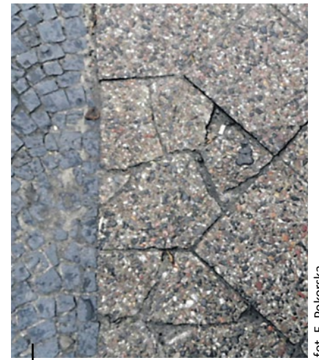
fol. E. Pokorska

Ul. Sobieskiego – tam oryginalny układ płytek chodnika zostanie zachowany, a drobne bazaltowe kostki zostaną zastąpione granitowymi, większymi