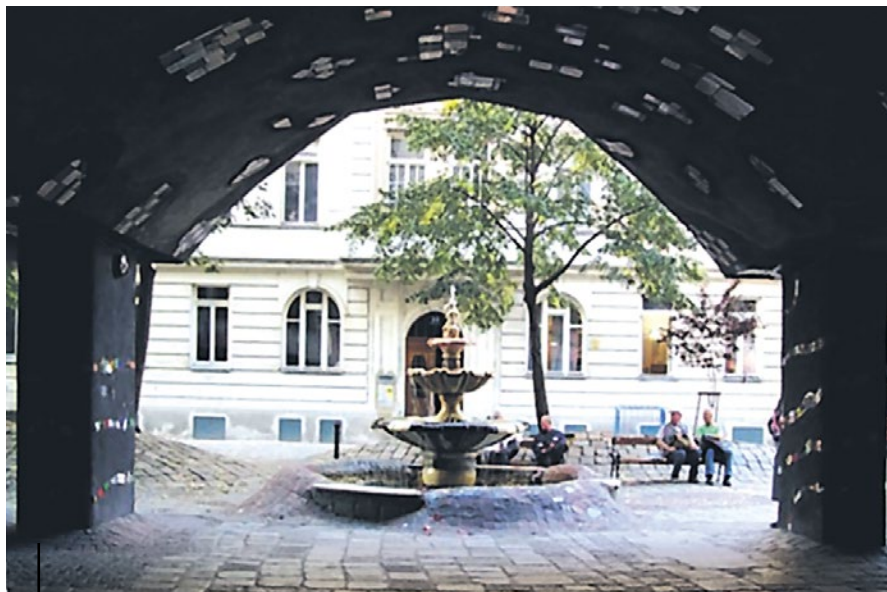
Wiedeń, budynek Hundertwassera

zmiana obejmowała całkowitą wymianę płyt na kompozycje z kamiennych kostek o różnych wymiarach. To rozwiązanie nawiązywało w dość dowolny sposób do materiału z XIX wieku. Obowiązujący wtedy zakaz hodowli trzody chlewnej na krakowskim Rynku (o średniowiecznej proveniencji) świadczy dobitnie, że nawet 150 lat temu występowały problemy z nawierzchnią głównego miejskiego placu. Zakaz miał zatrzymać podnoszenie się jego poziomu.