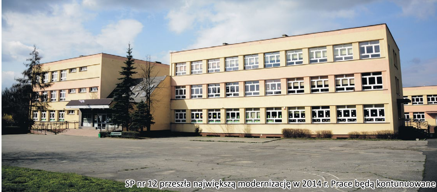
SP nr 12 przeszła największą modernizację w 2014 r. Prace będą kontynuowane

Gliwice systematycznie realizują inwestycje w zakresie ocieplania budynków oświatowych. Począwszy od 2004 roku, zmodernizowano ich już 63. Ogólna wartość tych przedsięwzięć zamknęła się w kwocie 84,9 mln zł. 62 z tych inwestycji zostało dofinansowanych przez Wojewódzki Fundusz Ochrony Środowiska i Gospodarki Wodnej. Wysokość wsparcia w postaci pożyczek i dotacji wyniosła 30,6 mln zł, a umorzeń wcześniej zaciągniętych pożyczek z Funduszu – ponad 6,3 mln zł. Dodatkowo do termomodernizacji jednej z placówek uzyskano dofinansowanie z Regionalnego Programu Operacyjnego Województwa Śląskiego w wysokości ponad 1,8 mln zł.