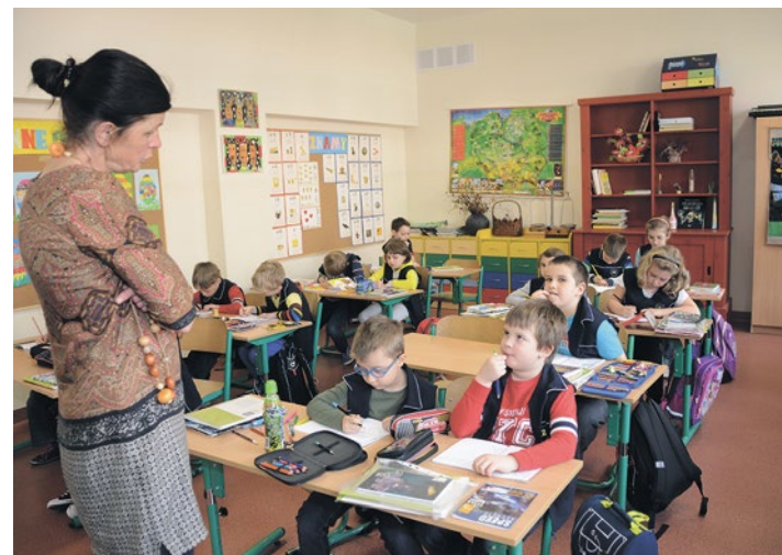
Zajęcia w zmodernizowanej częściowo w 2014 r. Szkole Podstawowej nr 12