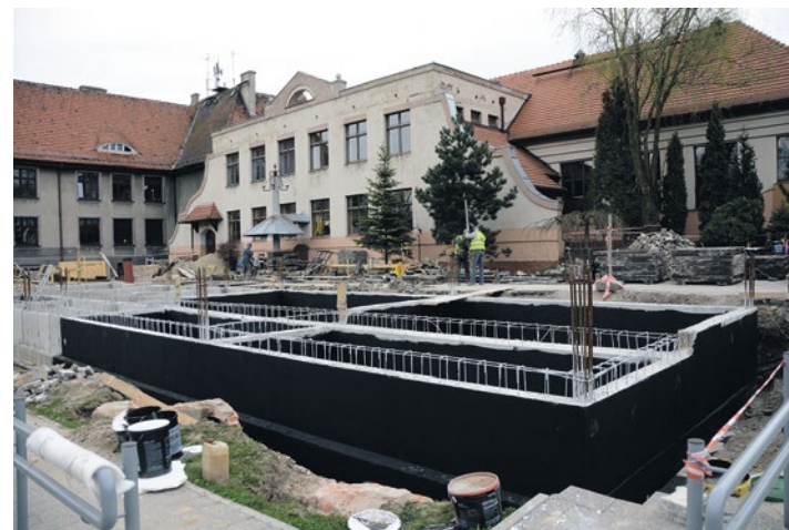
Budowa nowoczesnej siedziby Zakładu Aktywności Zawodowej