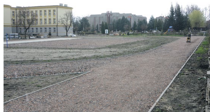
Budowa boisk sportowych przy Zespole Szkolno-Przedszkolnym nr 1