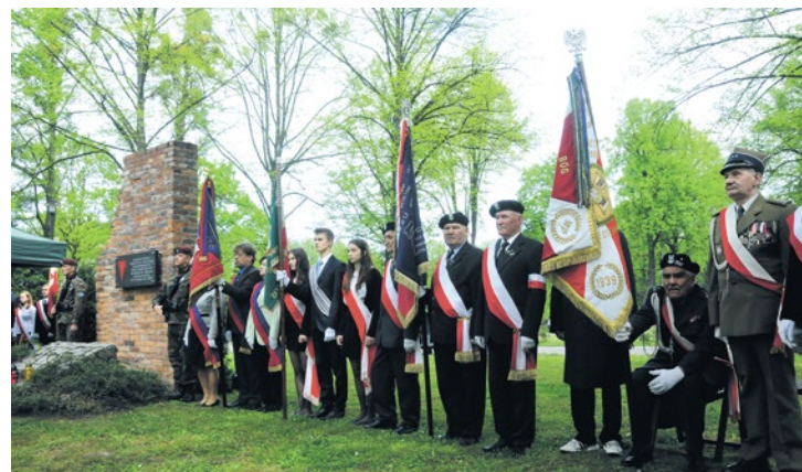
fol. Z. Daniec

27 kwietnia o godz. 13.00 na Cmentarzu Centralnym w Gliwicach odbędzie się Spotkanie Pokoleń – coroczna uroczystość organizowana dla uczczenia pamięci więźniów politycznych gliwickich filii hitlerowskiego obozu koncentracyjnego Auschwitz-Birkenau.