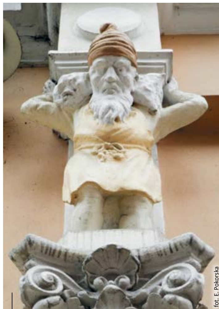
fol. E. Pokorska

Budynek przy ul. Zygmunta Starego od początku swego istnienia był przeznaczony na siedzibę władz lokalnych. Pod koniec XIX wieku mieścił się tutaj powiat gliwicko-toszecki, a po wojnie znalazła swoje miejsce powiatowa rada narodowa. Prawie każda późniejsza zmiana administracyjna powodowała równocześnie zmiany w wystroju fasady i wnętrzu. Lata 60. były najbardziej niełaskawe dla obiektu (to właśnie wtedy