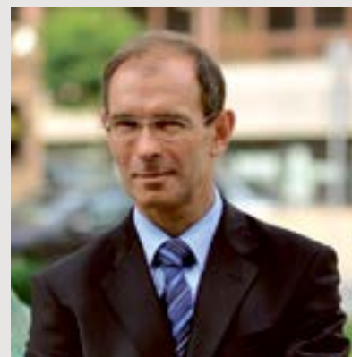
Zygmunt Frankiewicz, prezydent Gliwic

Ciepłe światło będzie rozchodzić się pierścieniowo wokół Starówki, ale im dalej od tej części miasta, tym będzie bardziej intensywne i chłodniejsze. „Ciepło” będzie jednak w całym centrum Gliwic, czyli strefie aktywnej. Specjalne oświetlenie przewidziano dla ważnych osi architektonicznych. Na ulicy Zwycię-