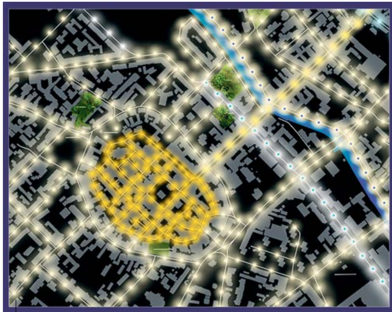
Najcieplejsza barwa światła zarezerwowana została dla Starego Miasta. Ciepłe światło wyróżniać ma też całe centrum, gdzie wyraźnie odznaczona zostanie m.in. ul. Zwycięstwa i tzw. oś Politechniki Śląskiej.

Jest już przygotowywany pakiet kolejnych inwestycji oświetleniowych. Obejmuje ulice Zwycięstwa, Toszecką, Rybnicką, Tarnogórską, Kozielską, Dworcową oraz tzw. oś Politechniki, czyli ulice Akademicką, Strzody, Wyszyńskiego i Plac Piłsudskiego. Zadania te są obecnie na etapie projektowania – w niektórych przypadkach wyło-