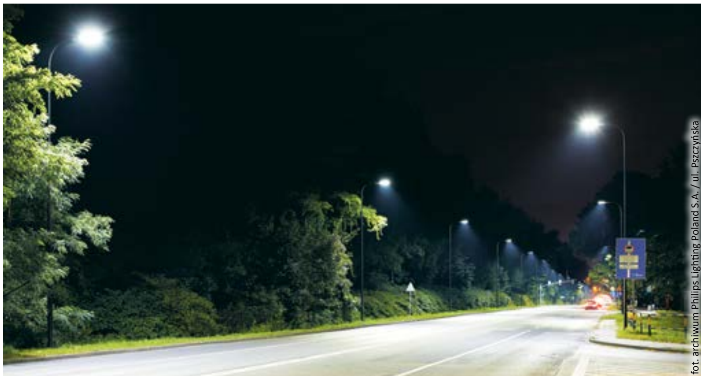
fot. archiwum Philips Lighting Poland S.A. / ul. Pszczyńska

GLIWICE REALIZUJĄ KOLEJNY INNOWACYJNY PROJEKT – TYM RAZEM DOTYCZĄCY WYKORZYSTANIA ŚWIATŁA W MIEJSKIEJ PRZESTRZENI. TO JEDNA Z PIERWSZYCH W POLSCE TAK KOMPLEKSOWA KONCEPCJA OŚWIETLENIA CAŁEGO MIASTA.