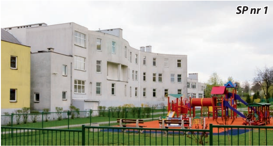
SP nr 1