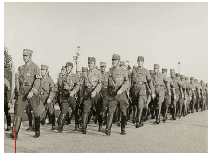
Przemarsz oddziału SA w Zabrze. Lata 30. XX wieku