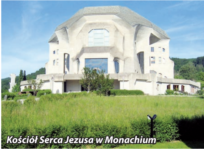
Kościół Serca Jezusa w Monachium