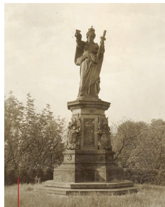
Pomnik Germanii w Parku Chrobrego. Lata 30. XX wieku

Ważne miejsce zajmuje także prezentacja obydwu wojen światowych, które nadały niemieckiej ideologii nowych wymiarów. Pierwsza – zakończona klęską Niemiec i utratą przez nich najbardziej uprzemysłowionej