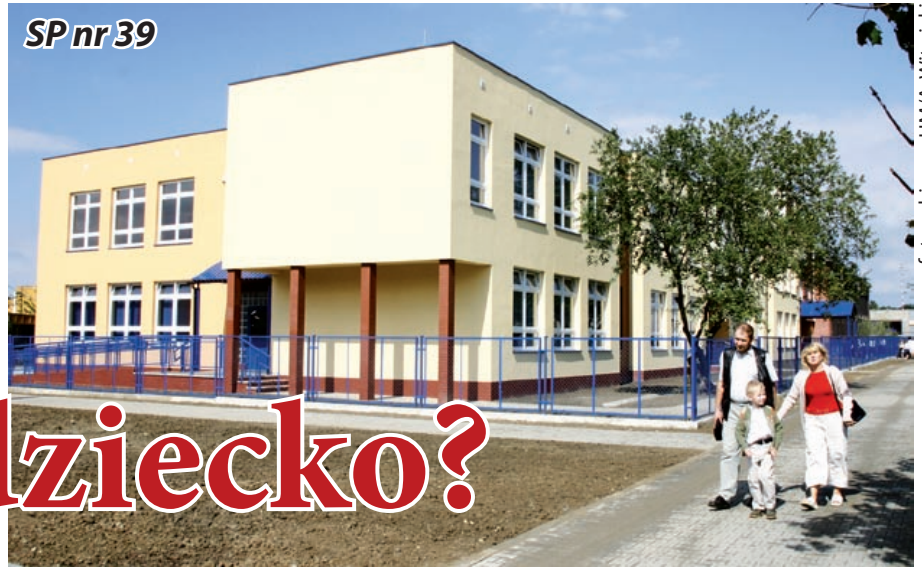
SP nr 39

lifowano na nie 1089 dzieci. 186 wolnych miejsc (w oddziałach przedszkolnych przy podstawówkach) pozostaje przede wszystkim dla pięcio- i sześciolatków, które podlegają obowiązkowemu rocznemu przygotowaniu przedszkolnemu, lecz nie zostały zakwalifikowane do wybranej placówki bądź rodzice nie zgłosili ich do I etapu rekrutacji.