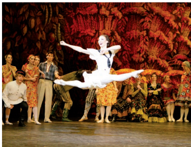
fol. materiały prasowe organizatorów

Po raz pierwszy spektakl wystawiono w 1935 roku najpierw w Teatrze Małym w Leningradzie, a następnie w Teatrze Bolszoi. Osadzona w ówczesnych realiach akcja rozgrywa się w kolchozie, do którego przyjeżdża na występy grupa artystów. Wśród nich jest pewna bardzo atrakcyjna tancerka, wzbudzająca wielkie zainteresowanie męskiej części pracowników i tym samym zazdrość ich żon. Nie brak w tym dziele zabawnej intrygi z typowymi dla utworów komicznych przebiegami i zamianami ról, co stanie się początkiem serii nieporozumień. Choć na premierze „Jasny Strumień” odniósł sukces, władze natychmiast zabroniły jego wystawiania. Uznano, że autorzy zbyt lekko podeszli do życia w kolchozach. Na deski sceny balet wrócił dopiero w 2003 roku. Transmisja będzie okazją do obejrzenia tego mało znanego i bardzo rzadko wystawianego baletu (bom)