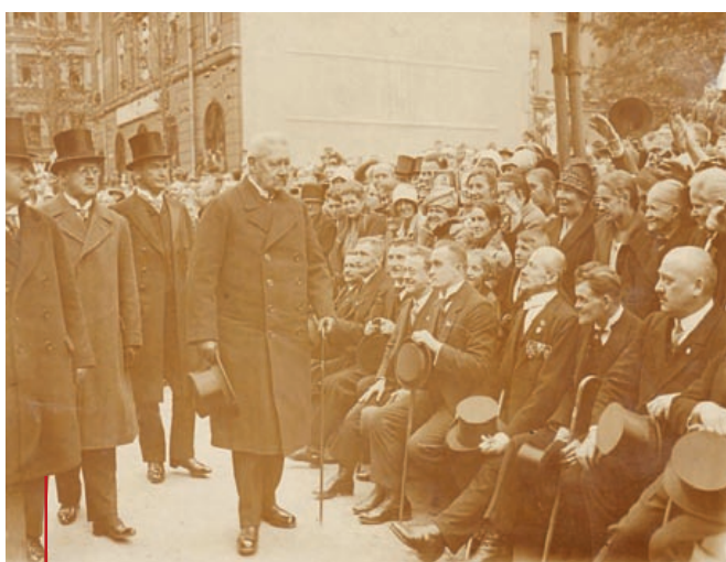
Prezydent Rzeszy Paul von Hindenburg w Gliwicach 17 IX 1928 r.