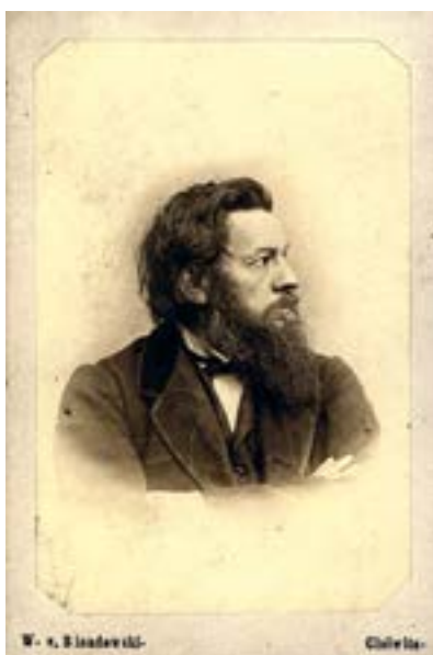
W. v. Blandowski - Gliwice