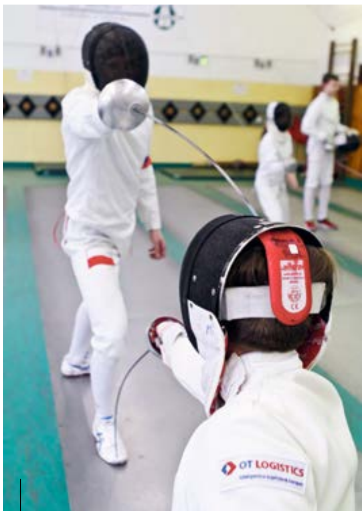
Trening młodych szermierzy Piasta Gliwice