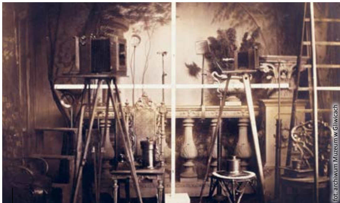
fot. archiwum Muzeum w Gliwicach

Zdjęcie z atelier Wilhelma von Blandowskiego