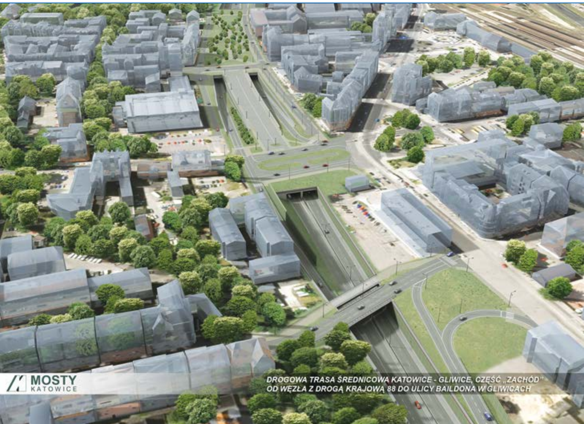
DROGOWA TRASA ŚREDNICOWA KATOWICE - GLIWICE, CZĘŚĆ „ZACHÓD” OD WĘZŁA Z DROGĄ KRAJOWĄ 88 DO ULICY BAILDONA W GLIWICACH