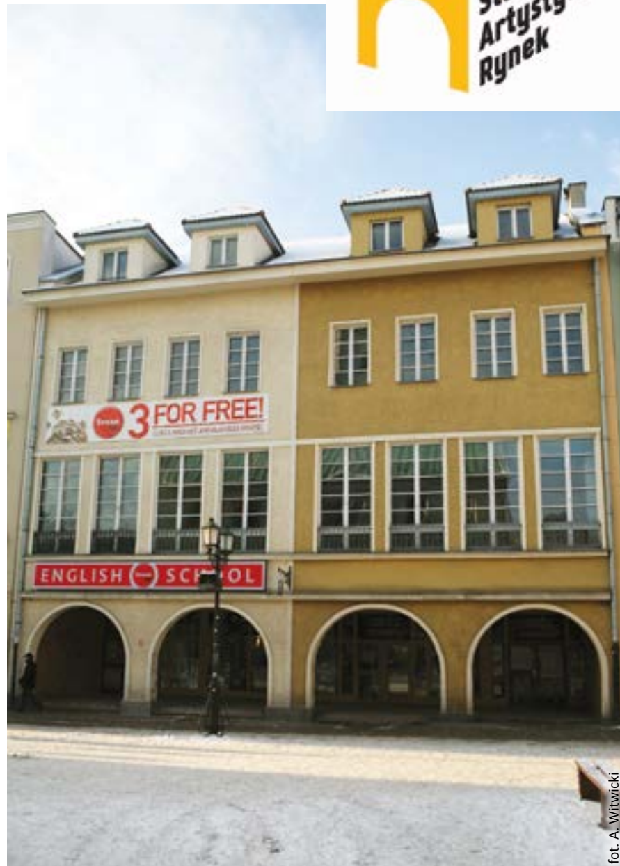
fol. A. Witwicki