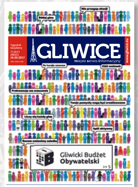
Nr 835, z 16 lutego 2017 r. – wśród ludzików ukryliśmy całą redakcję MSI :)