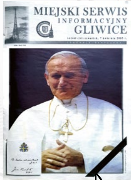
W numerze specjalnym związanym ze śmiercią Jana Pawła II zaprezentowano odświeżoną winietę - pojawiło się w niej ówczesne logo Gliwic.