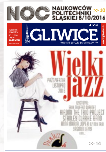
Nr 816, z 6 października 2016 r. – kolejne odświeżenie winiety