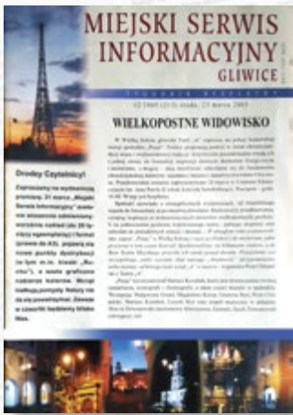
Miejski Serwis Informacyjny – Gliwice, nr 213 z 23 marca 2005 r. Ostatni numer gazety w formacie A4.

Redakcja „Miejskiego Serwisu Informacyjnego – Gliwice”