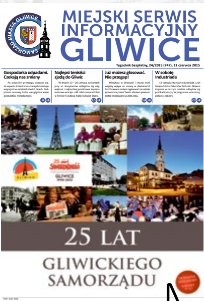
MSI-GLIWICE nr 747, z 11 czerwca 2015 r. – numer specjalny z okazji 25-lecia gliwickiego samorządu