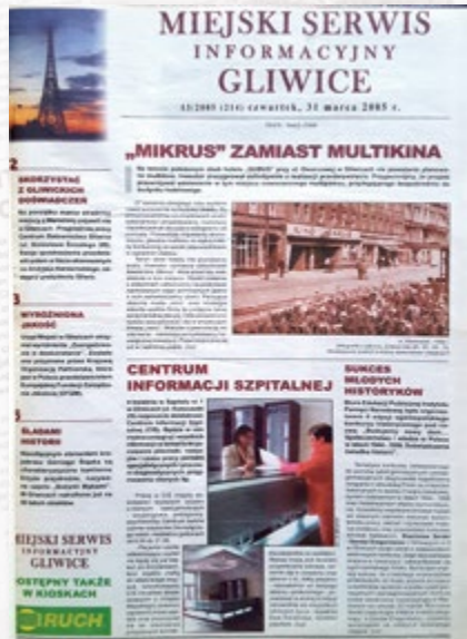
Nr 214, wydanie z 31 marca 2005 r. ukazało się w formacie gazetowym.