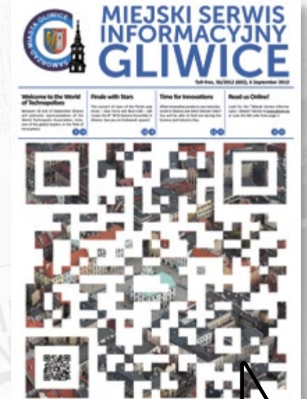
MSI z 6 września 2012 r. (nr 502) ukazało się w nowej szacie graficznej. Z okazji 8. Generalnego Zgromadzenia WTA w Gliwicach gazetę przygotowano również w wersji angielskiej.