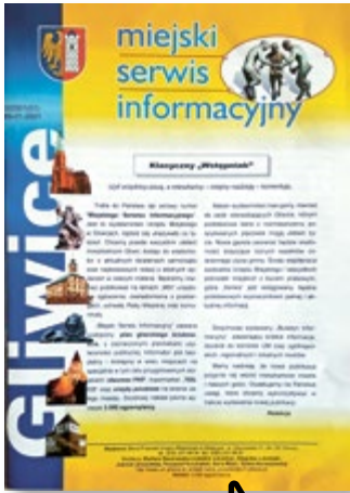
Nr 0 (01) Miejskiego Serwisu Informacyjnego, wydanie z 9 stycznia 2001 r. Format A4.

9 stycznia 2001 r. ukazał się zerowy numer Miejskiego Serwisu Informacyjnego. Bezpłatny informator, w formacie A4 i nakładzie 3 tys. egzemplarzy, pojawił się na specjalnych stojakach, m.in. na dworcu PKP, w hipermarkecie TESCO oraz urzędach pocztowych). – Chcemy przede wszystkim ułatwić mieszkańcom Gliwic dostęp do wiadomości o aktualnych działaniach samorządu oraz najświeższych relacji z istotnych wydarzeń w naszym mieście (...) Mamy nadzieję, że nowa publikacja przyjmie się wśród mieszkańców – deklarowali na okładce członkowie redakcji.