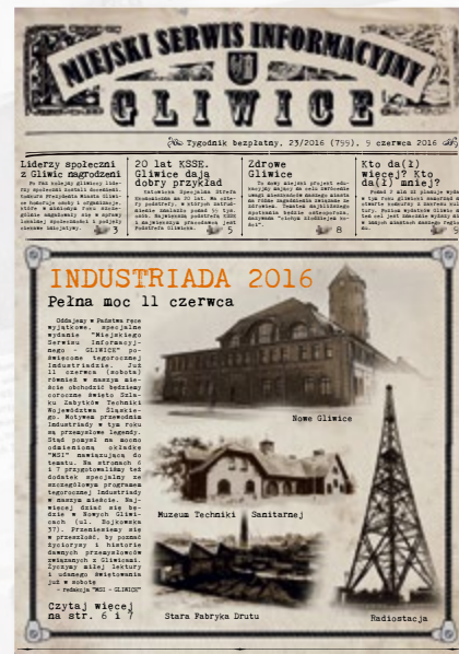
Nr 799, z 9 czerwca 2016 r. – okładka specjalna na finał Industriady 2016