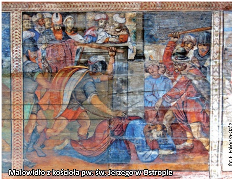
Malowidło z kościoła pw. św. Jerzego w Ostropie

W niedokończonym dziele „Złożenie do grobu” Leonarda da Vinciego (o którym nie do końca wiemy, czy naprawdę jego autorem jest słynny Leonardo) postacią martwego Chrystusa jest