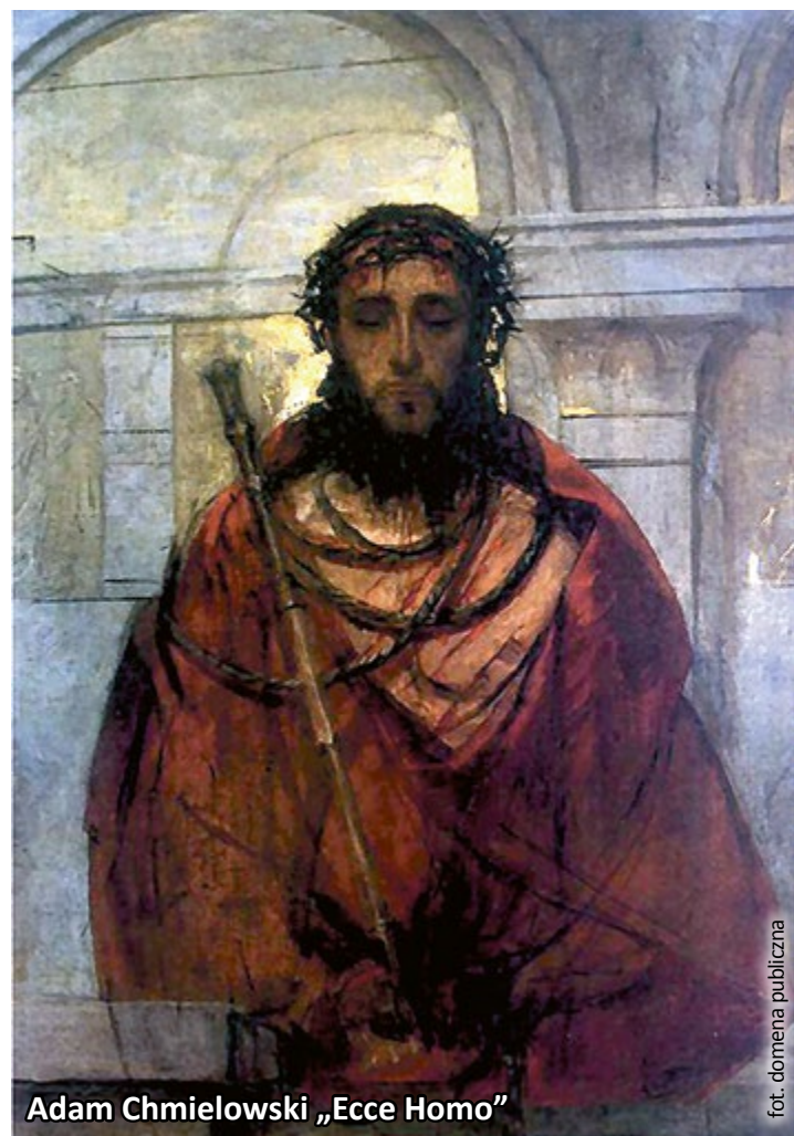
Adam Chmielowski „Ecce Homo”