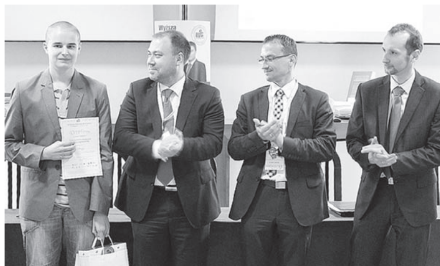
fol. E. Szymańska