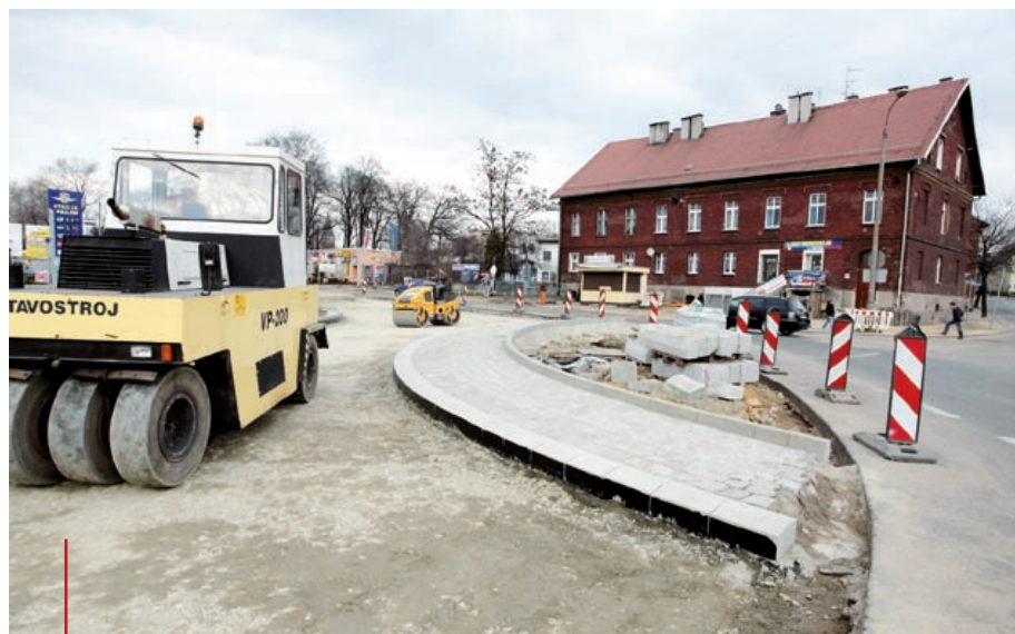
Rondo w sąsiedztwie hali wznoszonej przy ul. Toszeckiej ma być otwarte na przełomie maja i czerwca – do tego czasu kierowcy muszą liczyć się z utrudnieniami