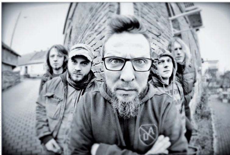
fol. M. Stachowski

oraz w księgarni „Czas” przy ul. Zwycięstwa 1. – W dniu koncertu bilety będą dostępne tylko na terenie Fabryki, zaś wejściówki zakupione na koncert, który miał się odbyć 31 marca, pozostają ważne – zapowiadają organizatorzy.