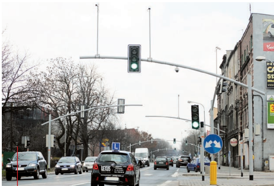
W tym roku kolejne 45 skrzyżowań połączy inteligentny system sterowania sygnalizacją świetlną

W ciągu miesiąca powinna rozpocząć się przebudowa mostu na Kanale Gliwickim w ciągu ul. Staromiejskiej w Łabędach. Inwestycja warta około 1 mln zł ma zostać sfinalizowana jesienią. Na ten rok zaplanowano także m.in. zbudowanie chodników i ścieżki ro-