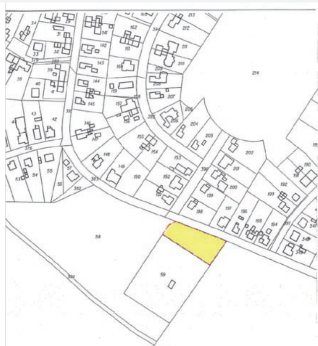
Załącznik graficzny do ogłoszenia

Uwagi mogą również dotyczyć prognozy oddziaływania na środowisko. Organem właściwym do rozpatrzenia uwag jest prezydent miasta Gliwice, a w przypadku uwag nieuwzględnionych przez prezydenta miasta dodatkowo Rada Miejska.