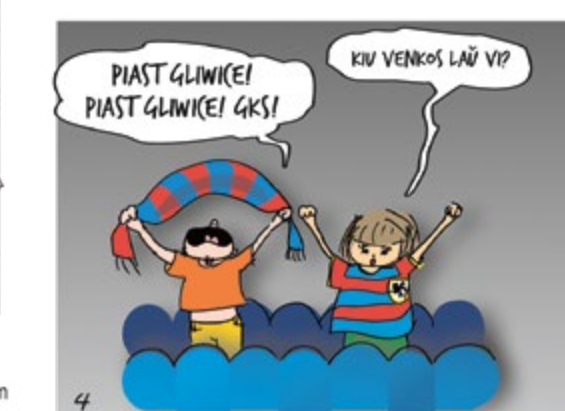
Monika: Kto wygra według Ciebie? Antonio: Piast Gliwice! Piast Gliwice! GKS!

już spory kawałek świata: całą Europę (włącznie z Grenlandią!), Amerykę Południową, a niedawno jeden z nich wrócił z Nepalu. Pan Mandrak śmieje się, że już po 5 minutach rozmowy z innym esperantystą czuje, jakby znali się od lat. Dobrym powodem do odwiedzania najdalszych zakątków globu są światowe kongresy esperantystów – w tym roku to wydarzenie odbędzie się u naszych