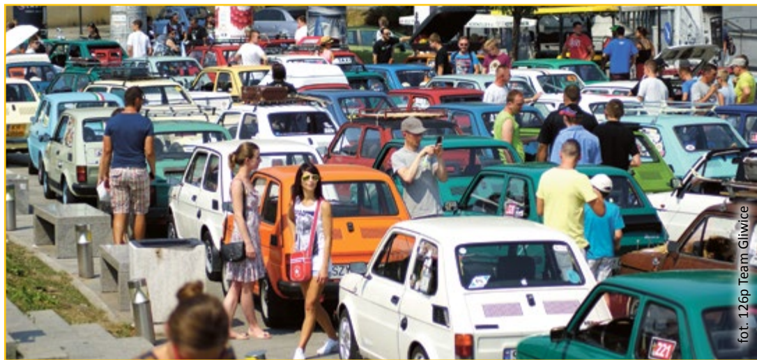
126p Team Gliwice

jakąś historię. – Czasem to historia nie związana z Gliwicami, bo w naszej grupie