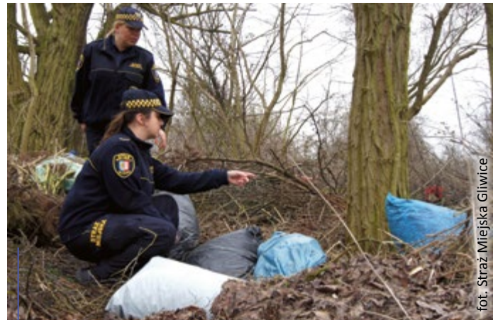
Straż Miejska często odkrywa dzikie wysypiska śmieci. Ujęcie na gorącym uczynku osób, które wyrzucają odpady tam, gdzie nie powinny jest niezwykle trudne, ale zdarza się coraz częściej

Straż Miejska systematycznie prowadzi też kontrole zarówno przedsiębiorstw, jak i posesji prywatnych z zakresu przestrzegania przepisów dotyczących gospodarki odpadami