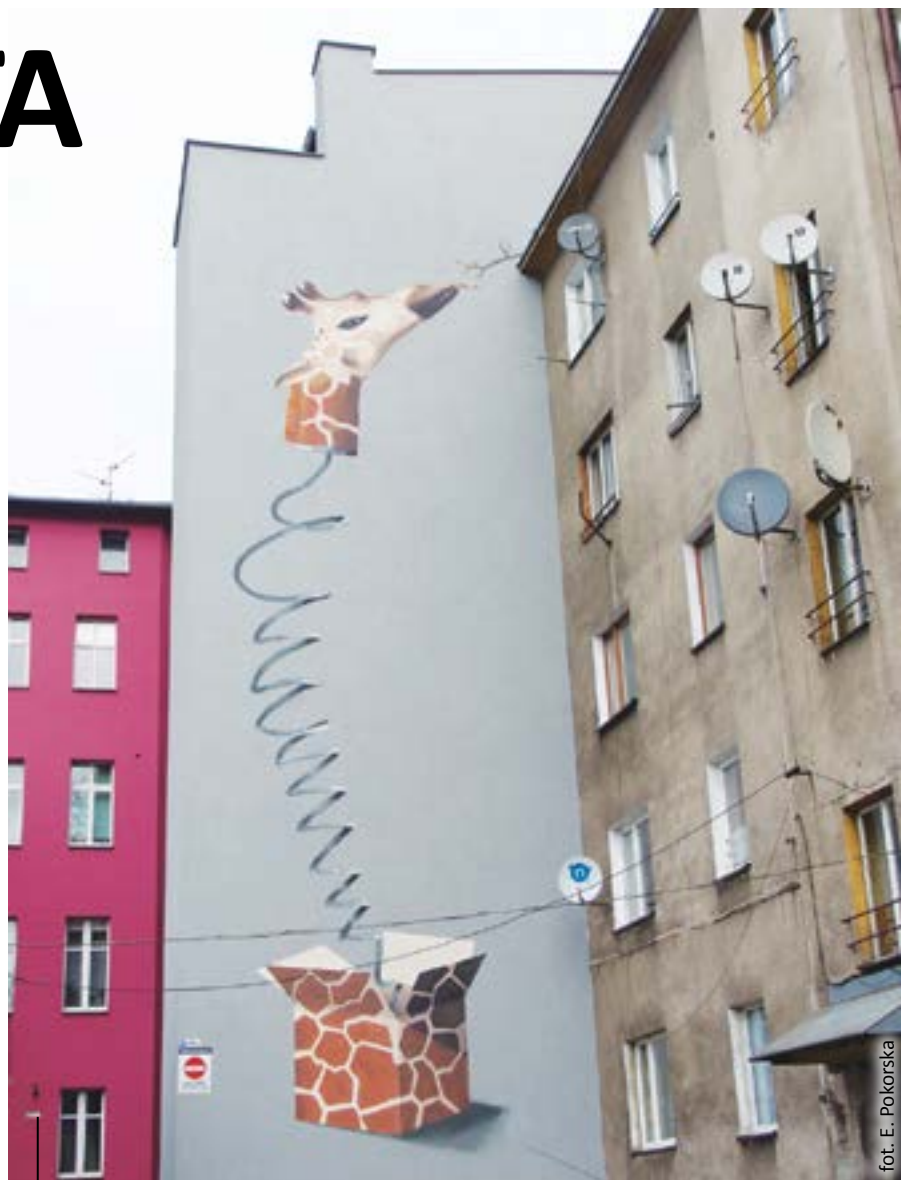
Interesujący przykład malowidła ściennego – pomysł wspólnoty mieszkaniowej przy ul. Bohaterów Getta Warszawskiego 19

Oczywiście nie każda forma ekspresji autorów ściennych malowideł jest zła. Moim zdaniem dopuszczalne jest umieszczanie rysunków na murach budynków za zgodą ich właścicieli, tak jak to