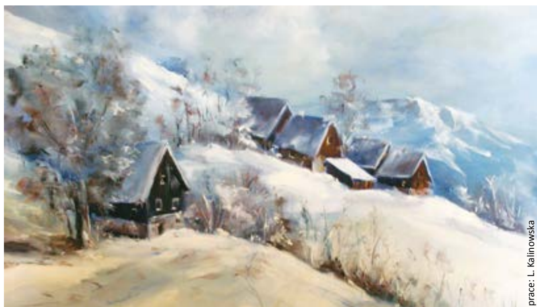
prace: L. Kalinowska

„(...) Sława ta – jak każde nieszczęście – spada na nas zniecka. Pewnego wieczoru mianowicie pakuje się do naszego pokoiku jakieś na biało ubrane drabisko, zadaje pięć głupich pytań, wyłudza sześć fotografii formato grande, kłania się i idzie. Następnego dnia natomiast w najpopularniejszej miejscowej gazecie „El Mercurio” ukazuje się całostronicowy artykuł, który krzyczy wielkimi czcionkami na czołowym miejscu, że takich oto dwóch uwidocznionych na zdjęciu „muchachos Polacos”, obszedłszy cały świat piechotą, przybyło wczoraj przez Andy do miasta Valparaiso. Artykuł ten staje się prawdziwą sensacją nie tyle dla miejscowej ludności, ile dla nas samych, gdyż dowiadujemy się z niego wielu nowych, ciekawych i dotąd nam zupełnie nieznanymi szczegółów o własnych skromnych osobach. ...Że jesteśmy „muchachos lindos y robustos”, to jest niby „młodzieńcy ładni i krzepcy”. Że gadamy płynnie wszystkimi bez wyjątku językami Europy. Że będąc w Brazylii, rozdarliśmy na drobne kawałki rosnącego jaguara. Że całą Paranę przebyliśmy wplaw. Że w Argentynie własnymi rękoma zbudowaliśmy kolej... i tak dalej, i dalej (...)”