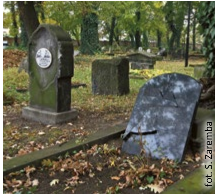
fol. S. Zaremba

– Wydaje mi się, że wersja ukierunkowana ściśle na jeden temat jest łatwiejsza w odbiorze i więcej się z takiej trasy zapamiętuje, bo tworzy się pewna całość. Bardzo wygodne jest też