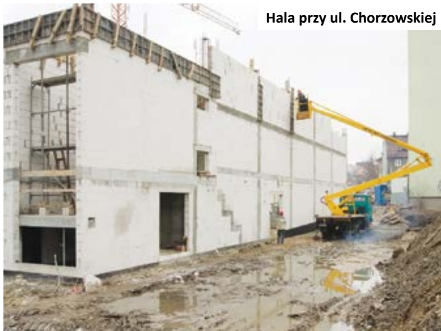
Hala przy ul. Chorzowskiej