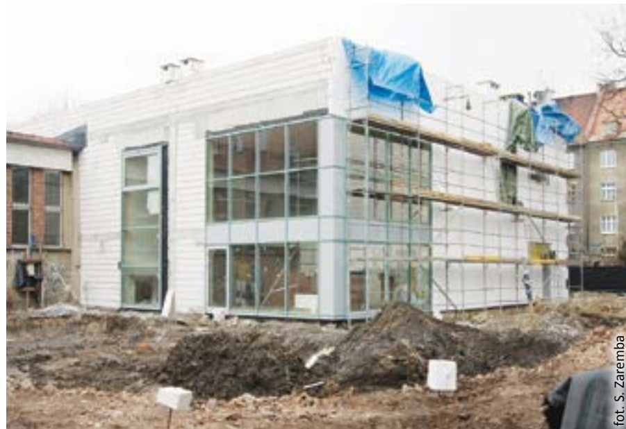
Hala przy ul. Górnych Wałów