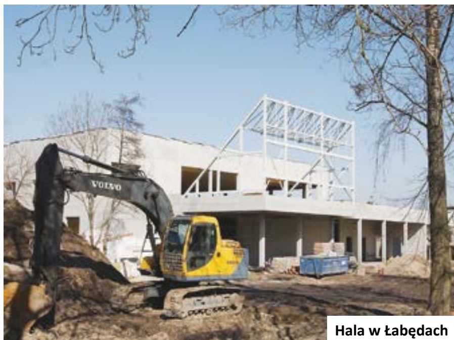
Hala w Łabędach