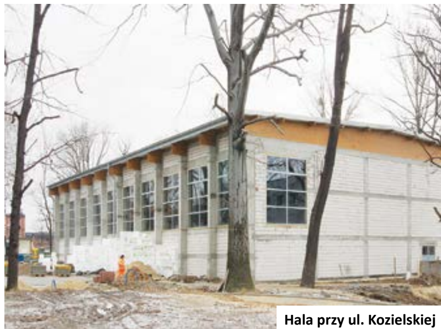
Hala przy ul. Kozielskiej