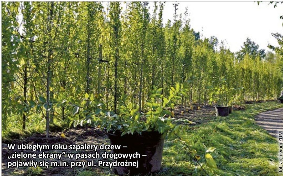
W ubiegłym roku szpalery drzew – „zielone ekrany” w pasach drogowych – pojawiły się m.in. przy ul. Przydrożnej

Przy Nowym Świecie posadzono już 25 platanów klonolistnych. Te dekoracyjne drzewa z „cętkowaną” korą wykazują dużą odporność na zanieczyszczenie