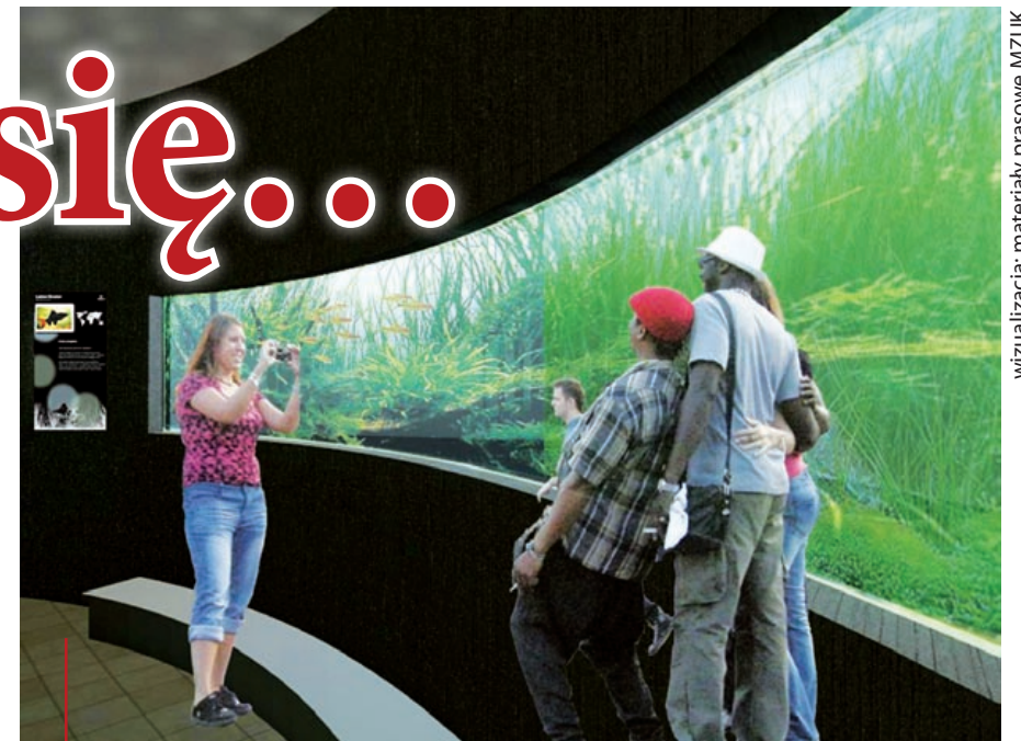
Ryby z różnych stron świata już jesienią będzie można podziwiać w Palmiarni Miejskiej

nię na świeżym powietrzu, a także otwartą polanę. Powstanie droga dojazdowa od strony ul. Łabędzkiej i miejsca parkingowe przy wejściu do parku. Całość ma być gotowa w 2013 r.