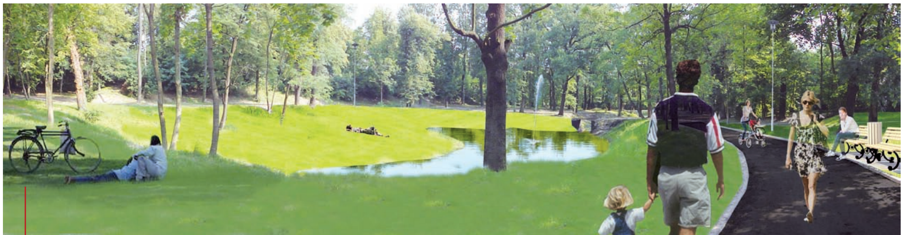
Relaks nad wodą i wśród zieleni? Takie rzeczy – prawdopodobnie już w przyszłe lato – w Parku Szwajcaria

Renowacja rzeźb to nie jedyne zmiany na gliwickich nekropoliach. W tym ro-