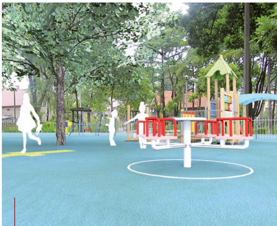
W parku w Bojkowie powstanie m.in. nowoczesny plac zabaw

Kolejnym dużym projektem będzie przebudowa Parku Szwajcaria, oczekiwana przez mieszkańców okolicznych osiedli. Przewidziano tam: oświetlenie terenu, remont mostku między zbiornikami wodnymi, wykonanie ścieżki spacerowej, przy której staną ławki, nowe trawniki i nasadzenia. Zaplanowano ponadto plac zabaw, siłow-