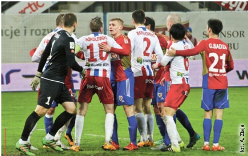
W meczu z Podbeskidziem w ruch poszły nie tylko nogi. Emocje wzięły górę i piłkarze obu drużyn mieli problem z utrzymaniem nerwów na wodzy

wych zagrań. W końcu dobrze graliśmy piłką – chwalił swoich piłkarzy trener Piasta Gliwice, Radosław Látał.