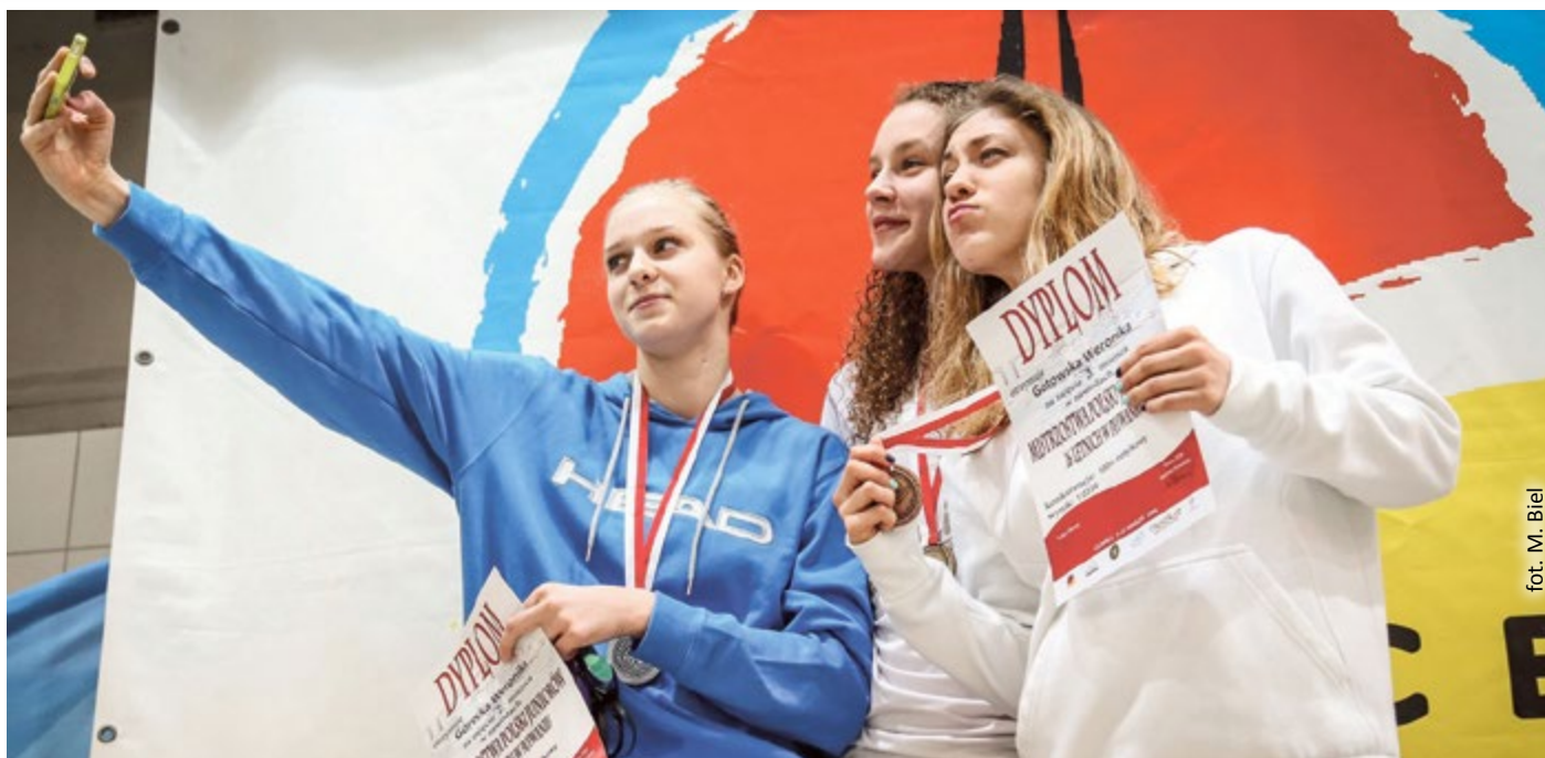
fol. M. Biel

Choć w kalendarzu już niebawem będziemy mieć wiosnę - zima pewnie nie powiedziała jeszcze ostatniego słowa. Kto tęskni już za ciepłem i zielenią, powinien odwiedzić gliwicką Palmiarnię! W pawilonie roślin użytkowych owocują pomarańcze, w pawilonie tropiku w pełni kwitnienia jest wiele gatunków storczyków, w pawilonie historycznym kwitnie w żółtym kolorze picairnia oraz nowość – palma arena. Uwaga: Palmiarnia Miejska będzie otwarta także w najbliższy poniedziałek (zwykle w poniedziałki jest nieczynna), 21 marca, w godz.: 9.00 – 18.00!