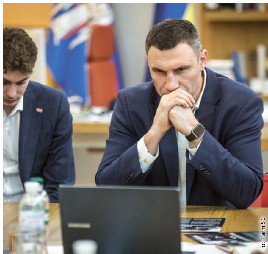
Witalij Kliczko, mer Kijowa, podczas spotkania z przedstawicielami The Farm 51

The Farm 51 nawiązało również współpracę dotyczącą wsparcia wizerunkowego swojego innowacyjnego projektu Virtual Reality, „Chernobyl VR Project”, z Witalijem Kliczką, byłym bokserem, obecnie merem Kijowa. Premiera projektu odbędzie się 26 kwietnia 2016 r., w 30. rocznicę katastrofy. „Chernobyl VR Project” łączy świat wirtualnej rzeczywistości ze światem aplikacji edukacyjnych. To pierwsze w historii wirtualne muzeum i wirtualna wycieczka do Czarnobyla i Prypeci przeznaczona na urządzenia mobilne i VR (Oculus Rift, HTC Vive, PlayStation VR). Projekt powstaje przy użyciu technologii Reality 51, która zapewnia maksymalne przeniesienie rzeczywistości do świata wirtualnego. (mf)