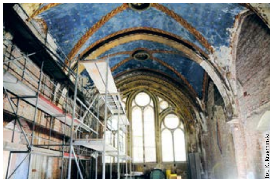
fol. K. Krzemiński

Nad przebiegiem prac czuwa woje-wódzki konserwator zabytków, ponieważ