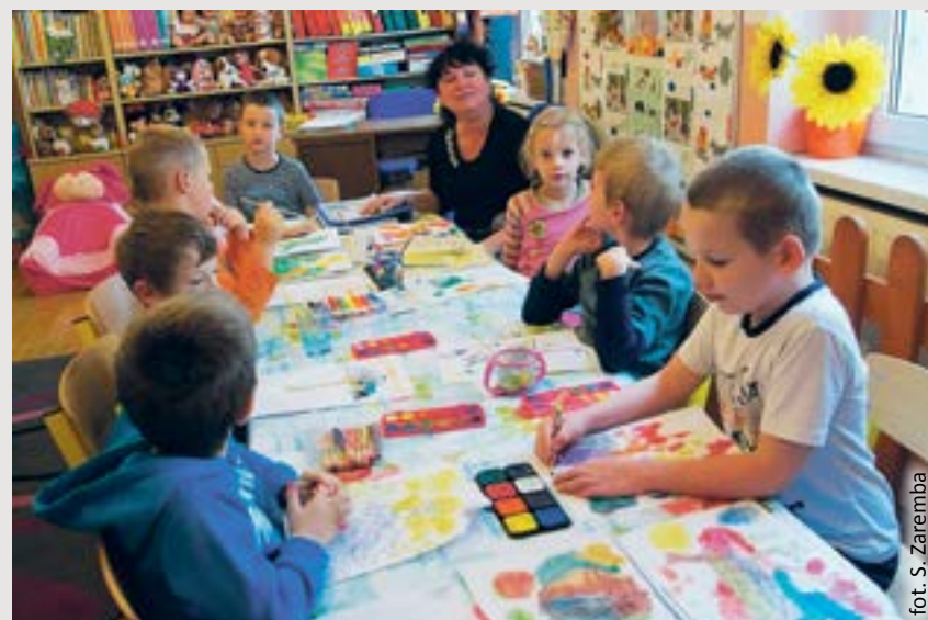
fol. S. Zaremba

W chwili rozpoczęcia rekrutacji wniosek o przyjęcie dziecka, poza wskazaną stroną internetową, będzie można pobrać również w każdym przedszkolu czy szkole.