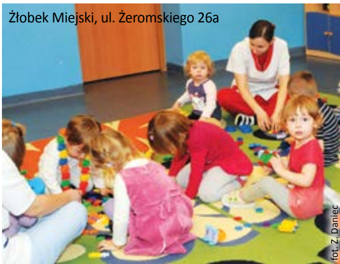
Żłobek Miejski, ul. Żeromskiego 26a

Żłobki Miejskie (ŻM) w Gliwicach mieszczą się w 4 oddziałach: przy ul. Berbeckiego 10, ul. Mewy 34, ul. Kozielskiej 71 i ul. Żeromskiego 26a. Po wejściu w życie nowych przepisów dotyczących tego typu placówek oraz w efekcie utworzenia przez miasto nowej grupy dla dzieci w oddziale przy ul. Żeromskiego 26a, liczba miejsc w ŻM wzrosła ze 170 do 230.