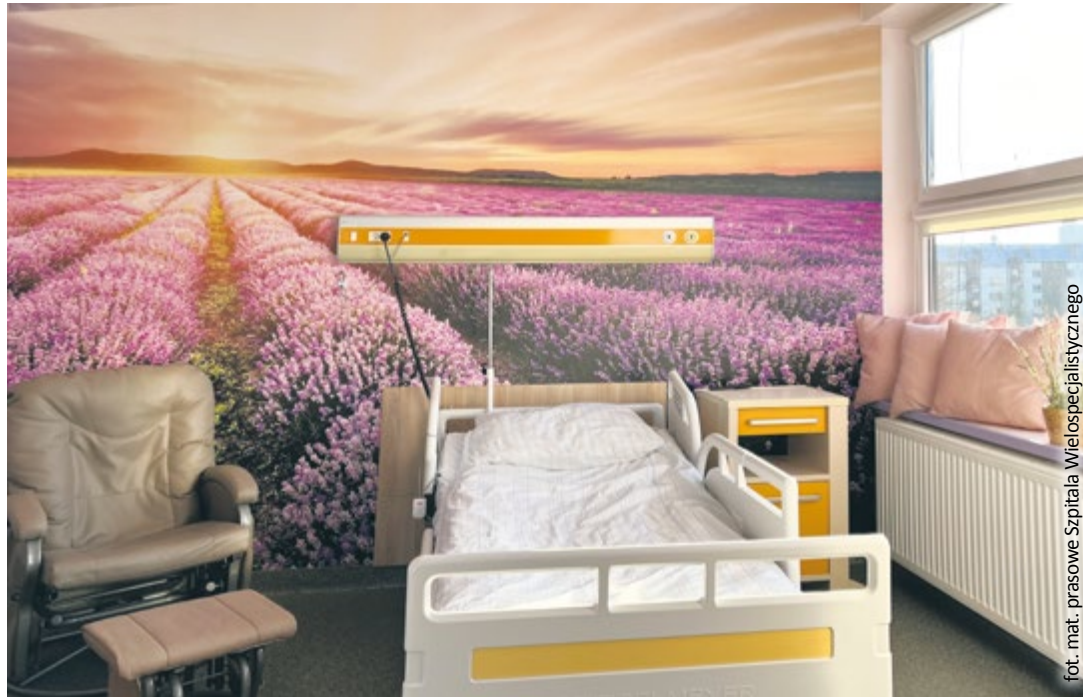
fol. mat. prasowe Szpitala Wielospecjalistycznego

Oczywistością szpitala są porody rodzinne, porody w wodzie oraz kangurowanie przez ojców maluszków urodzonych przez cesarskie cięcie. We wszystkich salach porodowych znajdują się fotele do karmienia zakupione ze środków Wielkiej Orkiestry Świątecznej Pomocy. Miłą niespodzianką, a zarazem pamiętką po pobycie na gliwickim położnictwie jest wyprawka dla dziecka, którą od sierpnia 2018 r. finansuje w połowie Miasto Gliwice. Zestaw zawiera m.in. miękką i przytulny kocyk typu