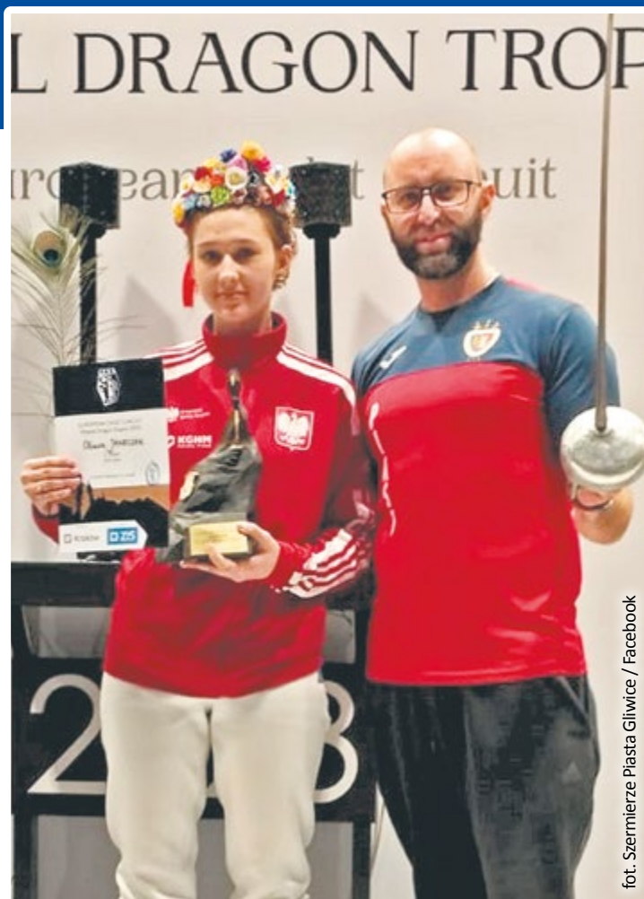
fol. Szermierze Piasta Gliwice / Facebook