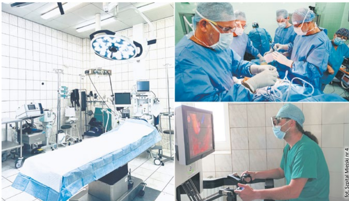
fol. Szpital Miejski nr 4

Do czasu wybudowania Szpitala Uniwersyteckiego – Centrum Chorób Cywilizacyjnych w Gliwicach, w starych budynkach Szpitala Miejskiego poszerzana jest oferta medyczna i unowocześniane jest wyposażenie. Na tyle, ile to możliwe, poprawiane są warunki przyjmowania chorych. Otrzymane właśnie środki pozwolą na istotne usprawnienie diagnostyki i leczenia onkologicznego.