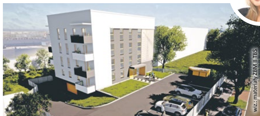
wiz.: materiały ZBM II TBS

Budynek przy ul. Opolskiej będzie miał 4 kondygnacje (powstaje obok nienależącej do miasta przychodni kolejowej). Znajdą się w nim 4 mieszkania jednopokojowe, 9 dwupokojowych oraz 3 trzypokojowe. Jedno, na parterze, będzie przystosowane do potrzeb osoby z niepełnosprawnościami. W budynku znajdzie się winda i podziemny garaż z 12 miejscami postojowymi, powstanie również parking zewnętrzny na 9 samochodów (w tym