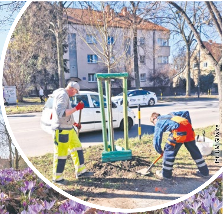
fol. UM Gliwice