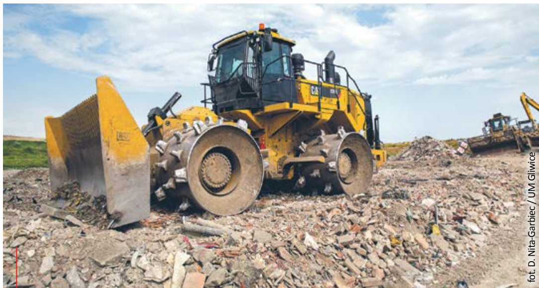
Dzięki funkcjonowaniu kompleksowego systemu gospodarowania odpadami komunalnymi, segregowaniu i odpowiedniemu przetwarzaniu śmieci tylko niewielka ich część trafia ostatecznie na wysypisko w Gliwicach.

Jako spółka ze 100-procentowym udziałem miasta, PZO musi także w sposób szczególny dbać o spełnianie wysokich standardów zarządczych. Obecna prezes zarządu Przedsiębiorstwa Zagospodarowania Odpadów, wraz z objęciem ponad dwa lata temu obowiązków, zaczęła wdrażać w życie nowe inicjatywy, korzystając przy tym z potencjału wypracowanego już wcześniej w firmie oraz motywując załogę do dalszego zaangażowania. Aby lepiej zorientować się w szczegółach związanych z prowadzeniem spółki, za konieczne uznała sprawdzenie dotychczasowych spraw związanych z finansami i majątkiem miejskiej firmy.