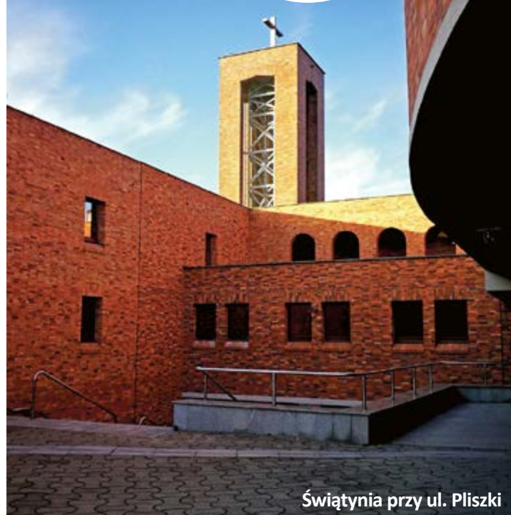
Świątynia przy ul. Pliszki