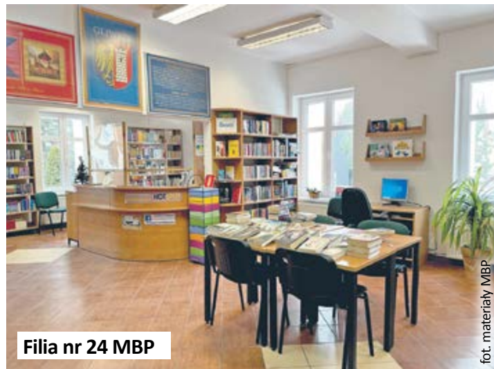
Filia nr 24 MBP

W Filii nr 17 MBP w Gliwicach (ul. Spółdzielcza 33a) wypożyczalnia dla dorosłych i dzieci, pomieszczenia socjalne i korytarze zostały odmalowane. Remont przeszły