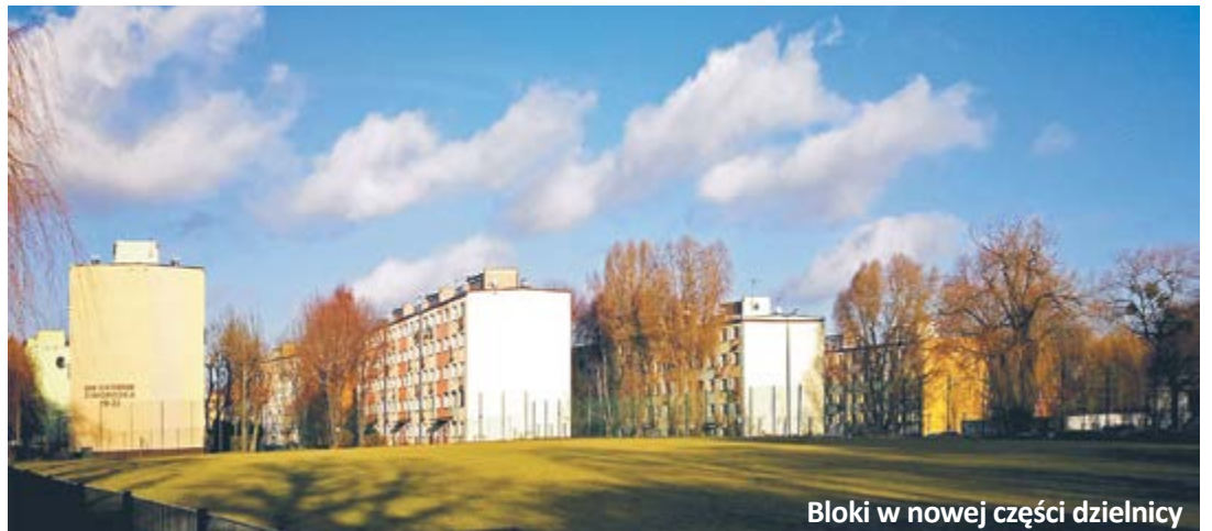
Bloki w nowej części dzielnicy