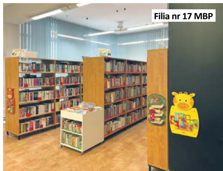
Filia nr 17 MBP

także łazienki. Wymieniono stolarkę wewnętrzną i podłogi w holu głównym. Inwestycja kosztowała ponad 75 tys. zł i została sfinansowana z budżetu MBP w Gliwicach.