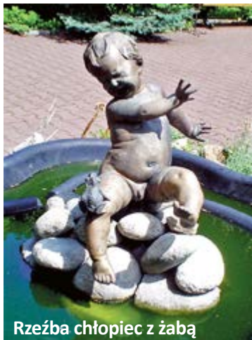
Rzeźba chłopiec z żabą

W ogrodzie ulokowano budynek bractwa kurkowego, strzelnicę i zadaszoną werandę dla gości, dla których przygrywali muzycy umieszczeni w ośmiobocznym pawilonie. Zabudowania te nie zachowały się do dziś. Strzelnicę zastąpił nowy obiekt, jednak w zastosowanych rozwiązaniach elewacji projektant zacytował, co było przedtem, wyko-