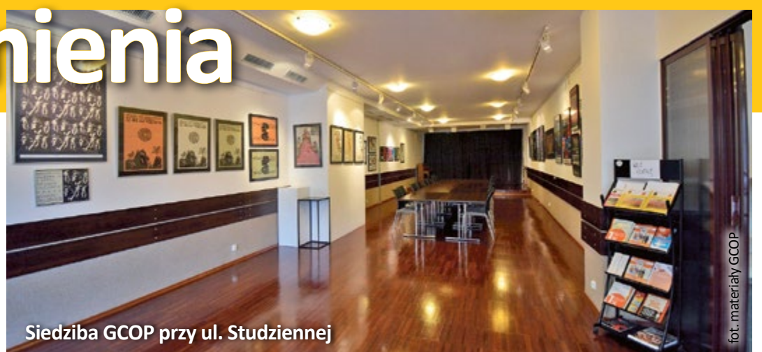
Siedziba GCOP przy ul. Studziennej

Zmieni się również lokalizacja GCOP. Obecnie główna siedziba znajduje się przy ul. Zwycięstwa 1, gdzie działa administracja, Dział NGO i Projektów oraz Dział Aktywności Społecznej. Przy ul. Jagiellońskiej 21 realizowany jest projekt „Twoja społeczność Twoją szansą”, a przy ul. Studziennej 6 działa Strefa Seniora. Organizacje pozarządowe i społecznicy mają do dyspozycji również sale w Młodzieżowym Domu Kultury przy