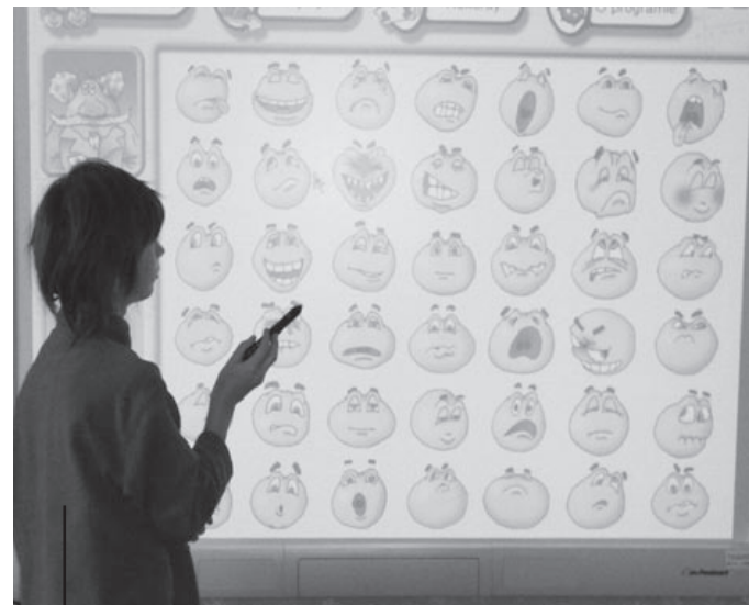
fol. materiały prasowe Gimnazjum nr 19

– W tej klasie nasze dzieci mają możliwość kontynuowania edukacji na poziomie gimnazjum w warunkach dla nich najdogodniejszych. Biorąc pod uwagę, że należą one do grupy uczniów ze specjalnymi potrzebami edukacyjnymi, w klasie terapeutycznej mają możliwość zdobywania wiedzy w małej grupie szkolnej, wśród rówieśników, co niewątpliwie jest lepszą formą kształcenia niż nauczanie indywidualne, z którego korzystałaby większość naszych dzieci – piszą rodzice uczniów uczęszczających do nowo utworzonej klasy w podziękowaniu dla wszystkich osób, które pomogły w utworzeniu klasy. (as)