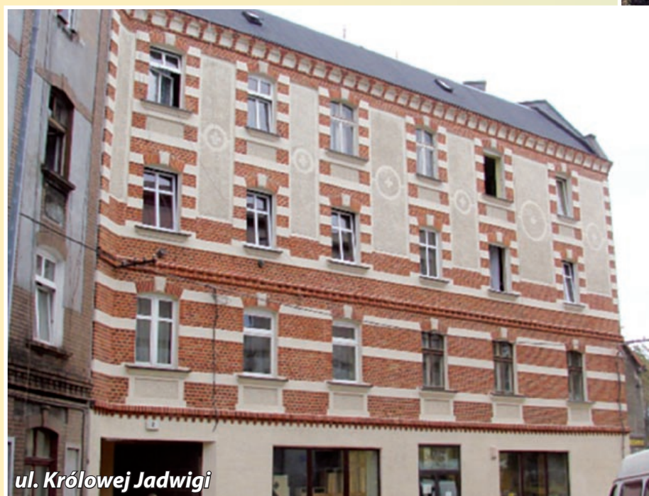
ul. Królowej Jadwigi

„Paroles, paroles, paroles...” (słowa, słowa, słowa). Cytat zachwyca, lecz piosenka mówi przede wszystkim o miłości, natomiast ja ciągle piszę i piszę o kolorach w architekturze – dobrze lub źle zastosowanych. Aby moje refleksje nie uciekły czyjejś uwadze (co się czasem zdarza), dla odmiany w tym odcinku cyklu postanowiłam przedstawić ciut więcej zdjęć ilustrujących zagadnienie. Może będą miały większe znaczenie niż słowo pisane?