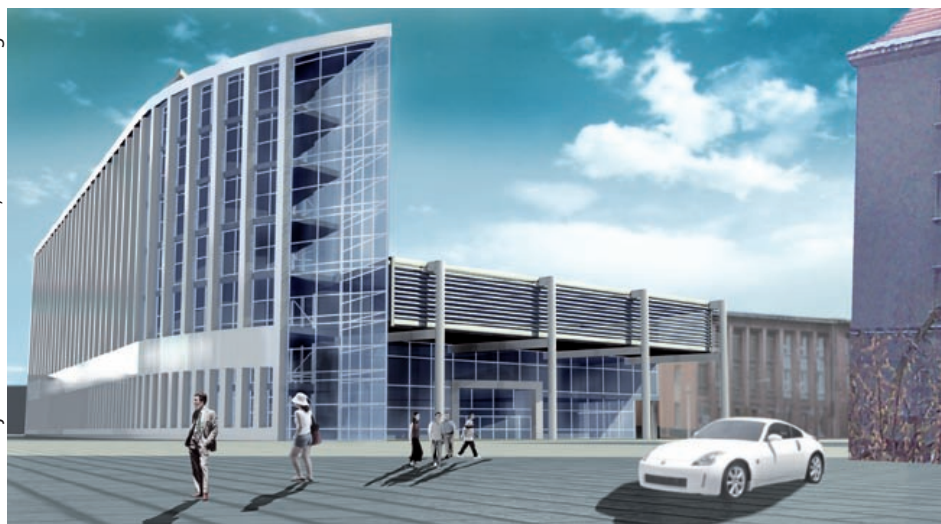
wizualizacja: dr inż. arch. J. Witeczek, dr inż. arch. T. Wagner

Na 14 tys. m 2 powstanie ponad 170 pomieszczeń. Pierwsze zajęcia odbędą się w roku akademickim 2013/2014. (fid)