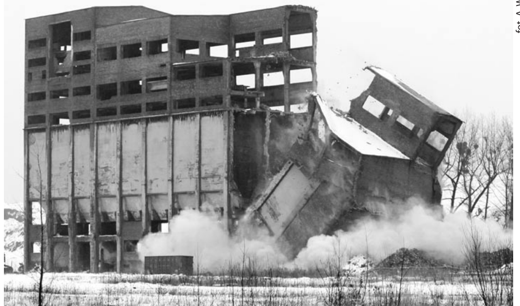
fol. A. Witwicki