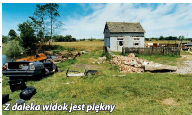
Z daleka widok jest piękny

Szczegółowy harmonogram projekcji wraz z opisami filmów można znaleźć na stronie www.amok.gliwice.pl . (bom)