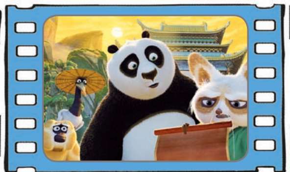
Kung Fu Panda 2