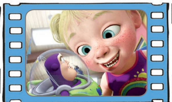
Toy Story 3