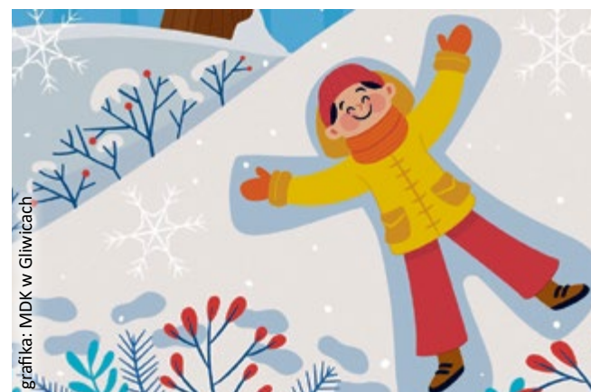
grafika: MDK w Gliwicach

Mimo że zapisy online na zajęcia organizowane przez Młodzieżowy Dom Kultury zostały już zamknięte, to uchwyciły się ostatnie wolne miejsca na kilka interesujących aktywności. Do wyboru są: zimowe warsztaty wokalne (grupa II, 19–20 lutego, godz. 11.45–14.00 , wiek 13–19 lat), warsztaty fotografii studyjnej „Przepyszna martwa natura” ( 16 i 23 lutego, godz. 16.00–19.00 , wiek 10–14 lat), warsztaty plastyczne „ARCYDZIEŁKO – co się skrywa na obrazach słynnych malarzy?” ( 18 i 25 lutego, godz. 15.00–18.45 , wiek 8–12 lat), „Zimowe tony” ( 23–27 lutego, godz. 10.00–13.00 , wiek 7–10 lat) oraz „Zimowe zwierzaki” (grupa II, 26