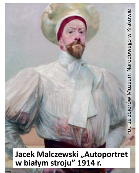
Jacek Malczewski „Autoportret w białym stroju” 1914 r.

Żądni wiedzy coś dla siebie znajdą też w dwóch filiach Muzeum w Gliwicach. W Willi Caro ( od wtorku do piątku, o godz. 9.00 i 11.00 ) na przedszkolaki od lat 5 oraz uczniów szkół podstawowych czekać będą zajęcia „Chimery, fauny i Meduza – fantastyczna drużyna Jacka Malczewskiego” oraz „Przez dziurkę od klucza – jak wyglądało życie w Willi Caro?”. Z kolei w Oddziale Odlewnictwa Artystycznego ( od wtorku do piątku, o godz. 9.00 i 11.00 ) wszystkie grupy wiekowe będą mogły dowiedzieć się „Jak powstają odlewy artystyczne”, a uczniowie