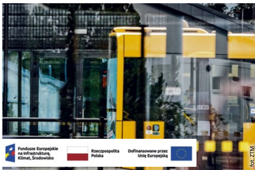
Fundusze Europejskie na Infrastrukturę, Klimat, Środowisko | Rzeczpospolita Polska | Dofinansowane przez Unię Europejską

W obrębie węzła powstanie stacja roweru metropolitalnego, wiata rowerowa, samoobsługowa toaleta publiczna. Pojawi się nowe oświetlenie, ławki i elementy małej architektury. Przystanki otrzymają tablice dynamicznej informacji pasażerskiej, solarne biletoautomaty oraz czytelne rozkłady jazdy, dostosowane do potrzeb osób z niepełnosprawnościami. Uzupełnieniem będą tablice informacyjne ze schematem węzła w języku polskim i angielskim.