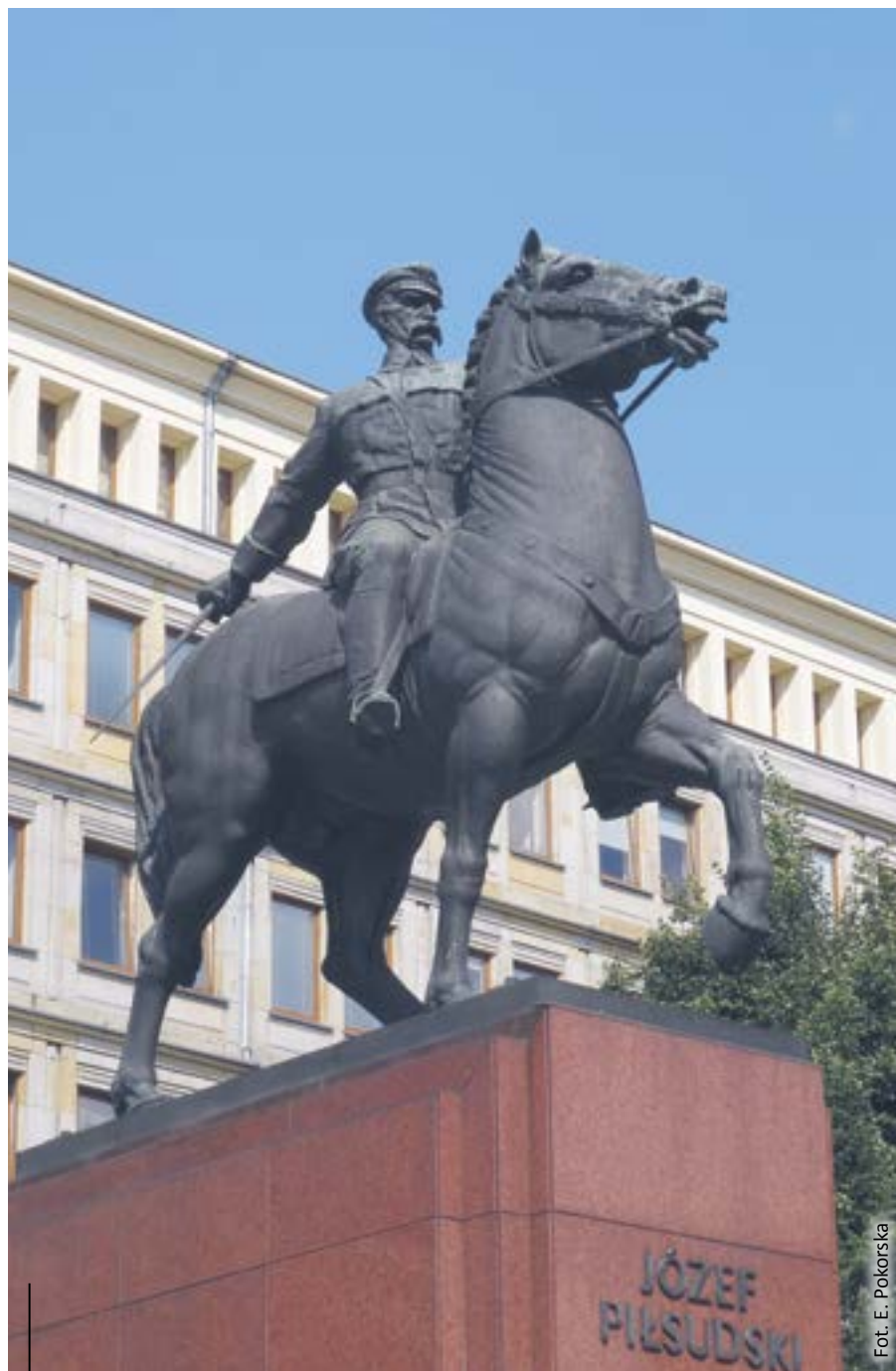
W 1989 r. konny posąg marszałka Piłsudskiego przewieziono do Katowic