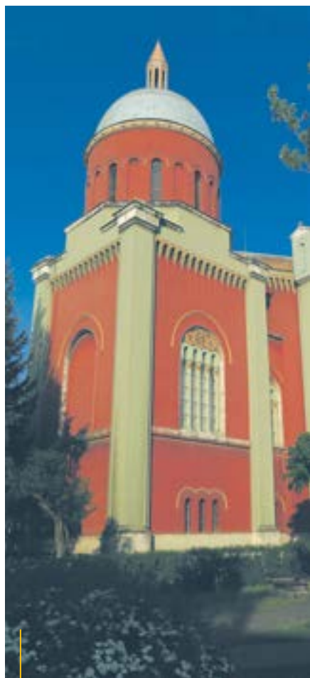
Nowy kościół ewangelicki w Kieżmarku zachwyca kompilacją różnych stylów architektonicznych, także orientalnych