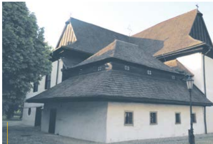
Zabytkowy, drewniany kościół ewangelicki Świętej Trójcy został wpisany na listę światowego dziedzictwa UNESCO

Zwiedzając Kieżmark natrafimy też na pochodzący z drugiej połowy XV wieku zamek miejski. Budowla miała chronić mieszkańców przed ewentualnym najazdem wrogów. Zamek został połączony z murami obronnymi. Przez dziesięciolecia zmieniał właścicieli i był wykorzystywany do różnych celów. Obecnie w jego wnętrzach znajduje się muzeum prezentujące m.in. historię zamku oraz rozwój Kieżmarku na przestrzeni wieków.