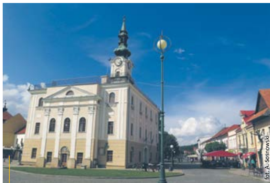
Klasycystyczny Ratusz – obecnie m.in. siedziba burmistrza Kieżmarku