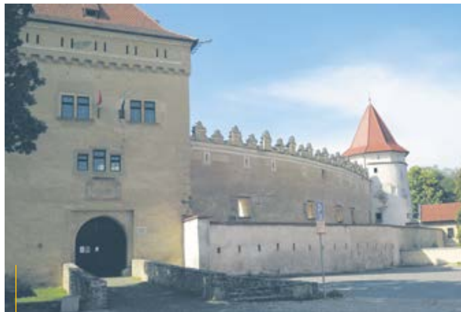
Zamek w Kieżmarku. W jego wnętrzach znajduje się muzeum