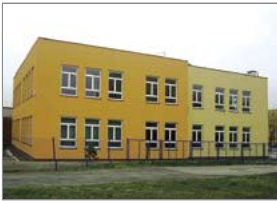
fol. W. Baran

W parterowej części budynku socjalnego znajdują się: świetlica, jadalnia z zapleczem kuchennym, sanitariaty, gabinet profilaktyki zdrowotnej oraz pokój psychologa szkolnego. Są tam ponadto wyodrębnione pomieszczenia dla Rady Osiedla Obrońców Pokoju, z osobnym wejściem od strony północnej. Na piętrze nowego obiektu utworzono natomiast szkolną bibliotekę i czytelnię. Usytuowano tam również pomieszczenia gospodarcze i techniczne oraz sanitariaty. Powierzchnia użytkowa całego budynku socjalnego wynosi 1.033 m 2 .